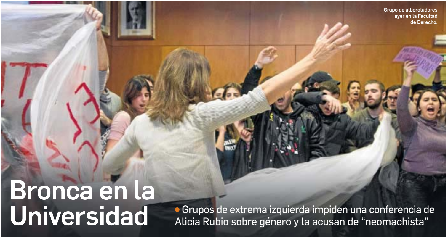
Grupo de alborotadores ayer en la Facultad de Derecho.

12 PODEMOS HABÍA RECLAMADO LA CANCELACIÓN DEL ACTO