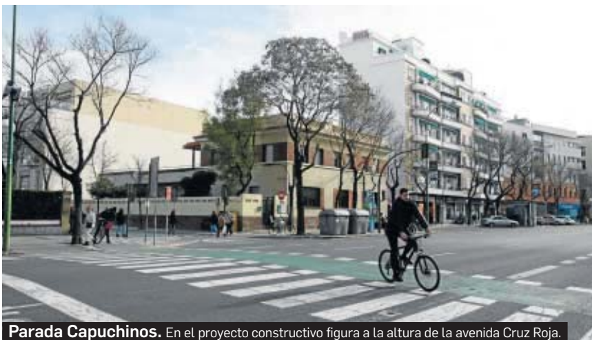
Parada Capuchinos. En el proyecto constructivo figura a la altura de la avenida Cruz Roja.

Otro avance de esta línea es el arqueológico. En 2010 el tramo de la ronda histórica se sometió a catas arqueológicas y los expertos concluyeron que no había restos arqueológicos de importancia. Descartaron la presencia de villas romanas en la ronda histórica a la altura de Muñoz León como con-