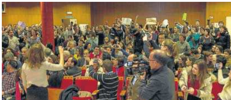
Protestas en el salón de grados de la Facultad de Derecho durante el acto.

El Cadus defiende que la ponente incita al odio y perjudica la lucha contra la violencia machista