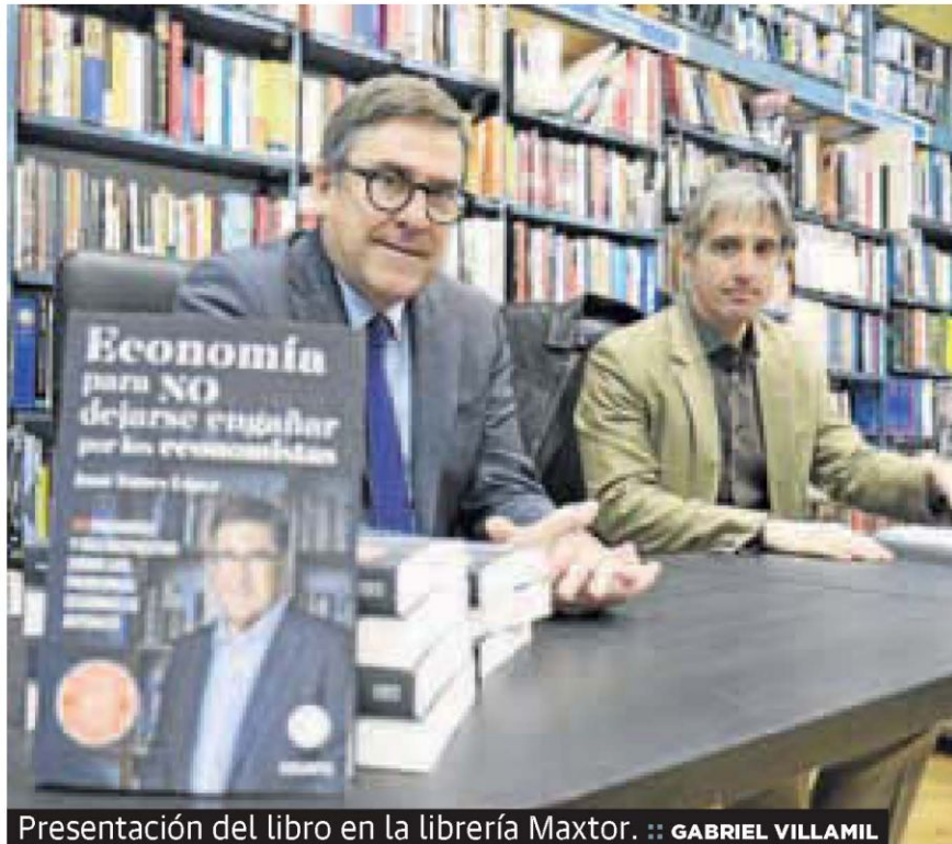
Presentación del libro en la librería Maxtor. :: GABRIEL VILLAMIL