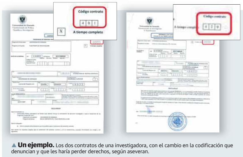
▲ Un ejemplo. Los dos contratos de una investigadora, con el cambio en la codificación que denuncia y que les haría perder derechos, según aseveran.

GRANADA. Los doctorandos de Granada, aquellos que inician un camino de investigación que culmina con el doctorado, están indignados por un cambio en sus condiciones laborales. El cambio en el tipo de contrato que han detectado este mes de febrero les ha 'encendido'. Es algo que afecta a unos 300 investigadores, entre los de la Universidad de Granada y los de las instituciones del Centro Superior de Investigaciones Científicas. Este asunto fue el que centró la asamblea que tuvo lugar ayer en la Facultad de Ciencias, una plataforma que se constituyó el pasado 2 de febrero y que incluye a trabajadores de la institución universitaria granadina así como de diferentes institutos del Consejo Superior de Investigaciones Científicas (CSIC). Ayer se reunieron para decidir las medidas que van a tomar para denunciar la situación que están viviendo. La asamblea denuncia «el cambio de codificación a nivel nacional de todos los contratos, al pasar de ser contratos predoctorales por obra y servicio (código 401) a contratos en prácti-