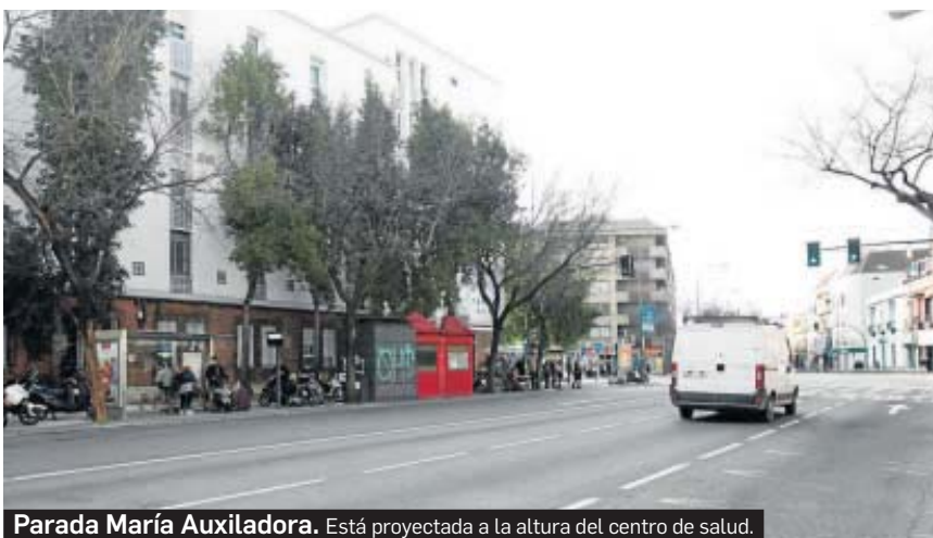
Parada María Auxiladora. Está proyectada a la altura del centro de salud.

clusión tras los trabajos arqueológicos dirigidos por el arqueólogo de la Universidad de Sevilla Fernando Amores e incluidos en el proyecto constructivo. De aquel análisis se estimó que si aparecían restos serían "excavables y removibles" con la autorización de la delegación provincial de Cultura. No obstante, las constructoras que resulten adjudicatarias de la obra tendrán que corroborarlo en las catas arqueológicas previas.