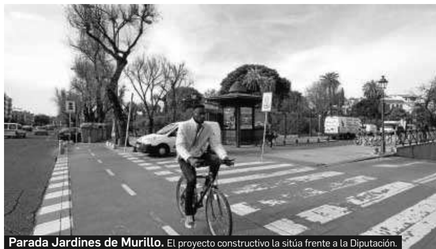
Parada Jardines de Murillo. El proyecto constructivo la sitúa frente a la Diputación.

Sin aludir a los avances de la línea 3 en 2012, Espadas dijo esta semana a la prensa que eligió este tramo para presentarlo al ministro de Fomento y lograr así la financiación de la otra mitad de la