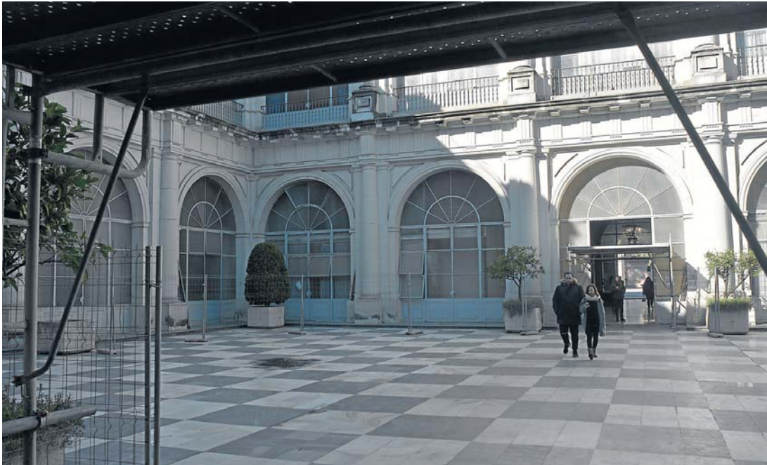
El patio oeste de la Real Fábrica de Tabacos, protegido con una valla por su mal estado y sobre el que ahora se actuará.