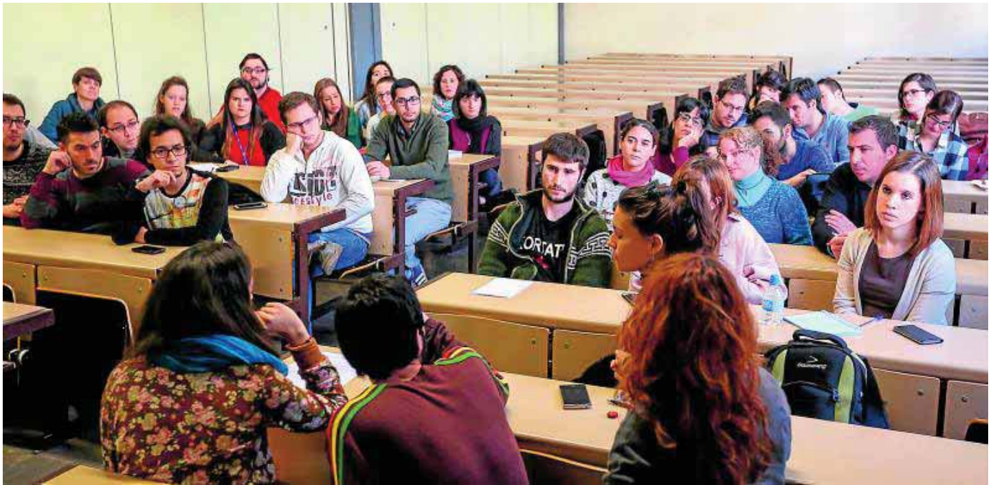
Imagen de la asamblea de investigadores celebrada ayer en la facultad de Ciencias.