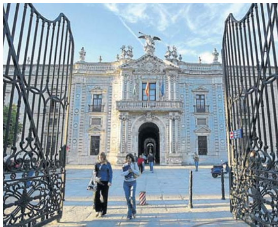
La reja de entrada al Rectorado por la calle San Fernando.