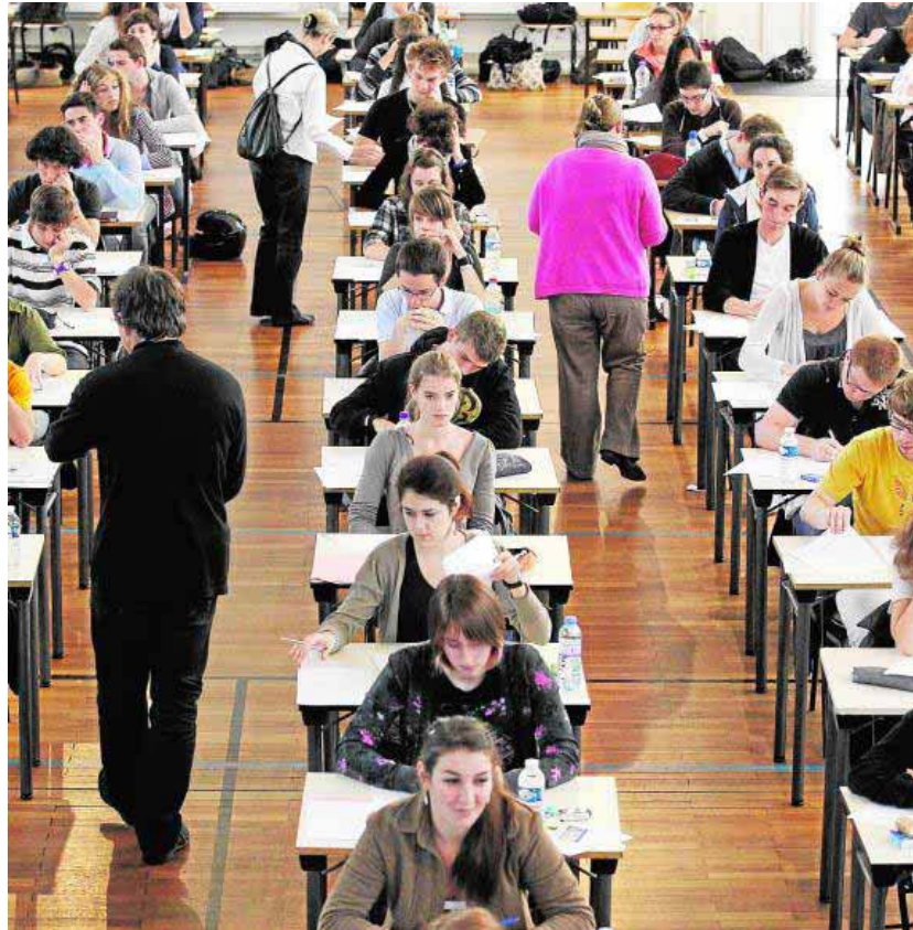
Alumnos, durante un examen en un instituto.

«En definitiva: careciendo de cualquier mérito», como concluye la propia exposición de hechos probados de la sentencia. Se trató, según la resolución, de un puro favor del docente a una amiga, la entonces «adjunta a la administradora de la facultad», que, a su vez, hizo de «intermediaria» para ayudar a una estudiante a la que tampoco consta que conociese, comportamiento por el que también la adjunta fue condenada a la pena de inhabilitación por siete años, como «cooperadora necesaria» para que se cometiese la prevaricación.