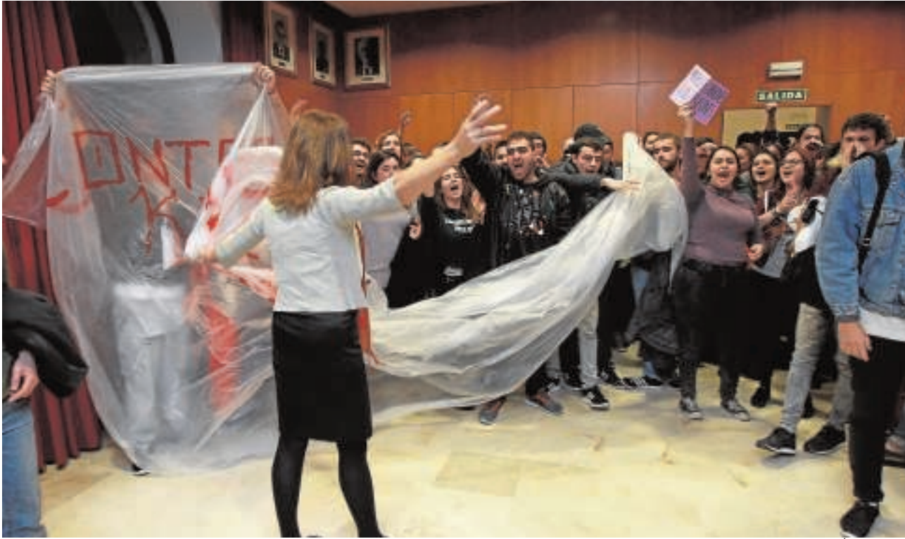
En el transcurso de la protesta se vivieron momentos de tensión