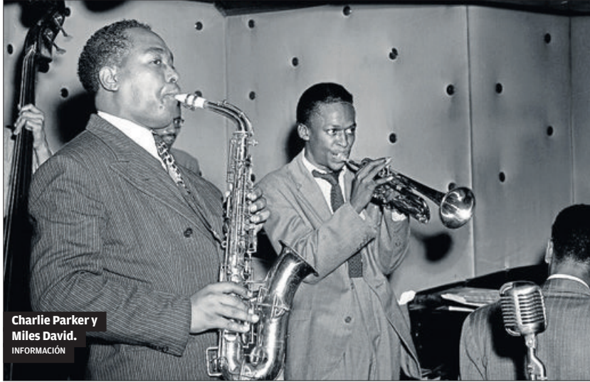
Charlie Parker y Miles Davis. INFORMACIÓN

¿Será el jazz a la poesía lo que el rock a la narrativa? El propio antó-