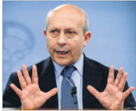
El ministro de Educación, José Ignacio Wert.

La misiva, a la que ha tenido acceso Cinco Días , está fechada el pasado viernes, 14 de marzo. En ella los altos