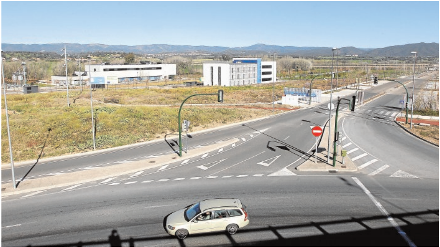
Incubadoras de empresas de Rabanales 21, los edificios Aldebarán, Centauro y Orión