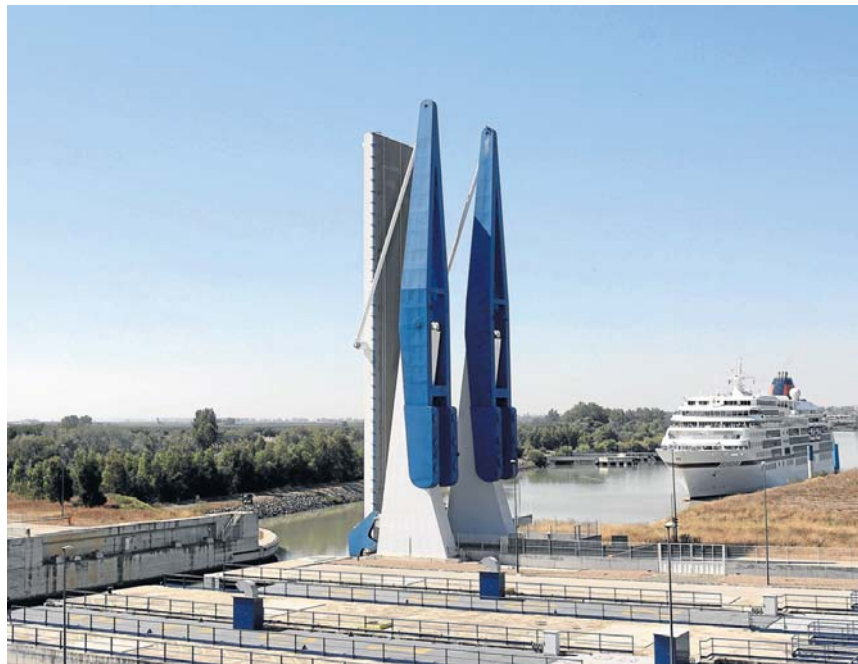
La esclusa del Puerto costó 163 millones de euros y permite la entrada de buques más grandes.

El Puerto suspende el proyecto, pide a Junta y Gobierno un plan de gestión integral y admite, por fin, que la sostenibilidad del estuario condiciona su actividad