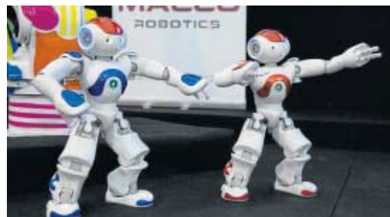
Dos androides de tecnología avanzada de la empresa Macco Robotics.

por supuesto, necesita la colaboración tanto de los técnicos como de los propios equipos de gobierno de los consistorios. Por otra parte, la Diputación, junto con Inpro y Prodetur, están realizando una activación de la economía digital de la provincia, motivo por el que se pretende reconocer el esfuerzo que las empresas del sector tecnológico están haciendo en pro de la innovación en los gobiernos locales y en los ayuntamientos. De ahí, la necesidad de editar un Premio Empresa E-government 2016 que realmente valore el esfuerzo o la inversión.