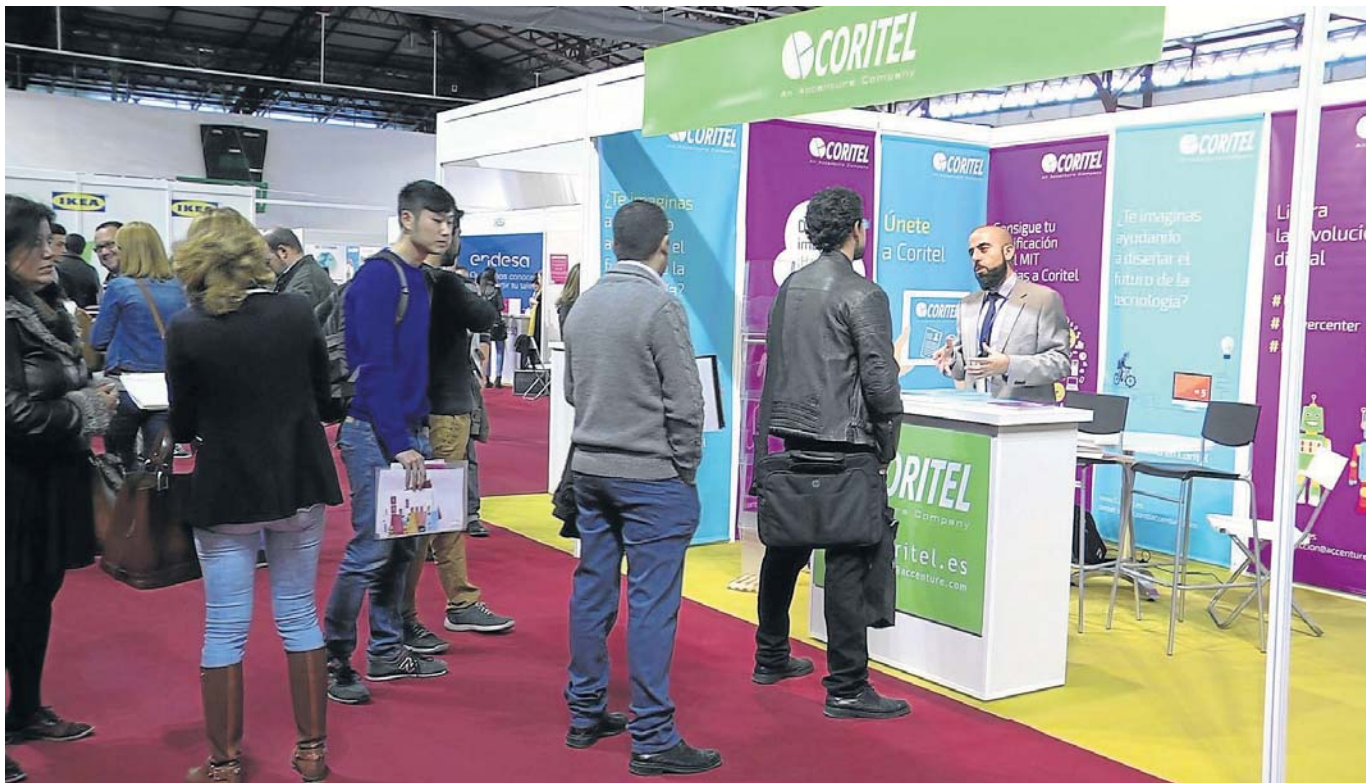
Cerca de 70 empresas ofertan puestos de trabajo en la Feria del Empleo que organiza la Universidad de Sevilla.