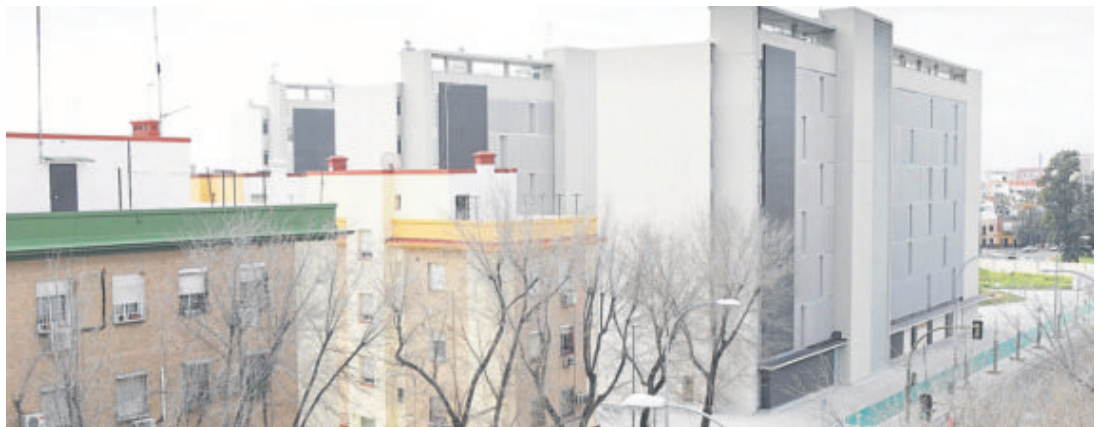
Los edificios que forman Nuevo Amate se distinguen claramente de la tipología habitual en la zona.