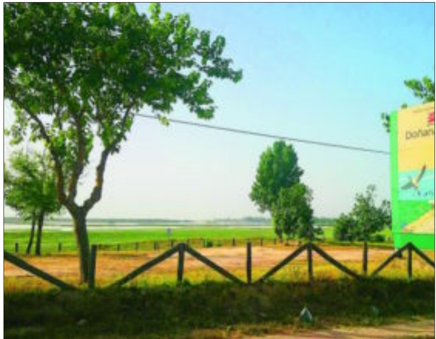
El espacio natural de Doñana abarca terrenos de Sevilla y Huelva

ducida que comporta». Es más, equiparan el peligro que encierra el «Proyecto Marismas» en ese sentido, con el paralizado «Proyecto Castor», que supuso el pago de una indemnización de «cientos de millones de euros» a la promotora. «Es lo que parece estar buscando Gas Natural-Fenosa con sus reclamaciones patrimoniales de más de