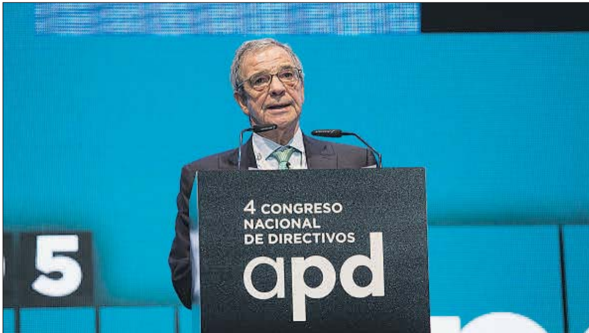
El presidente de la Fundación Telefónica, César Alierta, en la jornada del Congreso Nacional de Directivos.