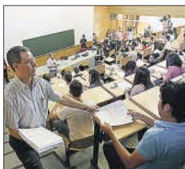
Aula de una universidad.

Según el departamento de Educación, estos nuevos criterios permi-