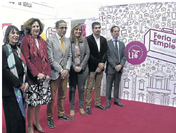
El rector de la Hispalense presidió la inauguración.

Entre las empresas participantes se encuentran algunas de prestigio nacional e internacional, como Renault, Endesa, Schneider, National Nederlanden, Ikea o Helvetia, junto a otras cuyo ámbito es más local aunque con gran proyección como Engranajes Culturales o Geographica. Además, participan organismos públicos, como el Servicio Público de Empleo, el Servicio Andaluz de Empleo, el Ayuntamiento