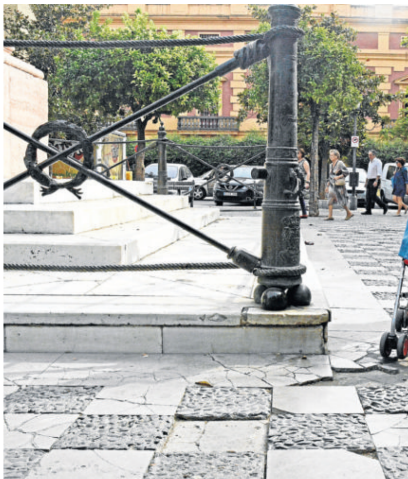
En la primera imagen, dos vecinas conversan en la puerta de sus casas en el barrio de Amate; en la segunda, una mujer pasea por la zona peatonal de la plaza de la Gavidia. / José Luis