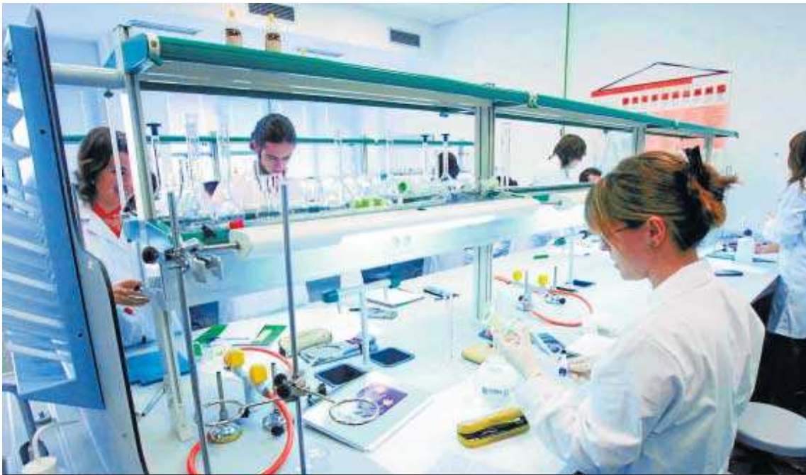
Un grupo de investigadores de la Facultad de Biotecnología de la Universidad Pablo de Olavide de Sevilla.