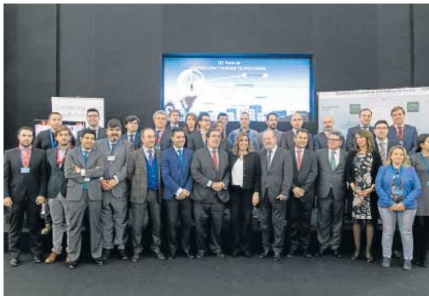
Una foto de familia de los protagonistas de la III Feria de Innovación y Nuevas Tecnologías.

Además, incluye una extensa agenda de talleres y ponencias complementarias al área expositiva dirigidas al personal profesional del sector tecnológico y a los técnicos de las administraciones públicas. Como seña-