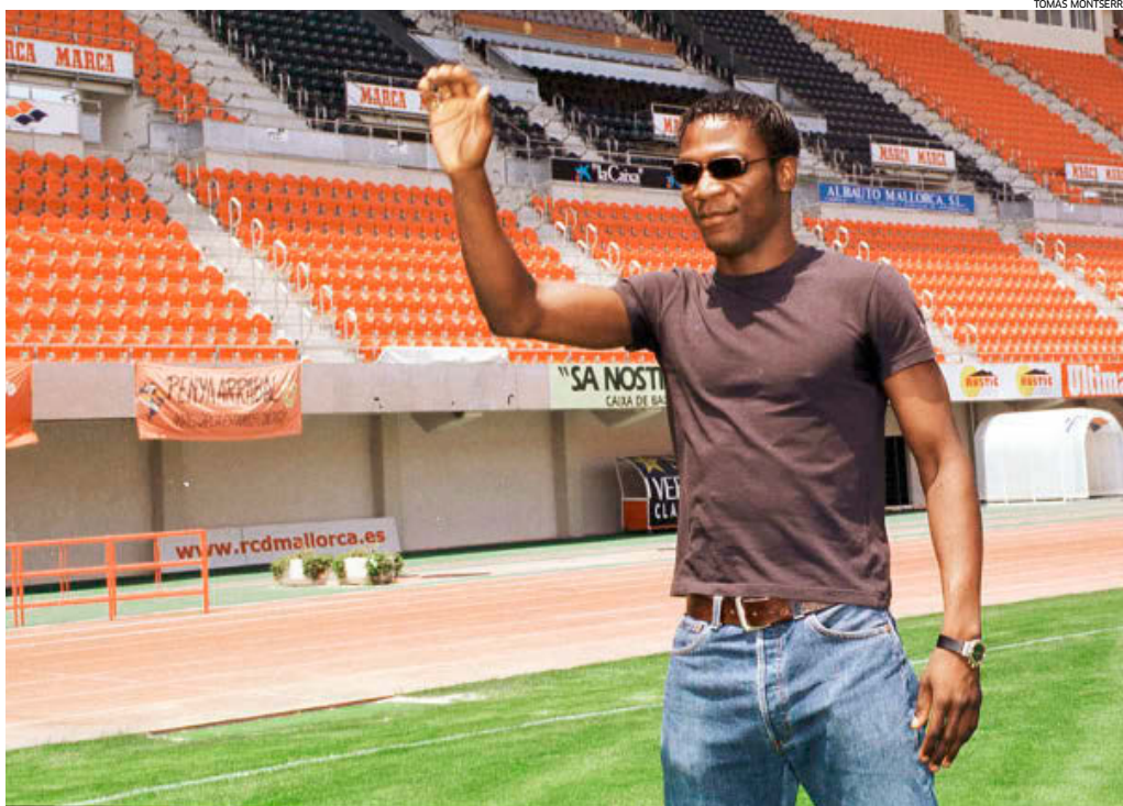
Lauren durante su etapa como jugador del Mallorca en la temporada 1999-00.