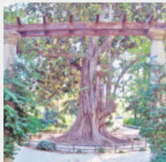
Árbol de las lianas en la Glorieta de Goya.

Existen en Sevilla ejemplares de árboles tan curiosos como el árbol de las lianas, situado en la glorieta dedicada a Goya en el Parque de María Luisa, o el ginkgo biloba, considerado un fósil viviente, símbolo de longevidad y una de las maravillas del mundo vegetal. En el Parque del Alamillo crecen al menos una treintena de especies de árboles, y en el Parque José Celestino Mutis existen 143 árboles y arbustos de diferentes géneros y siete tipos distintos de palmeras. En consecuencia, esta zona verde del distrito está considerada uno de los conjuntos botánicos más importantes de la ciudad. La antigua rosaleta del Parque de los Príncipes es única en la ciudad, al igual que su conjunto de cítricos.