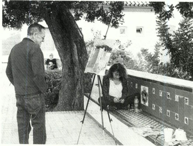
Un vecino contempla una de las obras de los artistas en el paseo.

vias caídas en la Sierra Sur motivaron que se pospusiera hasta su celebración en la mañana del jueves. Cargados con pinceles, óleos, caballetes e incluso los lienzos, un grupo de 50 artistas dibujaron diferentes enclaves que se pueden observar desde el Paseo del Gallo. Según la profesora de la Universidad, el objetivo no es otro «que estos alumnos plasmen su visión particular del paisaje moronense, desvelando las riquezas, particularidades y bellezas». Y aunque todos estaban alrededor del