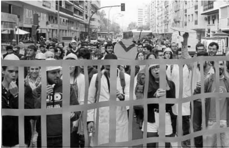
Imagen de la manifestación de la Politécnica para exigir una solución a sus problemas.

Aunque es cierto que desde hace años algunos centros de la Hispalense han mantenido contactos muy informales con el Ayuntamiento de Sevilla para estudiar la posibilidad de instalarse en la Fábrica de Artillería, lo cierto es que desde el Rectorado —que es el único que puede tomar la decisión final— se descarta por completo estos movimientos. Las razones son varias, pero sobre todo están relacionadas con el elevadísimo coste que supondría la restauración de un enorme edificio del siglo XVIII de más de 20.000 metros cuadrados. Aunque las obras de urgencia que se van a acometer ahora ascienden a poco menos de 500.000 euros, lo cierto es que arreglar el