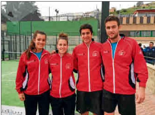
Representantes de la Universidad de Sevilla en la modalidad de pádel.