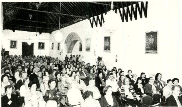
El paraninfo de la Escuela Universitaria se llenó de alumnos.

En la misma línea se manifestó la vicerrectora de la Hispalense, que apostó por abrir la institución y propagar su actividad a toda la sociedad. Elena Cano argu-