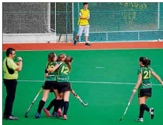
El Universidad de Sevilla disputará su último partido del curso en casa.

Recibirán al Júnior en un partido que no contará con la jugadora Pampín