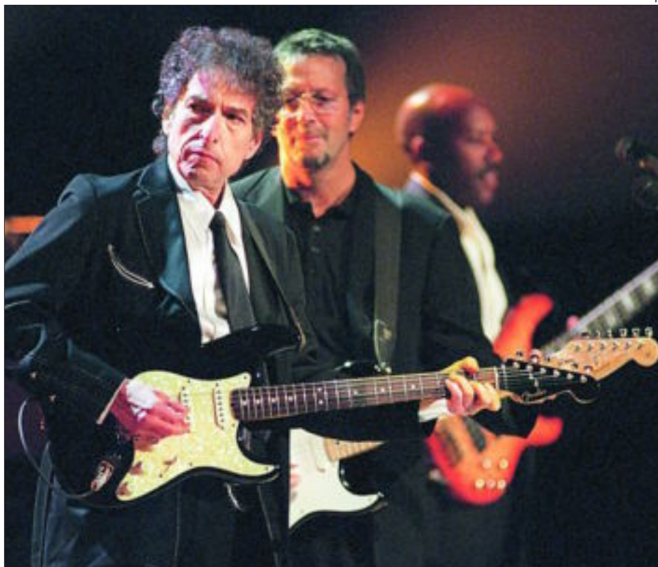
El cantante y premio Nobel de Literatura, Bob Dylan