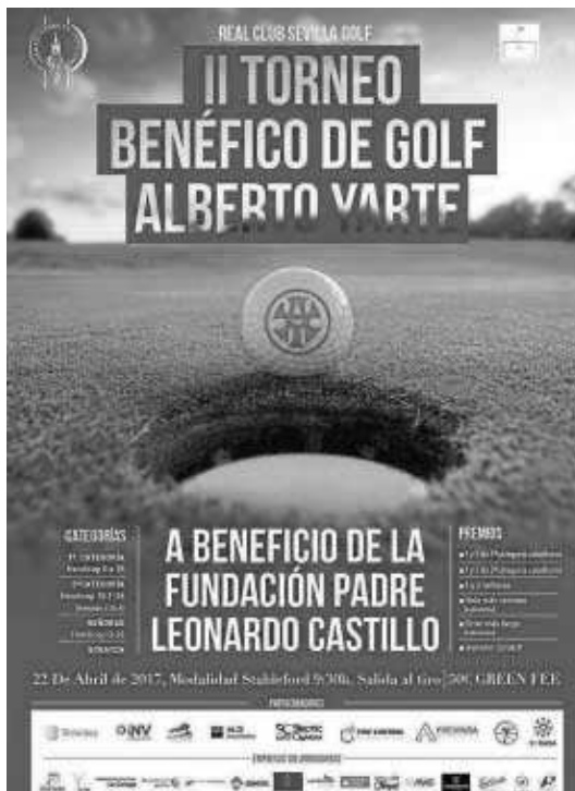
Cartel del evento.

El Real Club Sevilla Golf es reconocido como el 5º mejor campo de España. Se trata de un campo que ha albergado pruebas de carácter europeo. La mo-