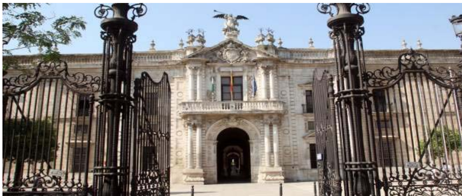
Rectorado de la Universidad de Sevilla