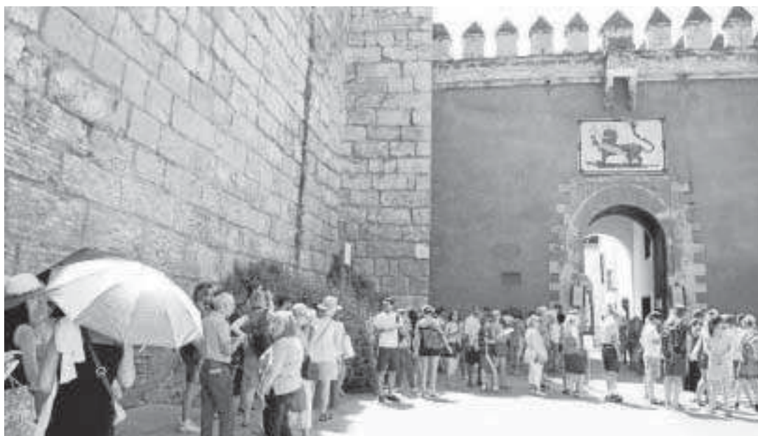
Una cola de turistas en la entrada del Alcázar de Sevilla.