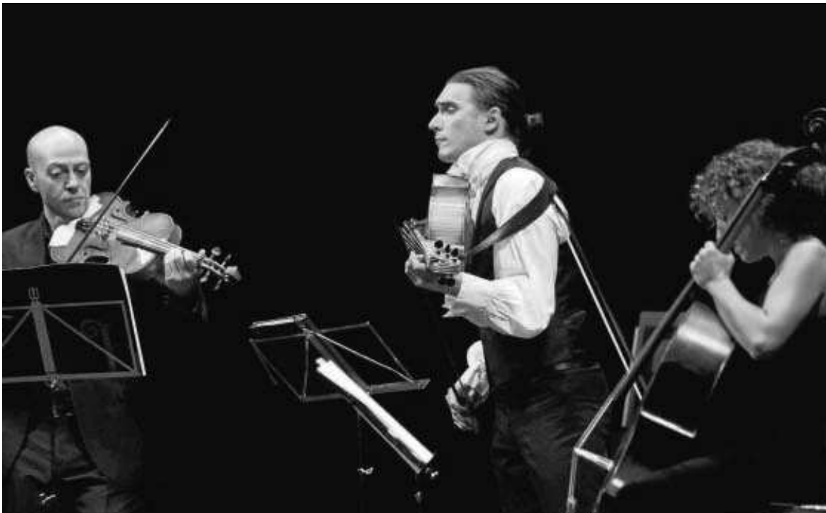
Concierto inaugural de la temporada de la OBS en el Lope de Vega, que supuso el debut en Sevilla del solista ruso Sergey Malov.