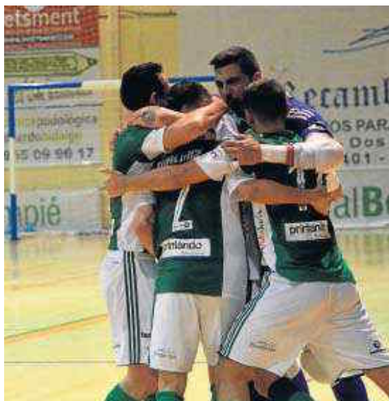
Varios jugadores béticos festejan el triunfo ante el Barcelona B.

Los béticos ya han superado el varapalo de la derrota en Cartagena con un gol fuera de tiempo y desde hace dos semanas trabajan con la mente puesta en este