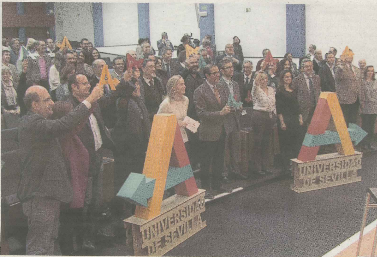
El fin de fiesta llegó con la foto de buena parte de los implicados en el proyecto Anticipa con el logo de la iniciativa.

«Anticipa, lo que pretende establecer -retoma su reflexión Carmen Barroso- son esos puntos de acuerdo, de conexión, que manifiesten las prioridades fundamentales para el futuro de nuestra universidad. Vivimos un momento de enormes cambios, cambios que se están produciendo en el ámbito docente, investigador, de transferencia, de cultura», enumera co-