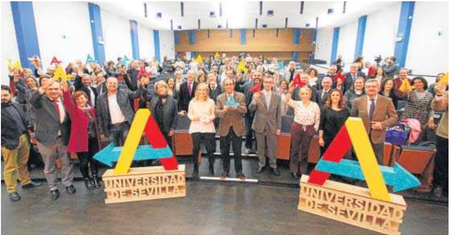
Un momento de la presentación del proceso Anticipa, celebrada ayer en la Facultad de Filosofía.