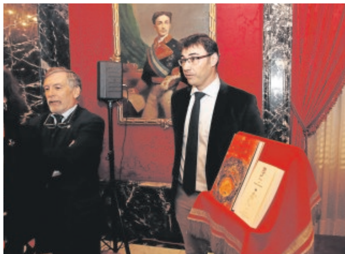
Un momento del acto celebrado ayer en la Real Maestranza

Una de las razones que cita el propio autor en su libro es la controversia que envuelve a la tauromaquia e, incluso, al arte relacionado con la Fiesta, a pesar de haber transitado este camino artistas de la talla de Goya, Fortuny, Picasso, Manet... «Creo que estamos hoy en día dentro de un pensamiento políticamente correcto que hace que, más allá de los círculos de los aficionados,