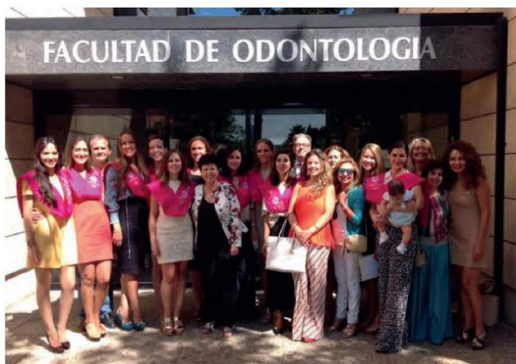
Alumnas y profesores de los másteres, tras la ceremonia de clausura.

El acto solemne no estuvo exento de emotividad, que se reflejó en las palabras de los profesores y los alumnos, y en la repercusión de éstas en las familias presentes. Tras la entrega de becas y diplomas, y la expresión de agradecimientos a profesores, colaboradores, asistentes y a la firma Johnson & Johnson, se clausuró el acto con la audición del "Gaudeamus".