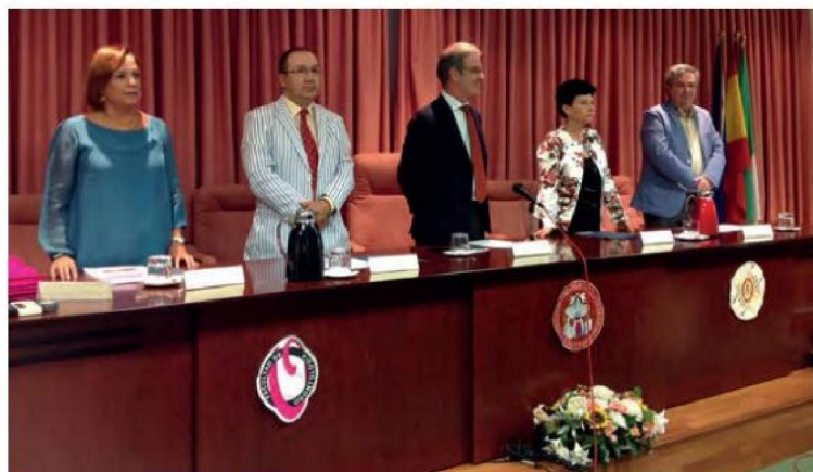
La mesa presidencial, durante el acto de clausura.