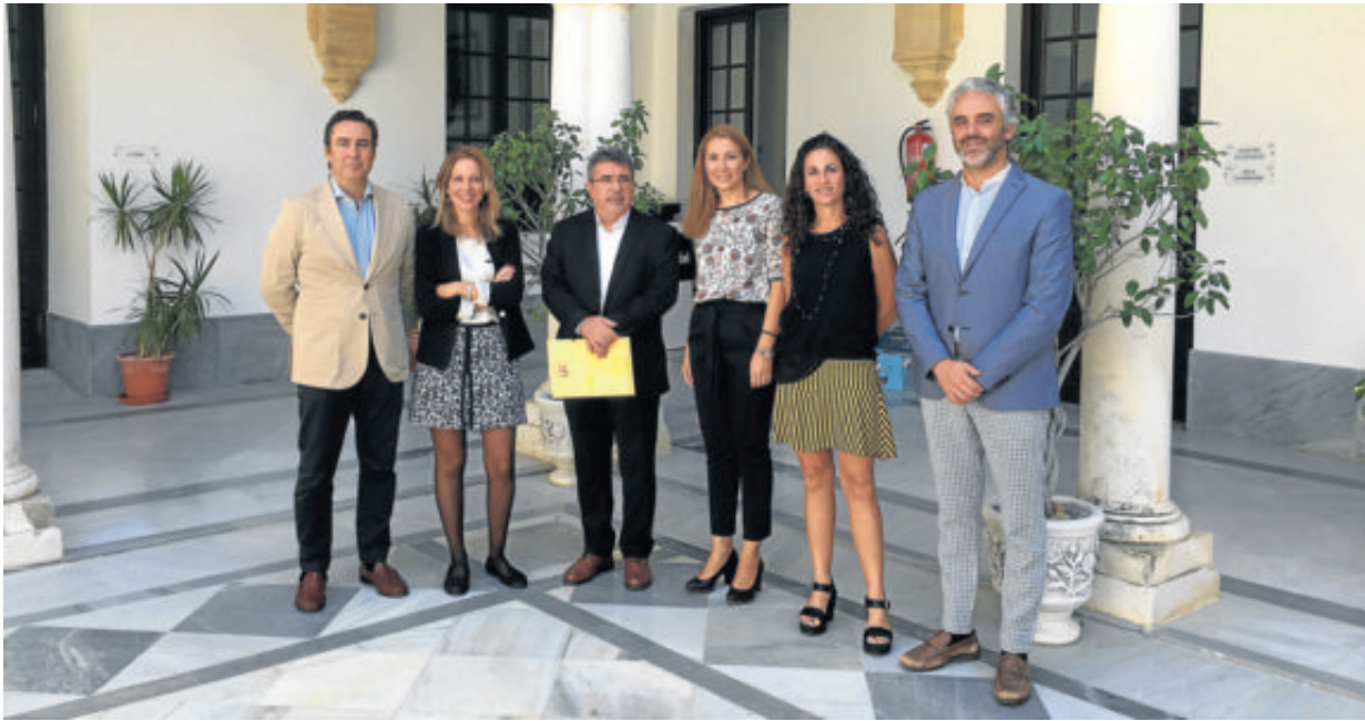
Foto de familia de los protagonistas del curso de clausura 'La tarea de educar'.