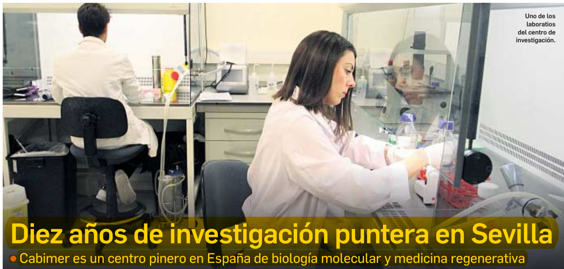
Uno de los laboratorios del centro de investigación.

13 EN LOS LABORATORIOS DE LA CARTUJA TRABAJAN 19 GRUPOS DE INVESTIGACIÓN EN ACTIVO