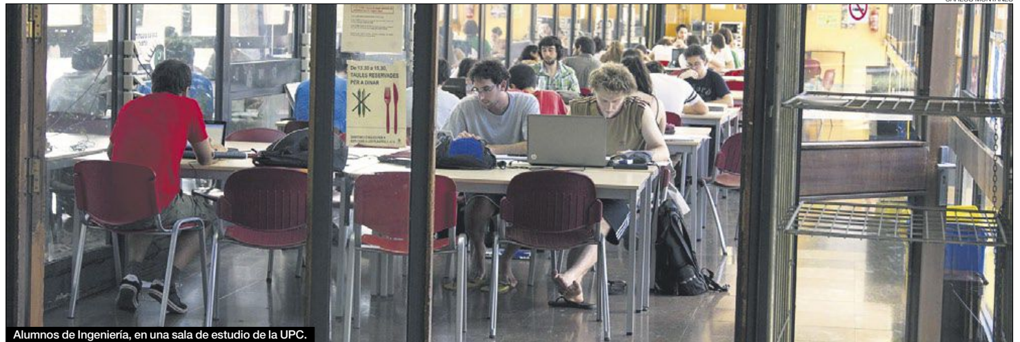
Alumnos de Ingeniería, en una sala de estudio de la UPC.