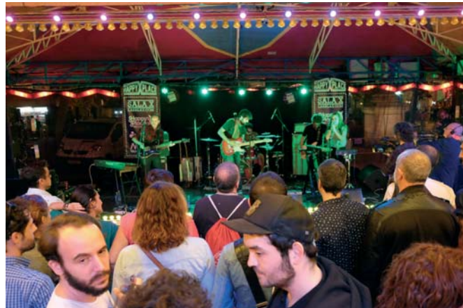
Multitud de personas durante uno de los conciertos de la primera edición en Sevilla del Monkey.

La programación se ha completado con las actividades paralelas que comenzaron el lunes 10 de octubre con la proyección de documentales y conciertos en el Cicus, y que continuaron con la batalla de bandas organizada por Radio 3, los minishowcase profesionales, las presentaciones de libros con vis a vis con músicos y autores en librerías, el Festikids especialmente diseñado para niños, además del escenario Leozinho que se levantó en el Centro Cívico El Esqueleto como continuación del trabajo que dicha ONG realiza en el