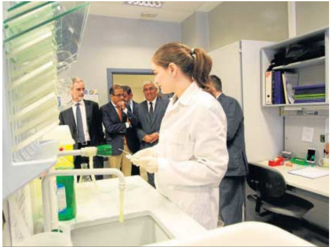
El consejero de Salud, el rector de la Hispalense y el consejero de Economía en la visita al centro de investigación.