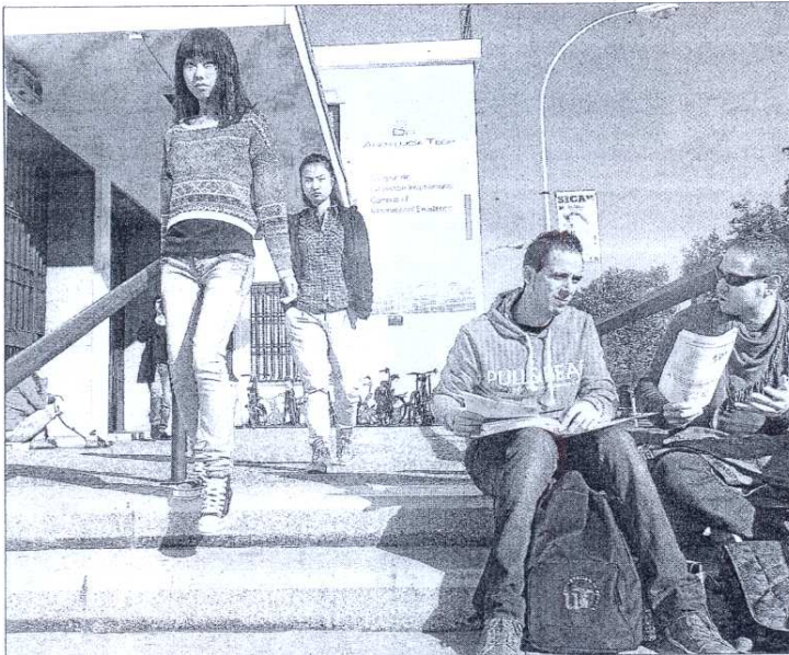
Centro Internacional de la US, donde se ubica la Oficina de Cooperación al Desarrollo. / US

El Observatorio sobre movilidad humana: Justicia en Movimiento se alinea, pues, con este fin, aportando un nuevo enfoque analítico desde una perspectiva crítica que sus componen-