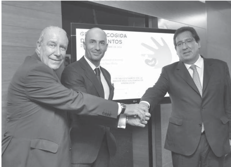
Imagen del día

La Delegación de Movilidad y Seguridad ha ordenado a la Policía Local una supervisión aún más intensa de la que hace habitualmente sobre la seguridad del transporte escolar al inicio del curso.