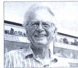
El profesor Richard A. Andersen.

Por este motivo, una de las primeras intervenciones que están llevando a cabo desde el Observatorio, y que se espera que se desarrolle durante los años 2014 y 2015, es la elaboración de un Manual de Buenas Prácticas en la Atención a Grupos Vulnerables en tránsito migratorio por México, dirigido al personal de albergues y centros de atención a migrantes con el objetivo de orientar y profesionalizar su acción. El proyecto está siendo financiado por la Asociación Fomento de Investigación y Cultura Superior A.C. de México, así como apoyado por otras acciones realizadas por el Observatorio como publicaciones, seminarios y talleres.