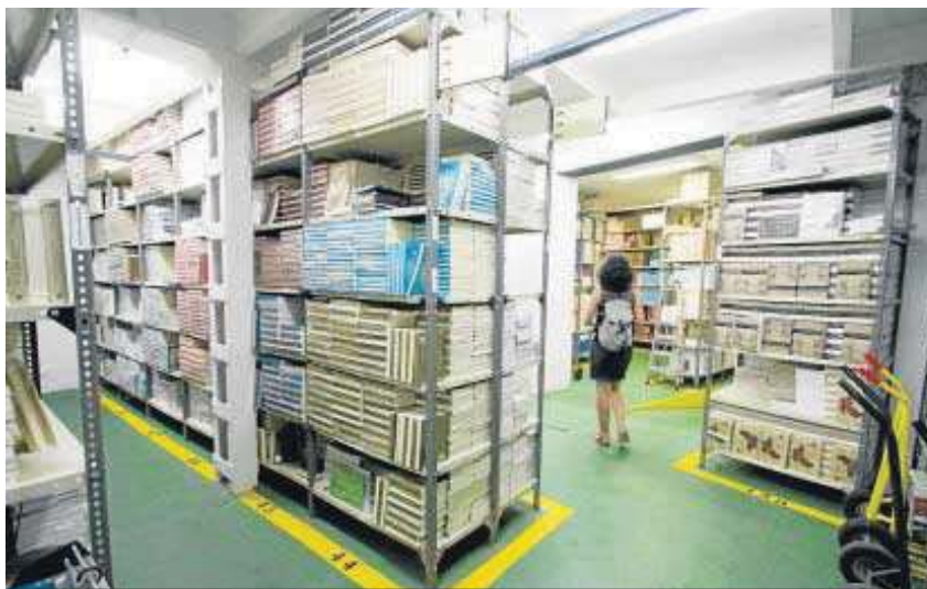
Arriba, el almacén de la editorial, en la calle Porvenir. Abajo, el ejemplar publicado por la US más antiguo que se conserva.