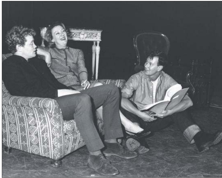
El dramaturgo Joe Orton (derecha), con los actores Dudley Sutton y Madge Ryan, durante un ensayo de su obra Entertaining Mr Sloane, en 1964.