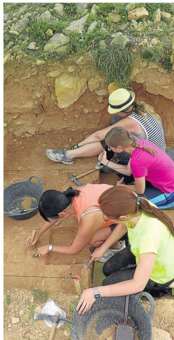
Tareas de excavación en el yacimiento.

Texto: Laura Cester