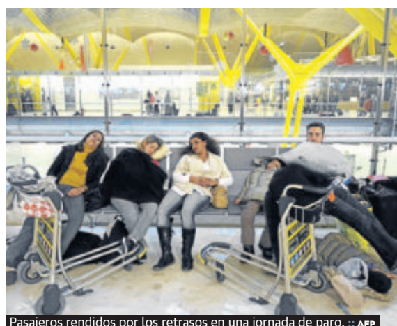
Pasajeros rendidos por los retrasos en una jornada de paro.