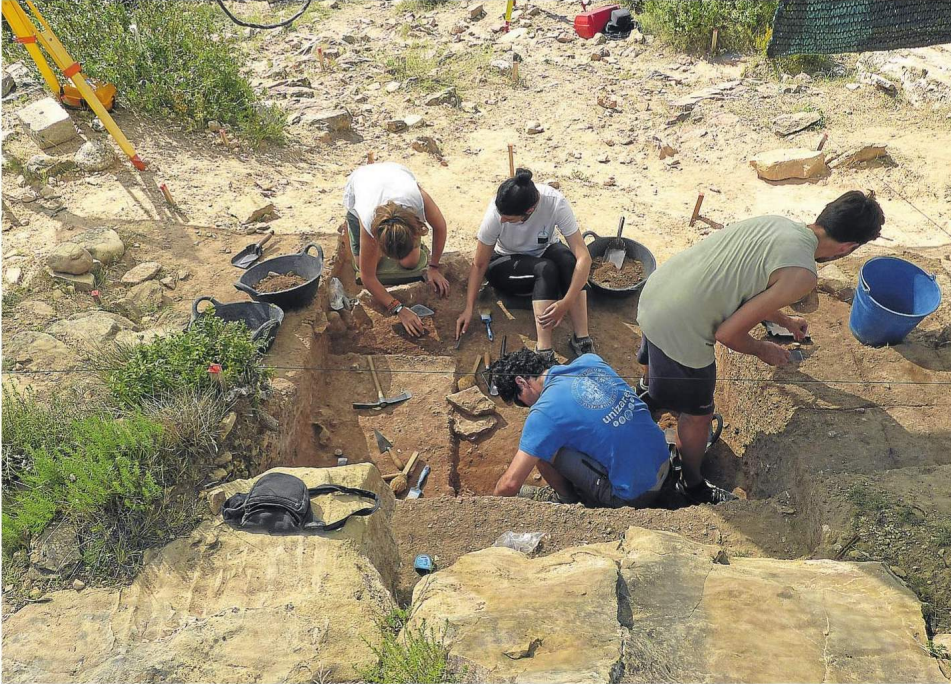
Participantes trabajando en el yacimiento Roca San Miguel en Arén (Huesca).