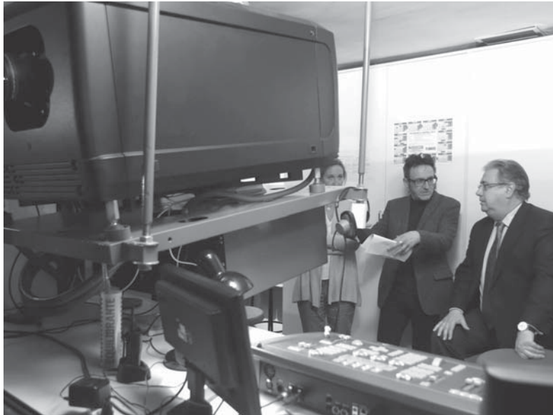
Imagen del día

Ha tenido que ser el Tesoro de Estados Unidos el que haya alertado del blanqueo de capitales a través del Banco Madrid, lo que demuestra una vez más los fallos de supervisión del sistema por el Banco de España.