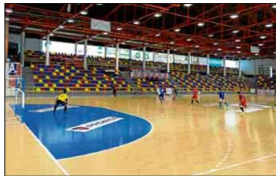
Corto periplo para los representantes de la Universidad de Sevilla.

junto sevillano, que se despidió así del campeonato autonómico con una medalla de bronce que sabe a poco. En cuanto al fútbol sala, tras la buena imagen dada frente a la Universidad de Jaén, los hombres de Manuel Aranda saltaban al terreno de juego con la confianza de poder aspirar a la final sabiendo del potencial de su plantilla. Sin embargo, en un partido igualmente, la mala fortuna hizo que, a dos minutos para la conclusión del encuentro, Granada marcara de falta directa el 3-4 definitivo que apearía a los sevillanos de la competición.