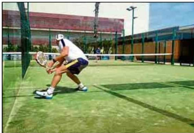
El pádel cuenta con mucho tirón entre los usuarios del SADUS.

Las inscripciones permanecerán en funcionamiento hasta el 6 de abril