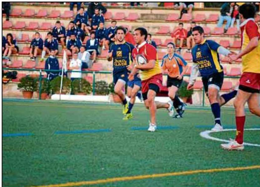
Las selecciones de rugby 7, tanto en categoría masculina como femenina, entran en liza.