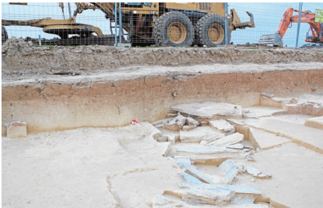
Parte de los restos hallados en Valencina de la Concepción durante las obras del carril-bici