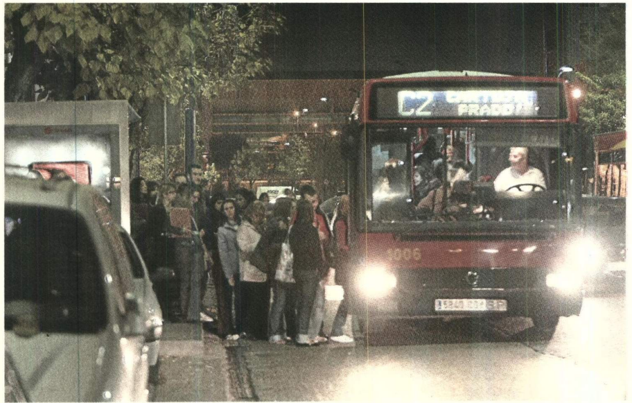
Estudiantes de Comunicación subiendo al autobús en la Cartuja, en una imagen de archivo.

El documento defiende problemáticas en materia de becas y matrícula, financiación pública, gobierno universitario, inserción laboral y calidad docente. Dentro de las reivindicaciones destacan la reconstrucción de la politécnica, que se encuentra en mal estado; plan de becas andaluz; B1 gratuito para los estudiantes andalu-