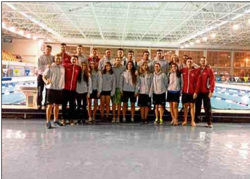
Buen papel de los representantes del Universidad de Sevilla en el Campeonato de Andalucía de natación.