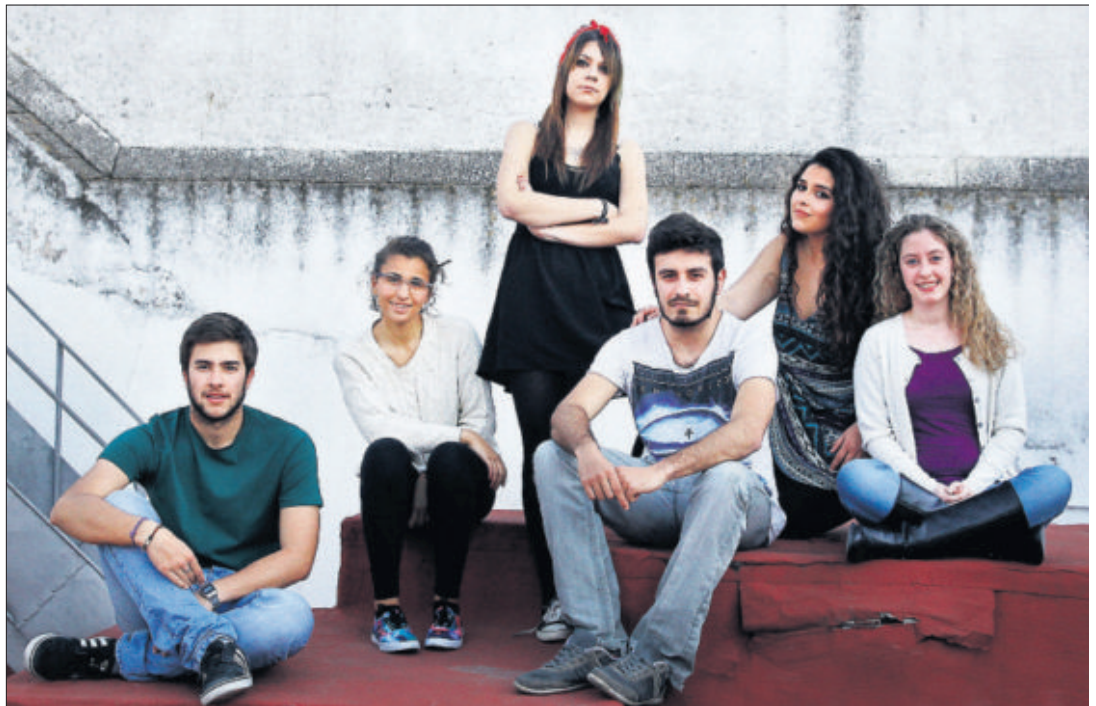
Un grupo de nuevos votantes de entre 18 y 20 años, estudiantes de bachillerato y universitarios, en Sevilla.

La formación y la educación vuelven a situarse en el eje del debate, y también la información generada sobre política en los medios de comunicación. "Necesitamos unos medios limpios y transparentes para generar opinión, si no, ¿en quién confiamos? ¿Y si al final te acabas arrepintiéndote?", se pregunta Carbón, que si se siente preparada para echar su papeleta en las urnas el domingo. "Tenemos que votar, conscientemente y formados. Después de tantas personas, entre ellas muchas mujeres, que han muerto para conseguir este derecho... Hay que ir a votar", alienta.