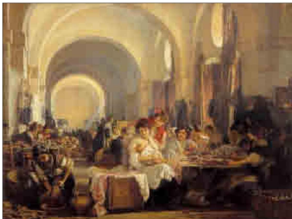
Cuadro de Gonzalo Bilbao con una cigarrera amamantando a su bebé en el tajo.

La mayoría sabe que el actual campus de la Universidad de Sevi-