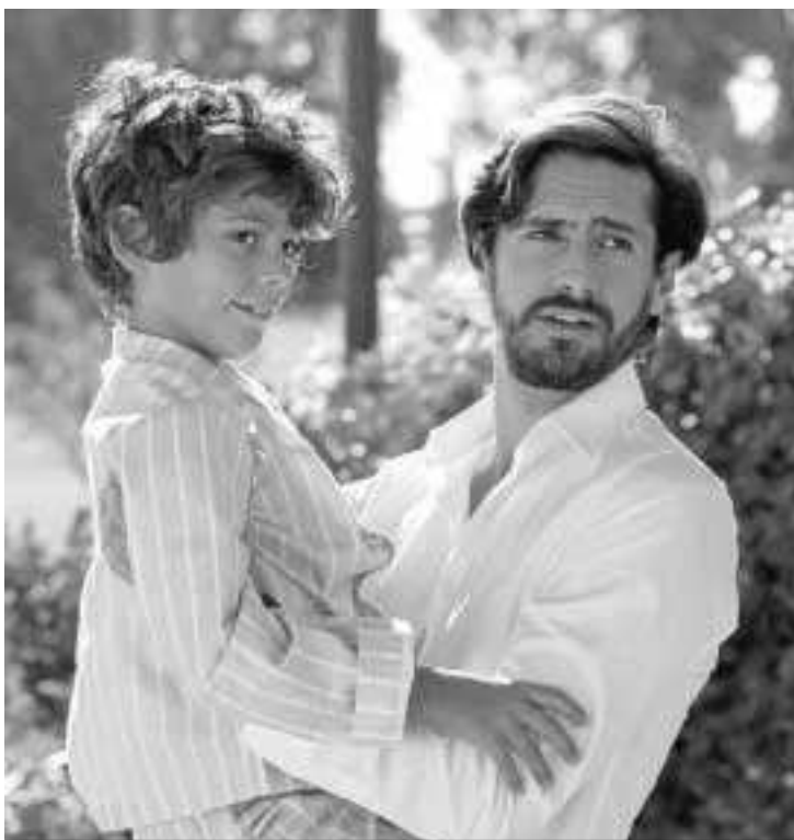
Fotograma de 'La ignorancia de la sangre', película que se inaugura la muestra. M. G.

Entre las obras que se podrán ver esta edición, destacan La ignorancia de la sangre , de Maestranza Films, que inaugurará la muestra hoy; Al ritmo de la calle , de Arte Sonora; Azul y no tan rosa , de Malas Compañías; Habitar la utopía , de Intermedia Produc-