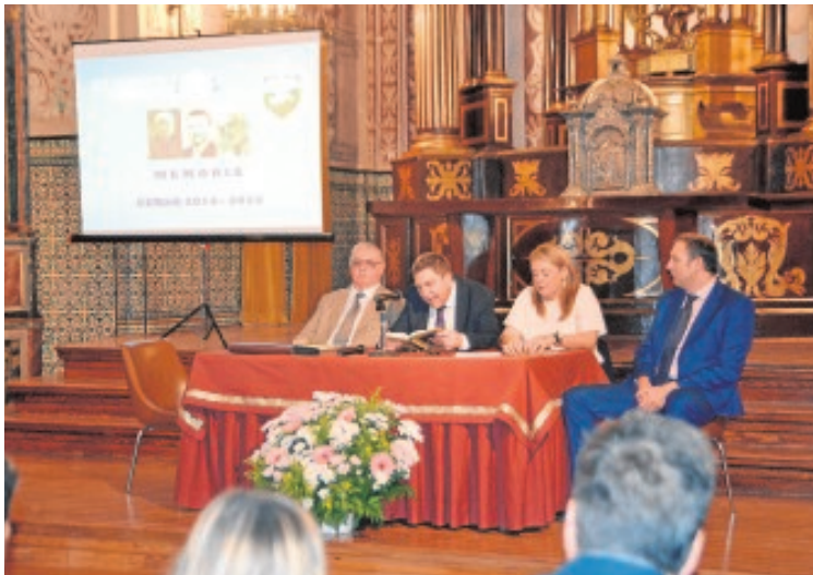
Inauguración del curso escolar del Buen Pastor y el St. Mary's School ABC