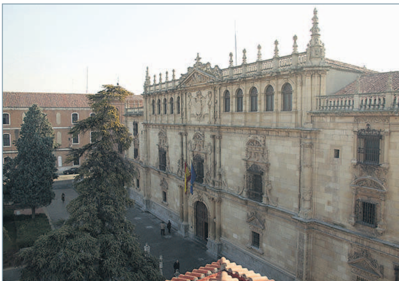
Arriba, fachada de la Universidad de Alcalá, en Madrid. En la imagen inferior, la Universidad de Cambridge, en Reino Unido.

Sin embargo, a la hora de elegir una región u otra, el precio puede ser un aspecto decisivo. En Escocia, los estudios universitarios de grado son gratuitos, mientras que en el resto de Reino Unido, el Gobierno ha fijado una tasa máxima