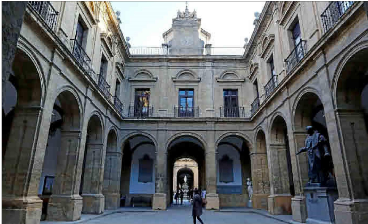
La antigua Fábrica Real de Tabacos de Sevilla, que en la actualidad alberga el Rectorado de la Universidad y aulas de Filología y Geografía e Historia.