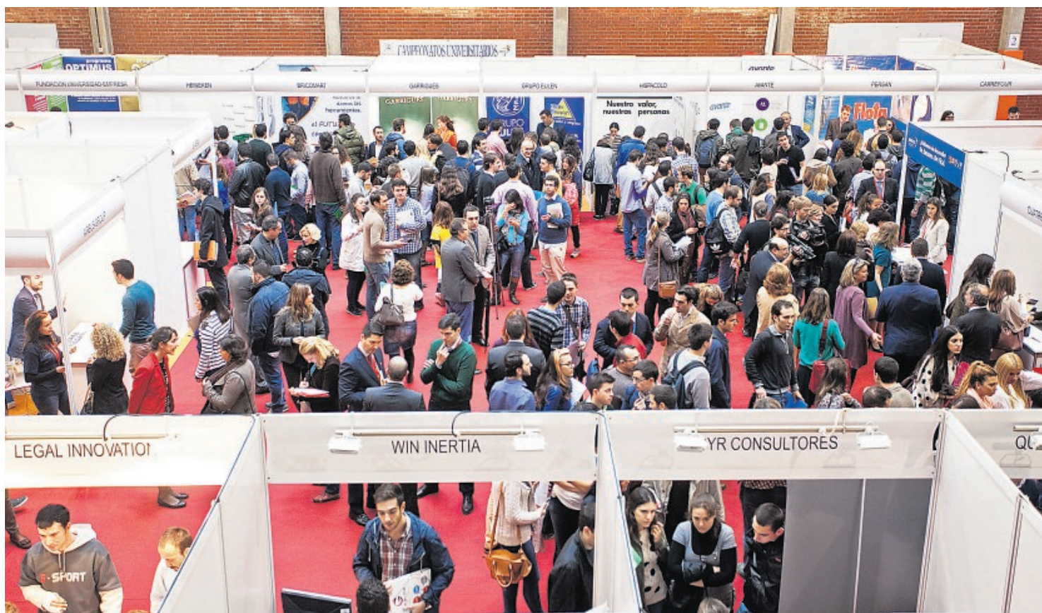
Participantes en la primera edición de la Feria del Empleo de la Universidad de Sevilla