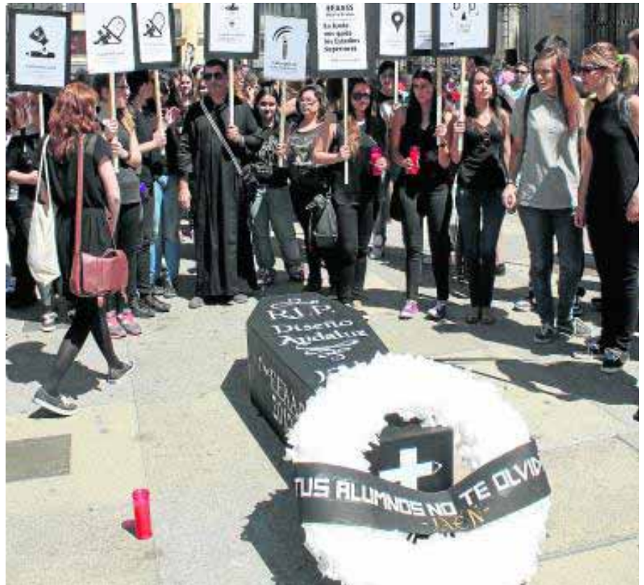
Protesta de alumnos de diseño el pasado mayo.

«La asociación de directores les presentamos un informe dándoles distintas opciones antes de la suspensión de los estudios, como la