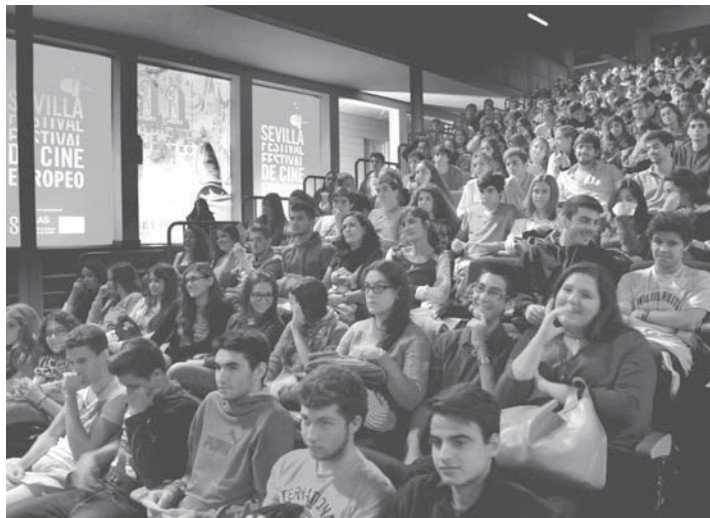
Los espectadores llenaron las salas del SEFF, con más de la mitad de las películas con lleno absoluto. SEFF

res en sala, un total de 7.489 han acudido a las proyecciones de la selección EFA; 6.828 a las Sección Las Nuevas Olas, y 2.879 a Resistencias. Junto a las secciones a competición más representativas del SEFF, que han aglutinado a la mayoría del público, destacan Panorama Andaluz, con 2.974, y Special Screening, con 3.813.