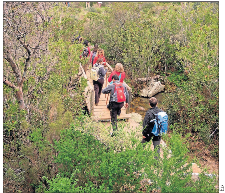
El 13 de diciembre, nueva actividad del SADUS en el medio natural.

Para poder realizar esta ruta, muy recomendada, es indispensable que reserven su plaza en la página web oficial del SADUS, o bien acudiendo a la Oficina de Atención al Cliente para asegurar la plaza el día 13.