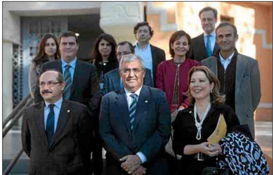
El rector de la US, entre el vicerrector y la directora de Investigación; detrás, los investigadores premiados.

Su vicerrector de Investigación, el físico Manuel García León, se felicitó antes de que la US sea la segunda de España que más fondos nacionales de investigación capta y que su