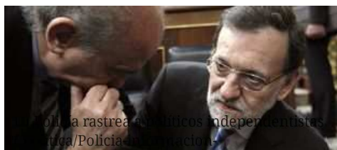
El rector de la US rastrea a políticos independentistas... (/politica/politica-intervencion-com-prometedora-independentistas_0_329317263.html)

Investigación (http://www.eldiario.es/temas/investigacion)