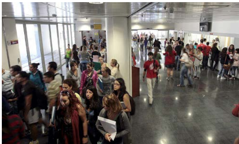
Inicio del curso académico 2012/2013 en las facultades de Viapol.

Tras las quejas de los profesores, la Universidad de Sevilla ha descafeinado su propuesta inicial de evaluación anual de la docencia mediante encuestas cumplimentadas por los estudiantes . Finalmente, el Secretariado de Formación y Evaluación ha diseñado una doble vía: los profesores que quieran podrán "autogestionar" el reparto y recogida de los cuestionarios rellenados por sus estudiantes (como así se hace en la Universidad del País Vasco) o, si así lo prefieren, decantarse por que sus alumnos rellenen las encuestas on line . La Universidad de Sevilla rescata así esta posibilidad, ensayada hace años y que, en su momento, no tuvo muy buena acogida entre la comunidad universitaria.