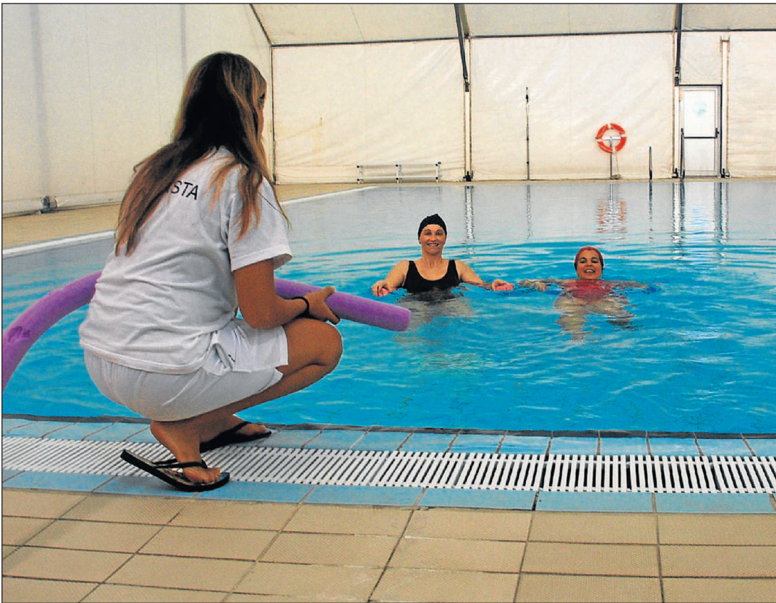
El edificio de las piscinas, abierto para los abonados que quieran practicar natación en distintas modalidades.