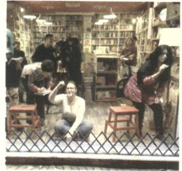
Pintando en un escaparate.

Otro de los platos fuertes fue el Curso de Orientación Profesional al Cómic impartido por el primer Premio Nacional del Cómic, Max. Pese a bajarse el telón de esta edición, hasta el 11 de enero todavía podrán visitarse las exposiciones de Bartolomé Seguí y 7 Vidas, ambas en la Casa de la Provincia. ■