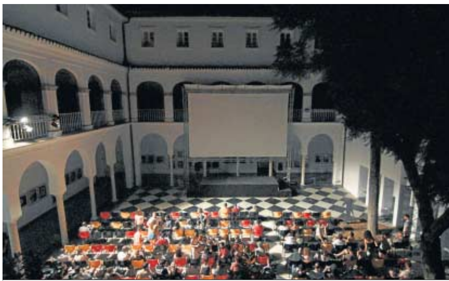
La multitud ocupar los asientos a la espera del comienzo de la película.

Cada semana a las diez y media de la noche, de lunes a jueves, las luces del Cicus se apagan para dar comienzo a una de estas películas clásicas. Para que sean apreciadas en su totalidad, se ha dispuesto un tradicional proyector cinematográfico que exhibirá la calidad de las películas grabadas en 35 mm, un tipo de celuloide.