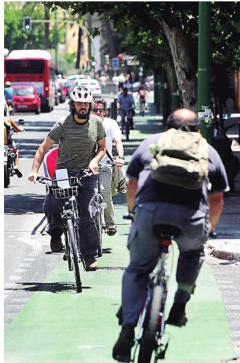
El carril bici en la Resolana.

El siguiente objetivo es igualmente claro: comunicar la ciudad con toda su área metro-