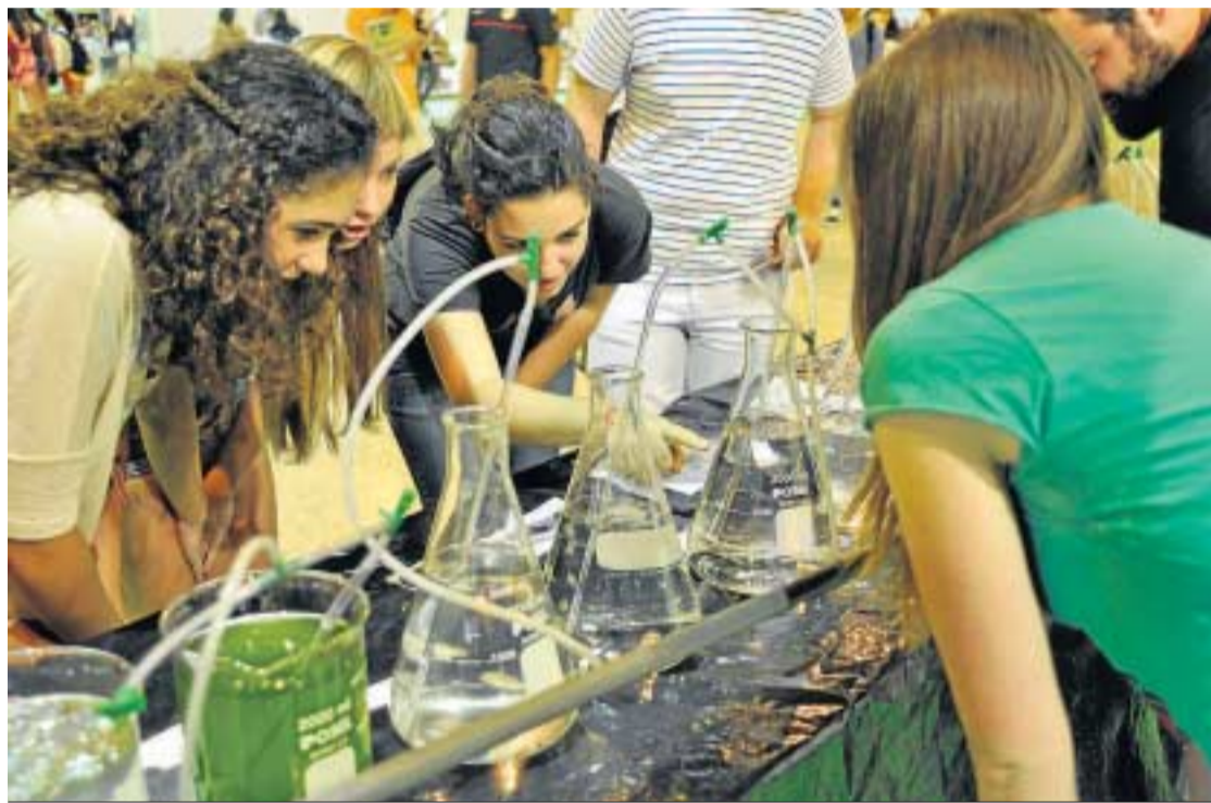
Unas jóvenes observan lo que ocurre en unos vasos de precipitado.

● Un estudio de la compañía AstraZeneca asegura que los andaluces no tienen un buen nivel de comprensión científica