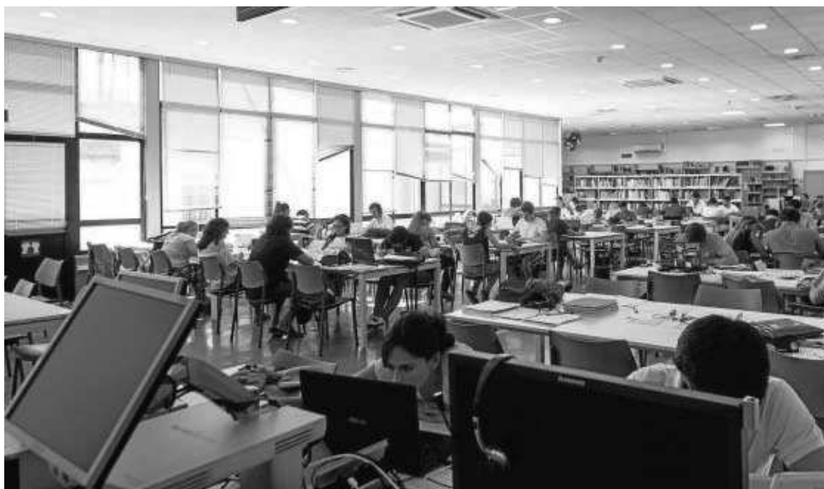
Estudiantes en una de las salas habilitadas por la tarde en el Rectorado, la antigua Fábrica de Tabacos.