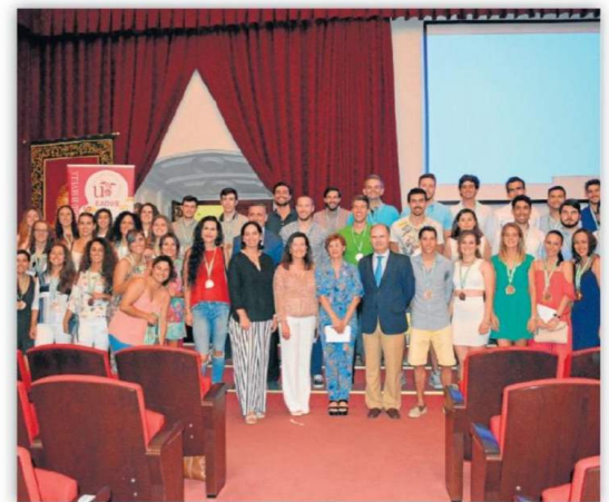
Se han convocado 50 ayudas para el próximo curso universitario. ED