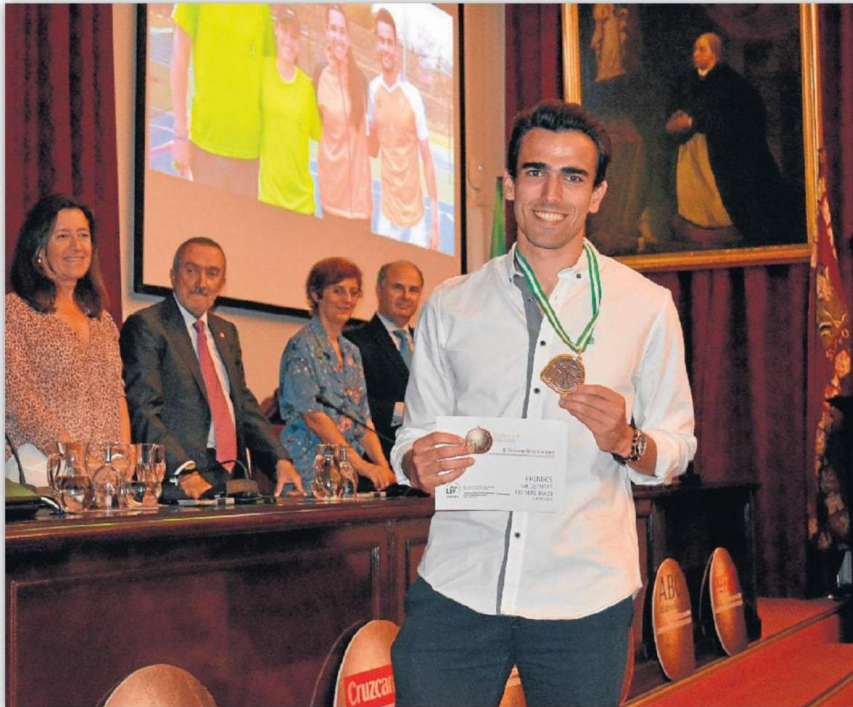
"Ha sido una experiencia bastante grata e inolvidable por el logro", señaló el atleta de la Hispalense. ED