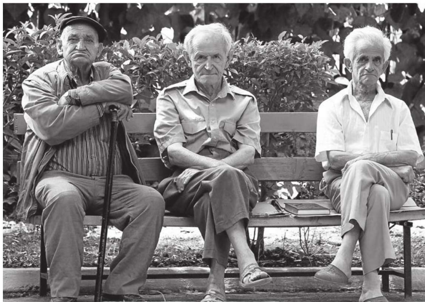
Tres personas permanecen sentadas en un banco próximo a un asilo