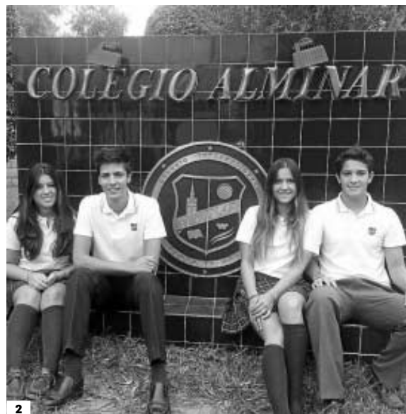
1. El empleo y promoción de las nuevas tecnologías son un pilar fundamental del centro, reflejado en el proyecto de aulas digitales que el colegio ha acometido. 2. Alumnos del colegio en la entrada del mismo.

Con una comunidad educativa que ronda los 700 alumnos, este centro asume el lema Somos una familia, somos un equipo para desarrollar un proyecto educativo innovador que se sustenta en la excelencia como