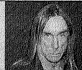
IGGY POP (88 años). Música