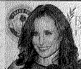
ANDIE MACDOWELL (57 años). Actriz