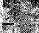
ISABEL II (89 años). Reina de Gran Bretaña e Irlanda del Norte