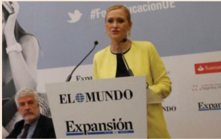
Intervención de la presidenta de la Comunidad de Madrid, Cristina Cifuentes, durante la clausura del Foro.

Según Cifuentes la mejora en la posición en este informe internacional se debe a una mayor inversión en educación. “Destinamos uno de cada cuatro euros de nuestro presupuesto a la educación y lo hacemos pensando que esta política beneficia a todos.