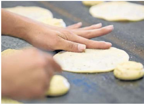
Elaboración de tortas de aceite de Inés Rosales.