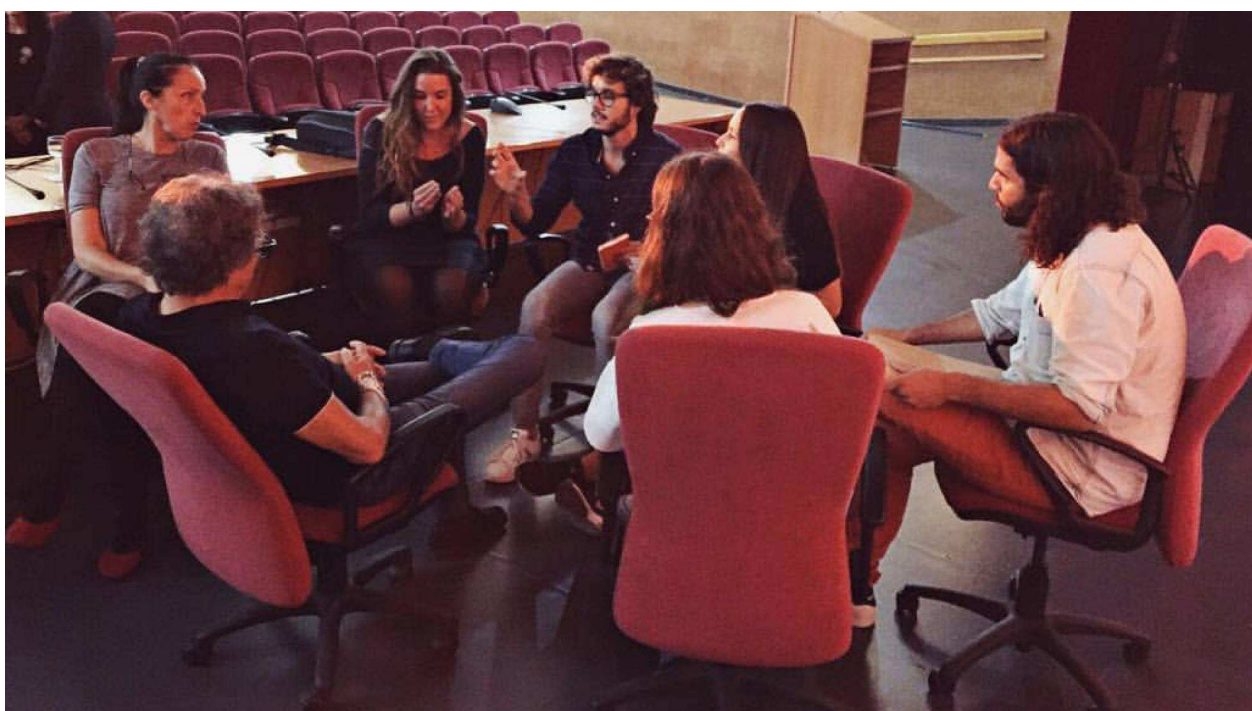
El equipo de Gendefénix, durante una reunión sobre la creación de logotipos.

Pasar del mundo teórico a la realidad, llevar los conocimientos de los libros a la práctica y dar los primeros pasos en el ámbito de la comunicación. Son algunos de los objetivos del programa De la clase a la cuenta , un curso y concurso con 22 ediciones que se resuelve este jueves en la Facultad de Ciencias de la Comunicación de Sevilla. La gala será retransmitida a Brasil, que participa en el proyecto a través de la Facultad de Arquitectura, Artes y Comunicación de la Universidad Estatal de São Paulo. El ganador podrá ver su campaña de promoción de la cultura emprendedora en medios de comunicación.