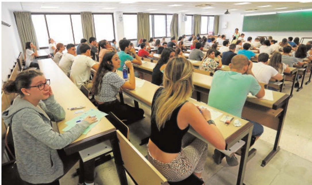
Alumnos sevillanos durante el examen de Selectividad del pasado año