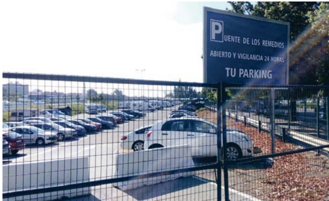
La concesión del parking en superficie junto a la glorieta de las Cigarreras termina el 31 de marzo PARTICIPA

El uso de la parcela por parte de Parking Sevilla Puerto no ha estado exento de polémica. A pesar de concederse la autorización en mayo de 2014 no fue hasta septiembre de 2014 cuando se solicitó la licencia urbanística para ejecutar las instalaciones y