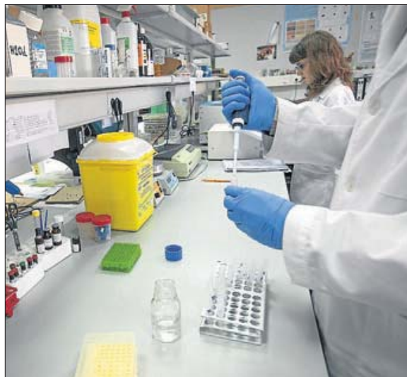
Laboratorio de la Universidad de Alicante.