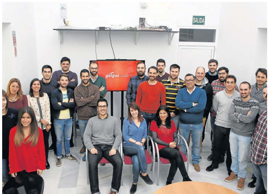
Parte del equipo de trabajo que forma Galgus.

Esta spin off de la Universidad de Sevilla exporta el 80 por