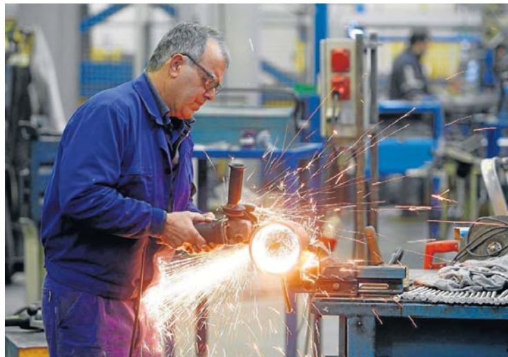
Trabajador de la compañía Hidral durante la fabricación de uno de los elevadores que diseña y fabrica esta firma sevillana.

ciento de su trabajo, que se basa en el diseño y la comercialización de jardines verticales. Empezaron por países vecinos como Reino Unido, Holanda y Bélgica, pero hoy además de conquistar otros puntos de Europa, también comercializan sus jardines verticales en Oriente Medio.