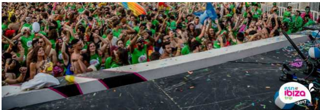
Una de las fiestas del ESN Ibiza Trip 2017 @ESNIBIZATRIP

Al año realiza tres encuentros internacionales para que se puedan conocer todos los estudiantes residentes en España. Dos de esos destinos varían cada año, pero el tercero siempre es Ibiza, ya una seña de identidad de ESN . Este viaje, de cinco días, cuenta con la colaboración de la oficina de turismo de la isla, guías turísticos y las principales discotecas, encargadas de organizar fiestas temáticas como la School Party o la Water Party.