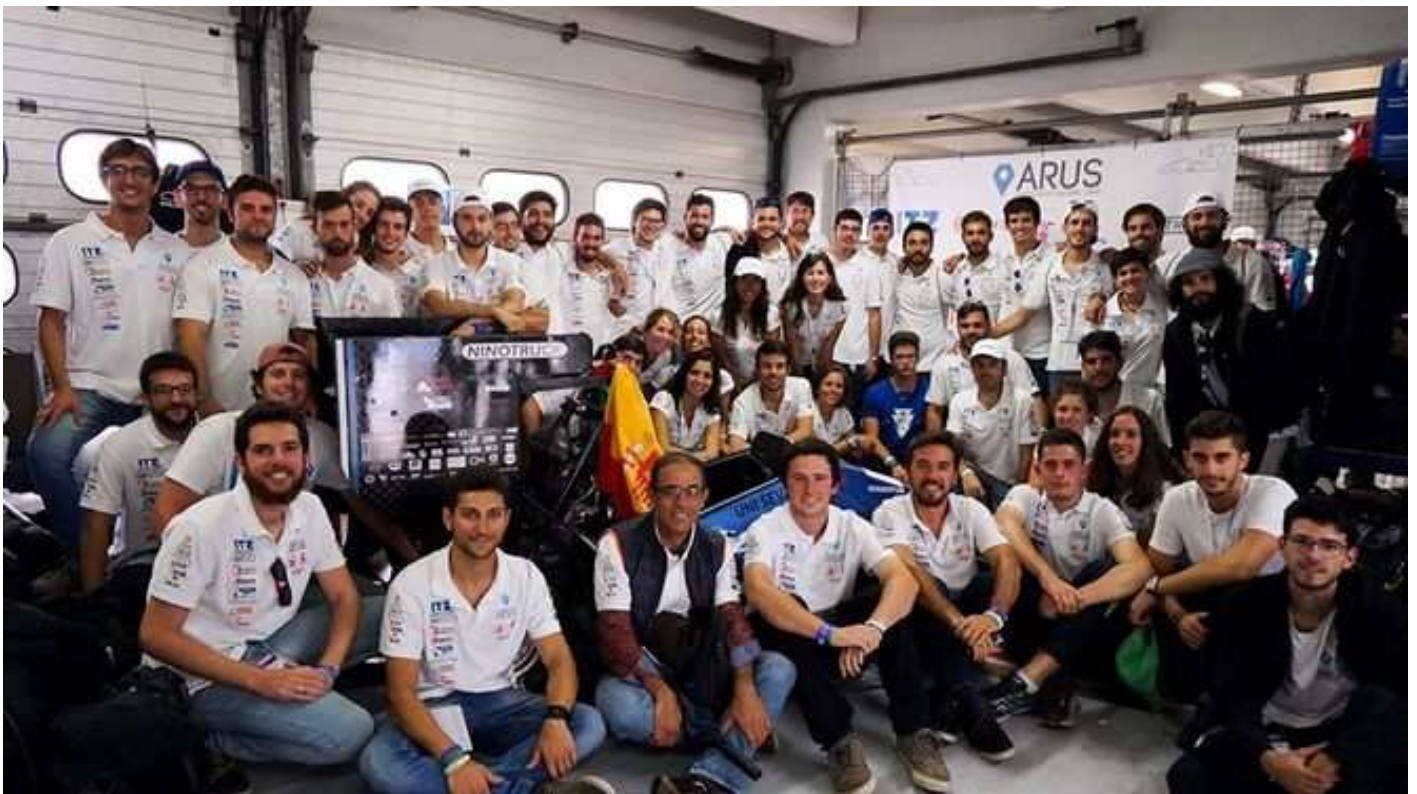
Los integrantes de ARUS.