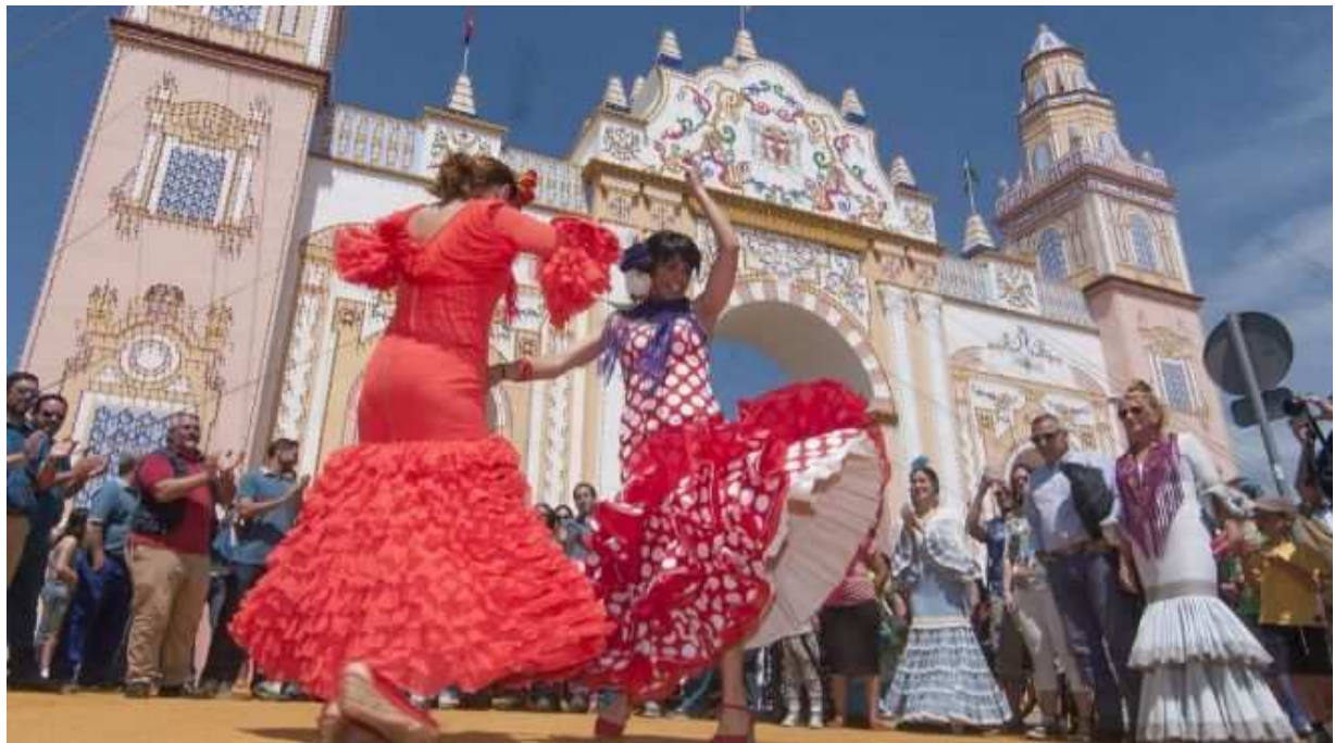
Feria de Abril de Sevilla

Además, tres de estas ciudades se convierten en un gran reclamo para los estudiantes erasmus por sus fiestas típicas. Entre ellas destacan Sevilla por la Feria de Abril , Valencia por las Fallas y Cádiz por su Carnaval .