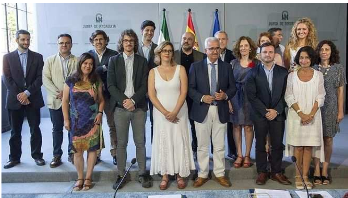
Los trabajos seleccionados beneficiarán a un centenar de investigadores de diferentes universidades y centros de investigación.