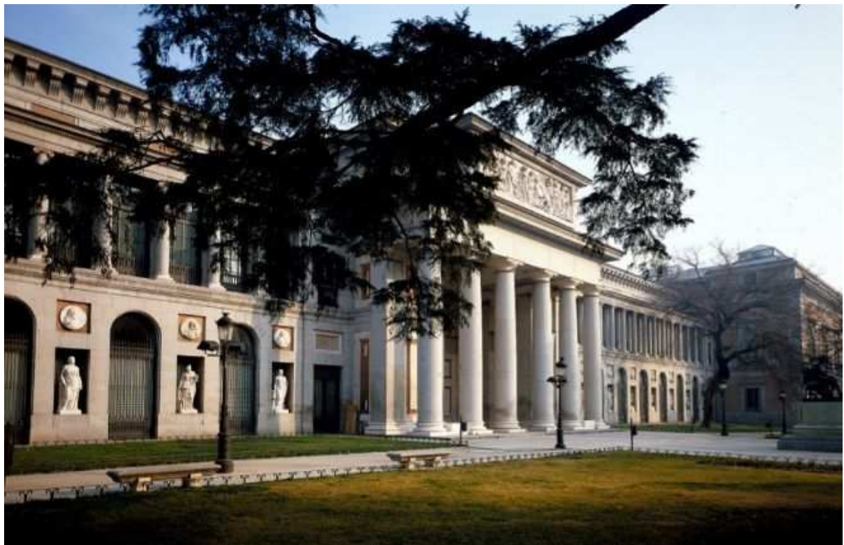
Fachada principal del Museo del Prado, en Madrid