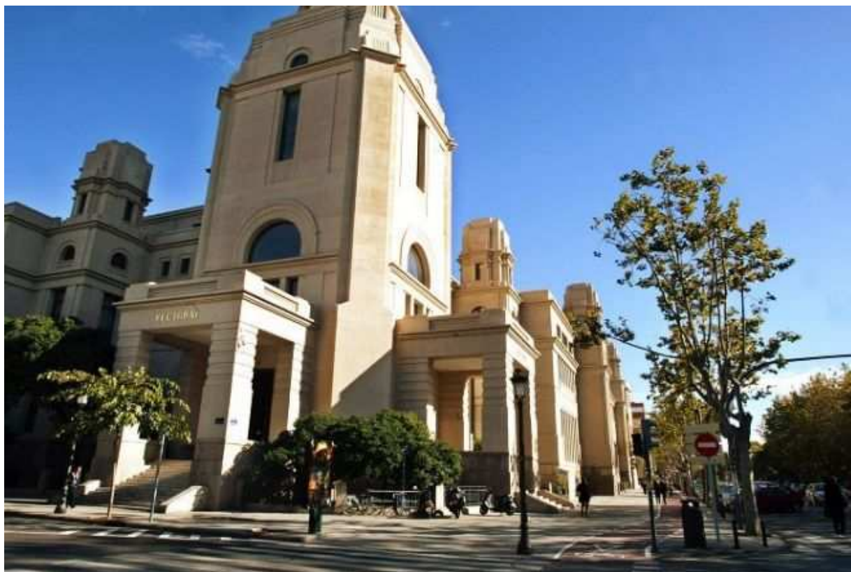
Vicerrectorado de la Universidad de Valencia @UV_EG

Por encima del top ten se encuentran otras seis universidades españolas, como la Universidad de Barcelona en el undécimo puesto, la Universidad de Sevilla (en el 13º) o la Politécnica de Cataluña (en el 16º). Finalmente, los puestos 17º, 18º y 19º los ocupan las universidades de Salamanca , Málaga y la Autónoma de Barcelona , respectivamente.