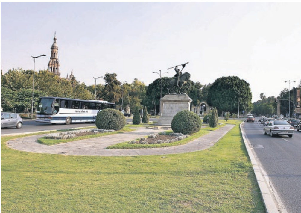
El Ayuntamiento prevé construir un aparcamiento subterráneo bajo el Cid