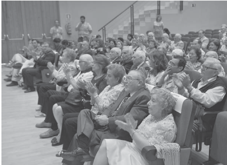
Imagen del día

No contento con el expolio que ha supuesto el abuso de las tarjetas 'black' en la entidad, el expresidente de Bankia quería cargarle a la aseguradora del banco el pago de los 16 millones de euros de la fianza judicial.