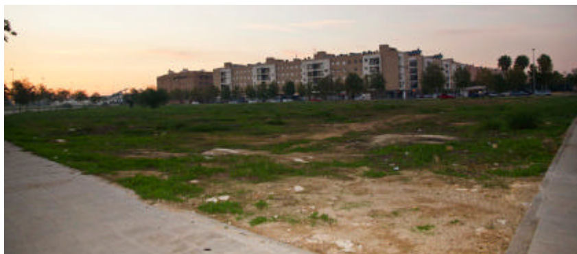
Parcela de la Escuela Politécnica en los Bermejales.