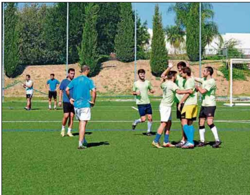
Los chicos de la Escuela Técnica Superior de Ingenieros fueron justos merecedores del título.