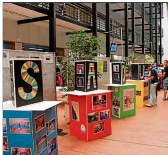
Las exposiciones itinerantes arrancan en Reina Mercedes.

Campaña de información y acercamiento a los alumnos