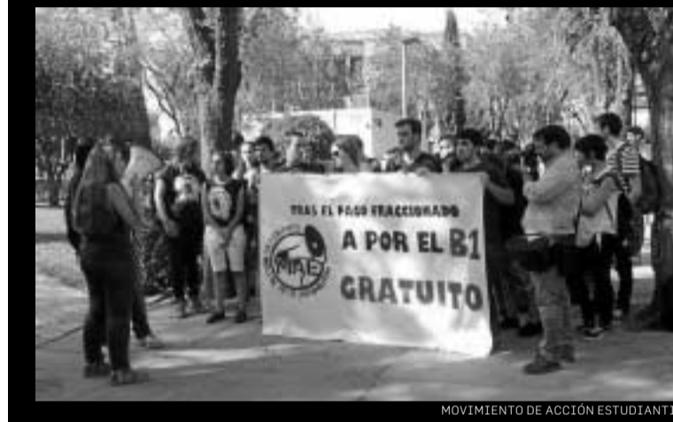
MOVIMIENTO DE ACCIÓN ESTUDIANTIL