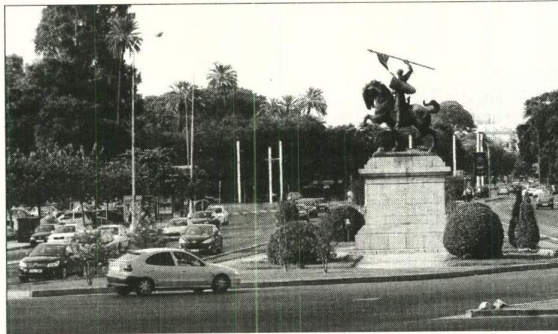
El aparcamiento subterráneo se instalará bajo la Glorieta del Cid.

tacionamiento no está previsto en el PGOU, por lo que, a su juicio, «se está alterando sustancialmente la ordenación definitiva respecto a la previsión de los aparcamientos».