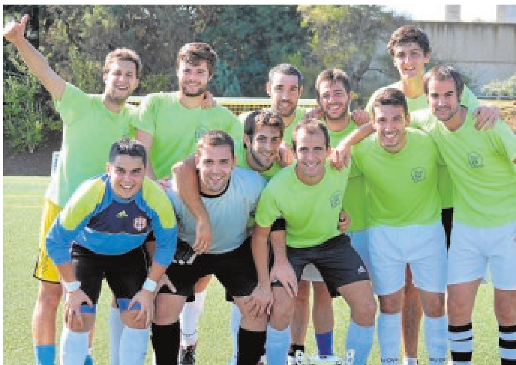
El equipo campeón