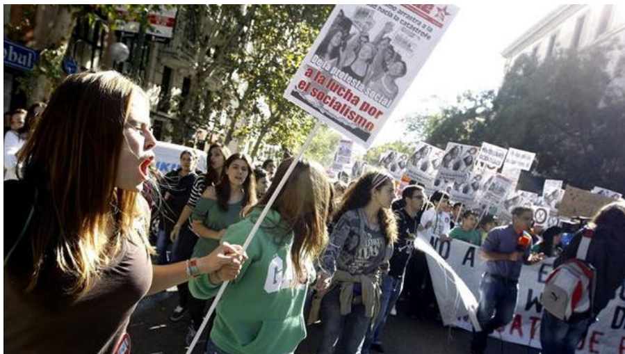
El Sindicato de Estudiantes ha convocado una huelga de tres días