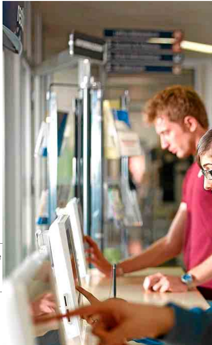
Existen multitud de plataformas para dar respuesta al alumno.

En Udima los jóvenes utilizan las plataformas Hangout de Google, Blackboard Collaborate y Second Life como elementos interactivos, y la UNED trabaja con laboratorios remotos para si-