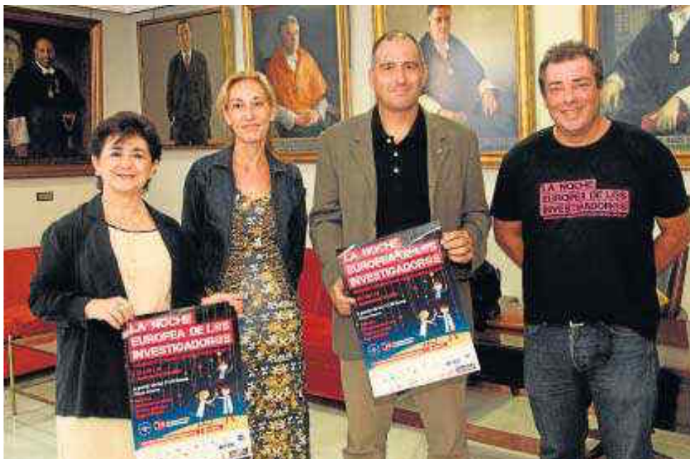
Acto de presentación ayer en el Rectorado de la Universidad de Sevilla.