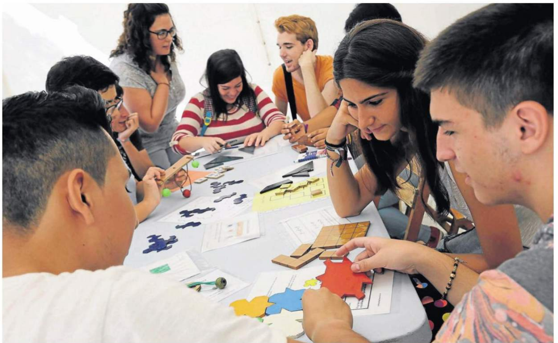
Un grupo de jóvenes participa en una de las actividades celebradas en la pasada edición.

Los visitantes podrán participar en múltiples actividades y conocer al detalle, gracias a un lenguaje divulgativo y mediante espectáculos diseñados para buscar la diversión, los resultados y las aplicaciones en su vida diaria de las últimas investigaciones científicas. De este modo, aprenderán cómo extraer su propio ADN, a protegerse del sol en un futuro, a fabricar su propio coche de Fórmula 1 o podrán viajar al interior de un chip microelectrónico.