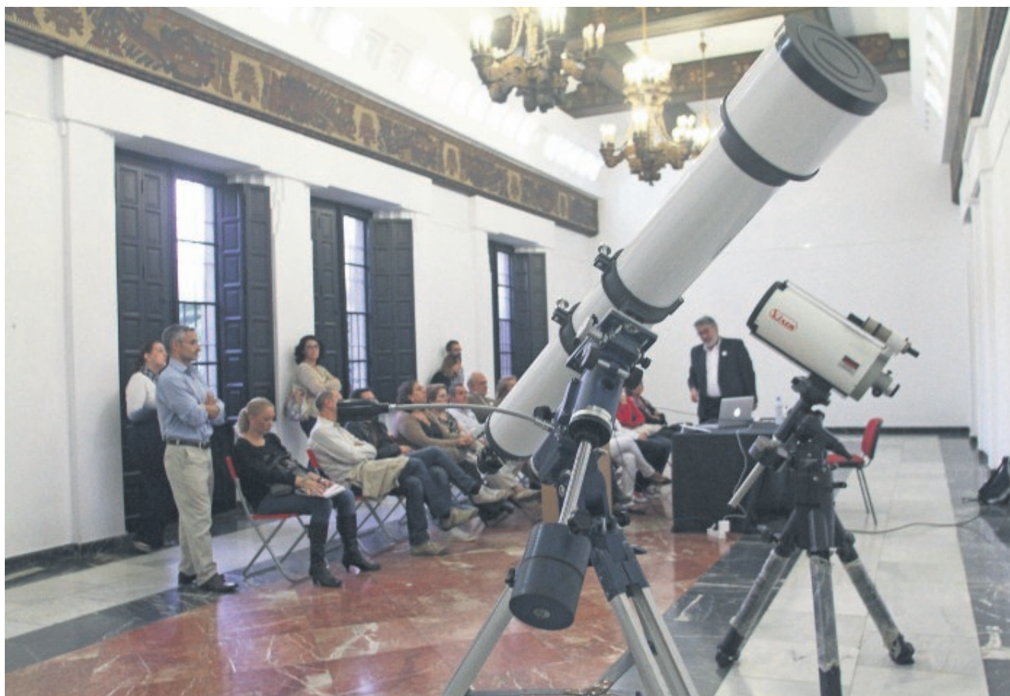
El objetivo de esta jornada es acercar la ciencia al público de forma didáctica