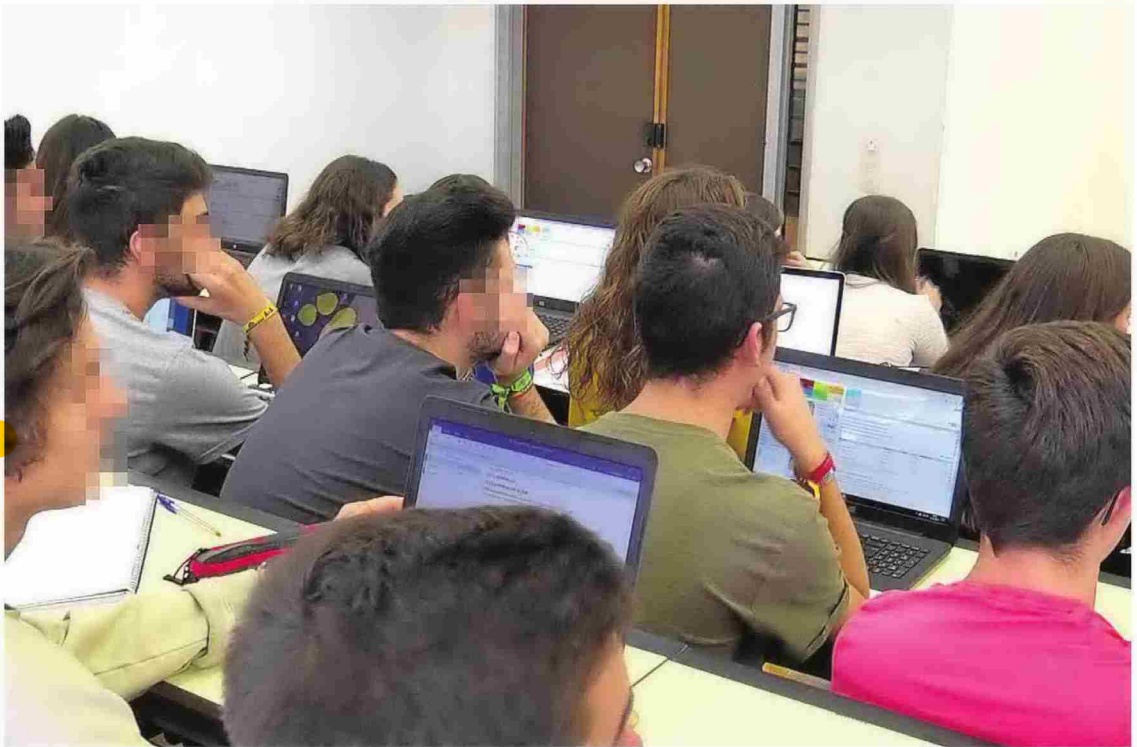
Un grupo de alumnos atiende las indicaciones de su profesor durante el desarrollo de una clase.

Para muestra, un botón. La mitad de los jóvenes cree que cuando comience a trabajar