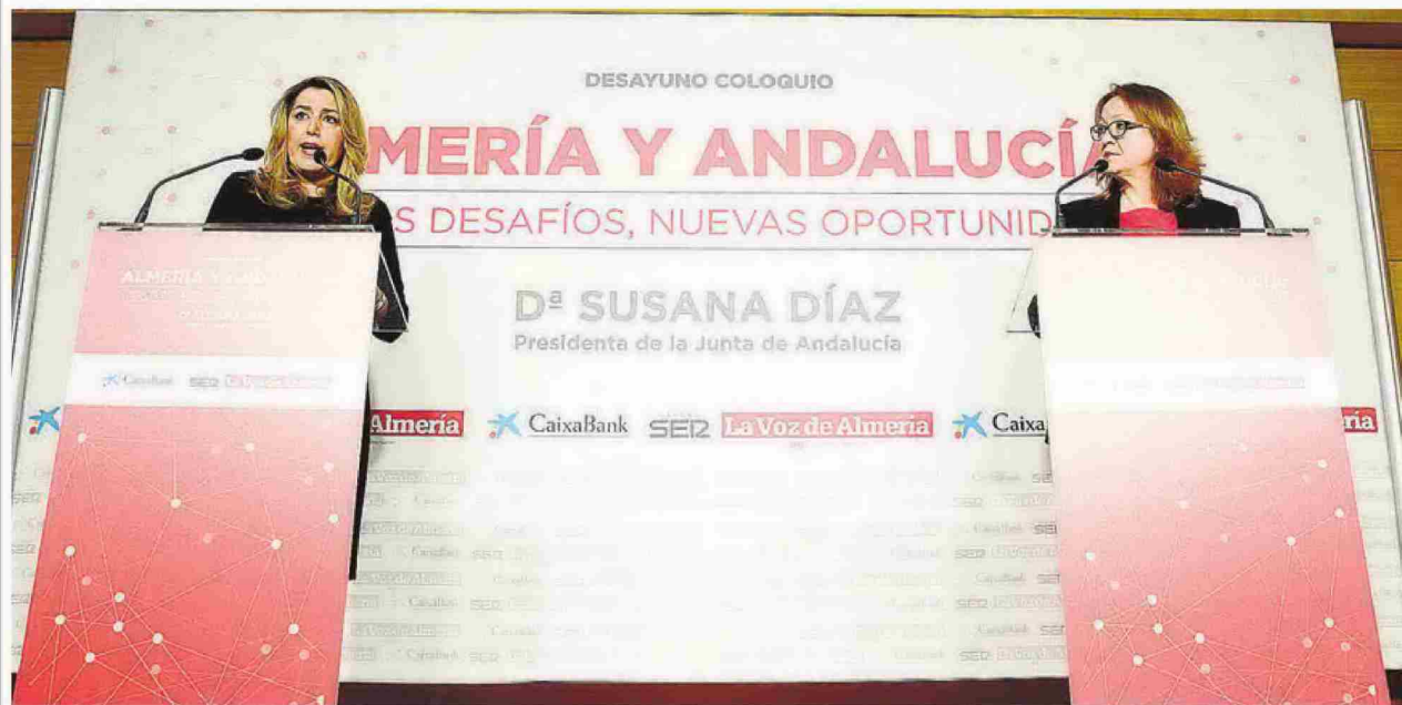
COLOQUIO entre la presidenta de la Junta y los asistentes al acto a través de sus preguntas. JUAN SÁNCHEZ

Preguntas Los asistentes mostraron su preocupación sobre el futuro de Almería y Andalucía