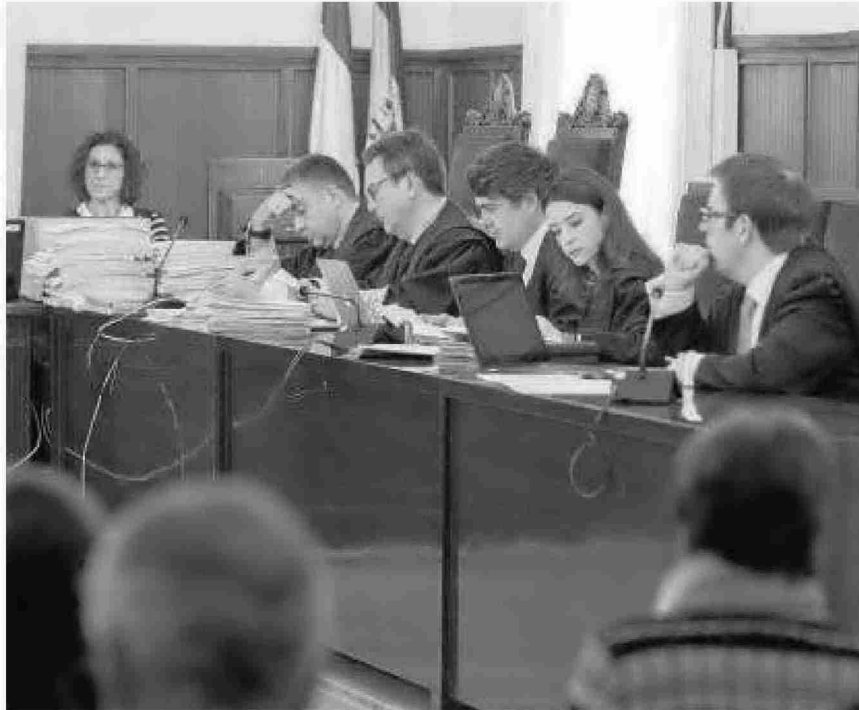
Los fiscales Anticorrupción, junto a los letrados de las acusaciones del PP y Manos Limpias en el juicio de los ERE.

Así, el tribunal comienza la fundamentación jurídica de la resolución diciendo que "no parece ocioso" comenzar recordando cinco puntos. En el primero de ellos, la Sala argumenta que "una de las reglas fundamentales del proceso penal es que su objeto viene constituido por hechos, y no por voluntades, intenciones o deseos", añadiendo que, "en relación con los variados procedimientos tramitados en relación" con el caso de los ERE "por separación de la causa matriz o principal (las denominadas piezas separadas), claro debe quedar que no se puede confundir la idea que para esa formación de piezas separadas pudo presidir el diseño tenido en mente por la Fiscalía Anticorrupción, hoy apelante, con el contenido de hechos que finalmente se ha terminado dando a la pieza principal del denominado procedimiento específico, actualmente pendiente de enjuiciamiento en la Sección Primera" de la Audiencia Provincial".