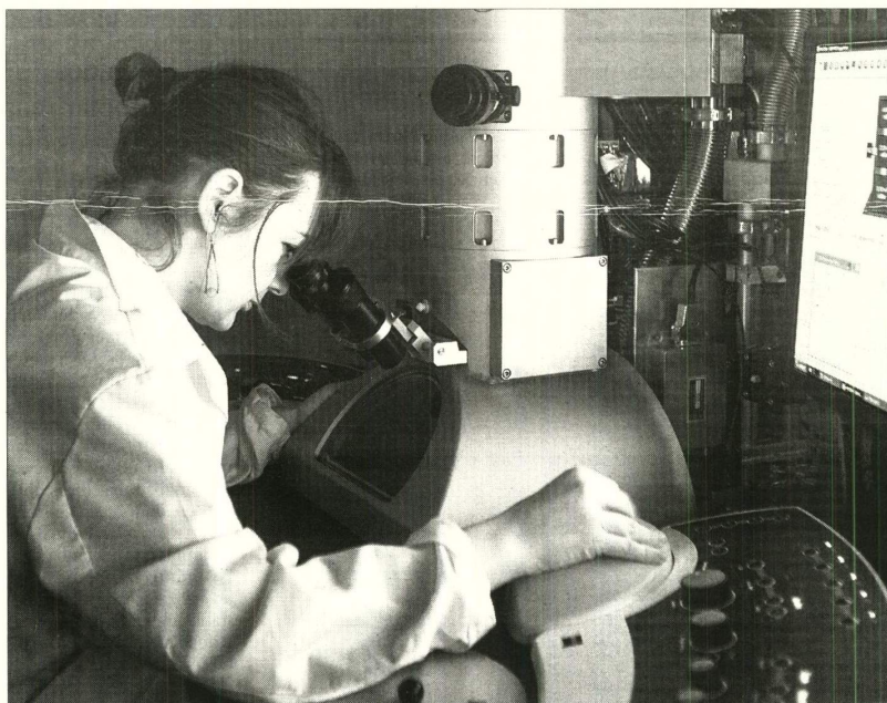
Dos terceras partes de la plantilla del CITIUS son licenciados; la mitad, doctores.