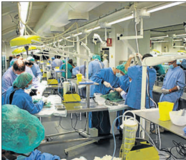
Alumnos de Medicina de la UB, en la sala de disecciones

El siguiente paso es decidir el destino de ese cuerpo: si es para docencia o para investigación. O para ambas, ya que normalmente los cuerpos suelen ser desmembrados. Dependiendo de las causas de la muerte, por ejemplo, una persona con cáncer es destinada a investigación, igual que el cerebro de una persona con Al-