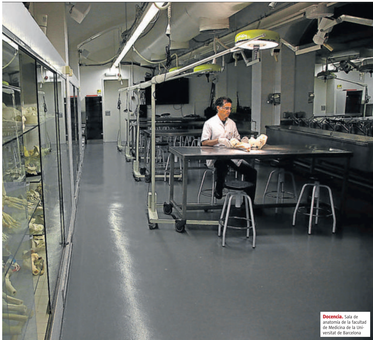
Docencia. Sala de anatomía de la facultad de Medicina de la Universidad de Barcelona

La mayor parte de los donantes son hombres mayores de 60 años