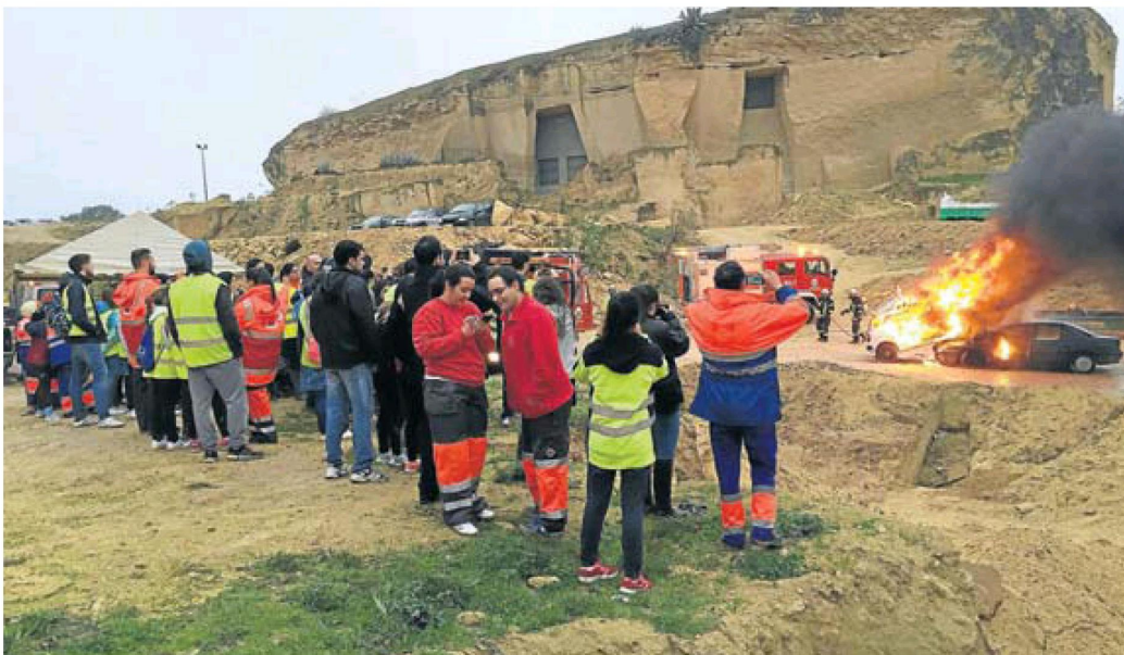
Un simulacro de un accidente aeronáutico fue una de las actividades más llamativas de la Escuela Universitaria de Osuna.

También participaron en un simulacro de terremoto en Sevilla dentro del Plan Especial de Emergencias ante el Riesgo Sísmico de Andalucía. En esta última actividad se ha implicado la Junta de Andalucía, el Ministerio del Interior, la Delegación del Gobierno y la Unidad Militar de Emergencias, aportando un total