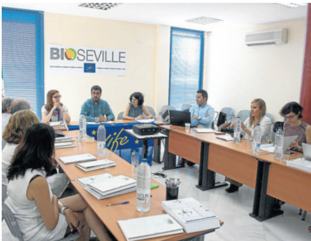
Reunión del proyecto, de financiación europea, Life Bioseville , celebrado ayer en Gerena.

Para la creación de este nuevo biocombustible se ha constituido un consorcio, formado para el proyecto Life Bioseville y compuesto por el Centro Tecnológico Avanzado de Energías Reno-