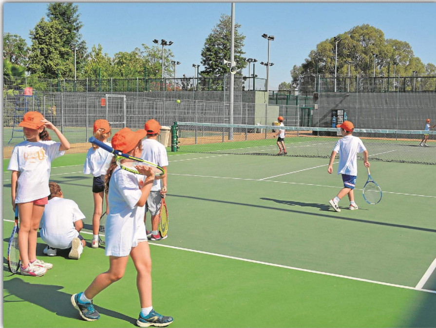
Los interesados todavía están a tiempo de formalizar su inscripción en los Campus Deportivos de Verano. ED