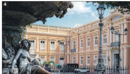
1. Universidad Nacional de México. 2. Universidad de Mumbai, en India. 3. Universidad Tsinghua, en Pekín (China). 4. Facultad de Medicina de la Universidad de Salvador de Bahía (Brasil).