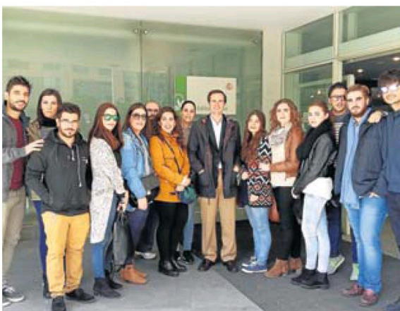
Visita de alumnos al Juzgado de lo Social de Sevilla.

de 4.000 efectivos y 14 equipos de emergencias médicas, 14 ambulancias de soporte vital avanzado, 10 ambulancias de soporte vital básico, tres vehículos de apoyo logístico, tres puestos sanitarios avanzados, un helicóptero sanitario, dos unidades de descontaminación NBQ y tres vehículos de mando.