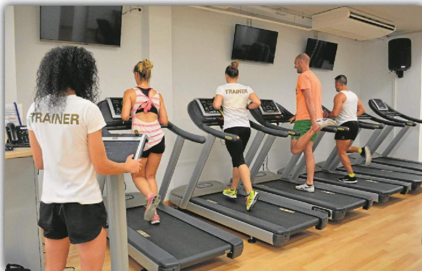
El SADUS apuesta por su servicio de entrenamiento personalizado. ED

mente sus sesiones futuras como un auténtico profesional. El SADUS propone su servicio de entrenamientos personales para ayudar a sus deportistas a alcanzar rápidamente los objetivos que se hayan marcado. Por ello, este servicio se puede disfrutar tanto en Los Bermejales como en el C.D.U. Ramón y Cajal, contando con diferentes programas: individuales, presenciales o semipresenciales. Podrán apuntarse aquellos usuarios que posean un pase de temporada en vigor o sean abonados al Servicio, debiendo contratar sus sesiones de entrenamiento en la franja horaria en la que esté abonado.