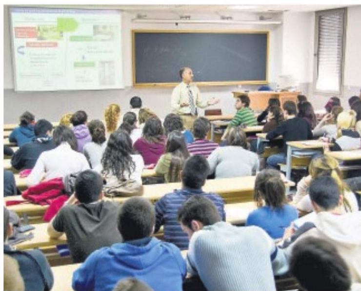
Un aula de alumnos universitarios

Una semana antes, por su parte, dieron inicio las clases en la Universidad