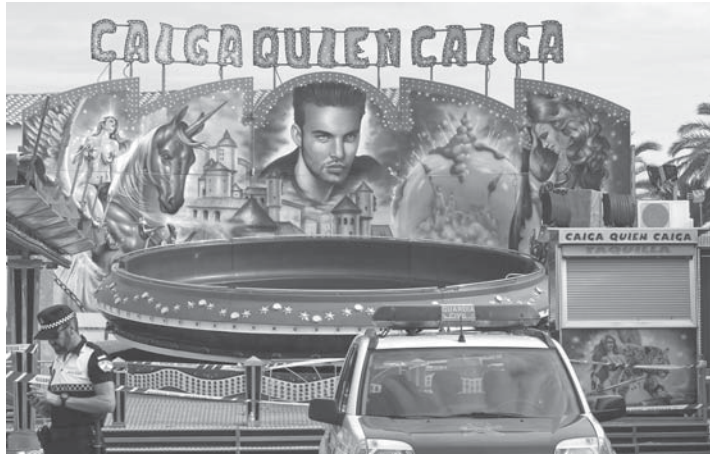
Atracción de la feria de Maribáñez en la que murió electrocutada una menor el pasado viernes.

SUCESOS No hay imputados por la muerte de la menor en Maribáñez