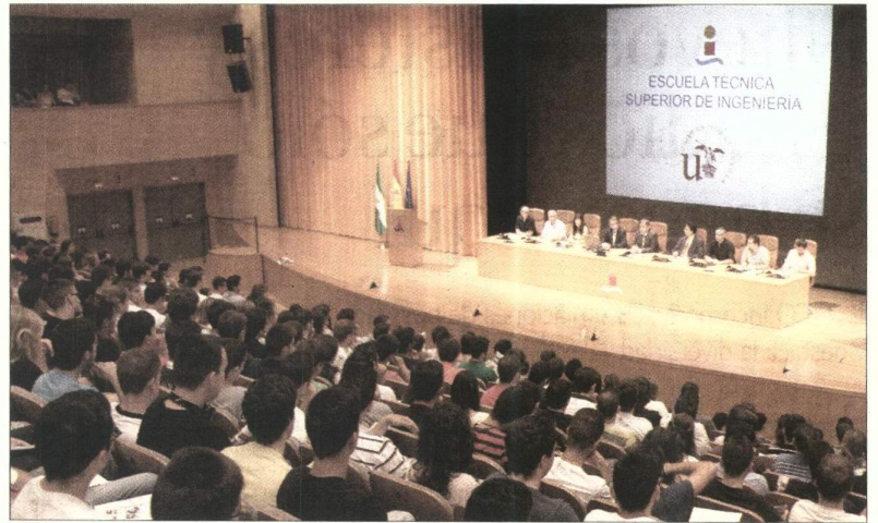
Salón de actos de la Escuela Técnica Superior de Ingeniería de la Universidad de Sevilla.

En sus 50 años de vida, la ETSI de la Universidad de Sevilla se ha convertido en uno de los centros de referencia nacional e internacional en la enseñanza de estudios de Ingeniería al máximo nivel, incluyendo los estudios de doctorado. Prueba de ello es su presencia en dos Redes Europeas de Excelencia: la Red Pegasus, que acoge a las mejores escue-