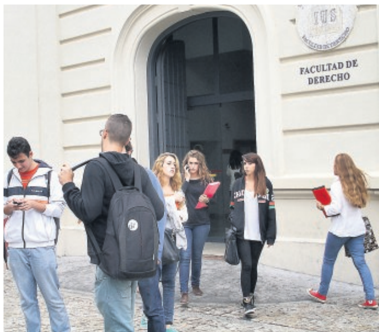
Derecho sigue siendo una de las carreras preferidas