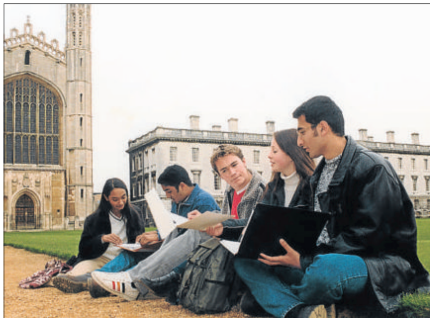
La experiencia internacional es cada vez más apreciada por los empresarios; en la foto, Cambridge

Los universitarios que realizan estancias en el extranjero son también más emprendedores que la media y puntúan mejor que en los llamados 'factores memo' para medir la empleabilidad: tolerancia hacia las opiniones divergentes, curiosidad, capacidad de decisión, confianza, capacidad para resolver problemas y