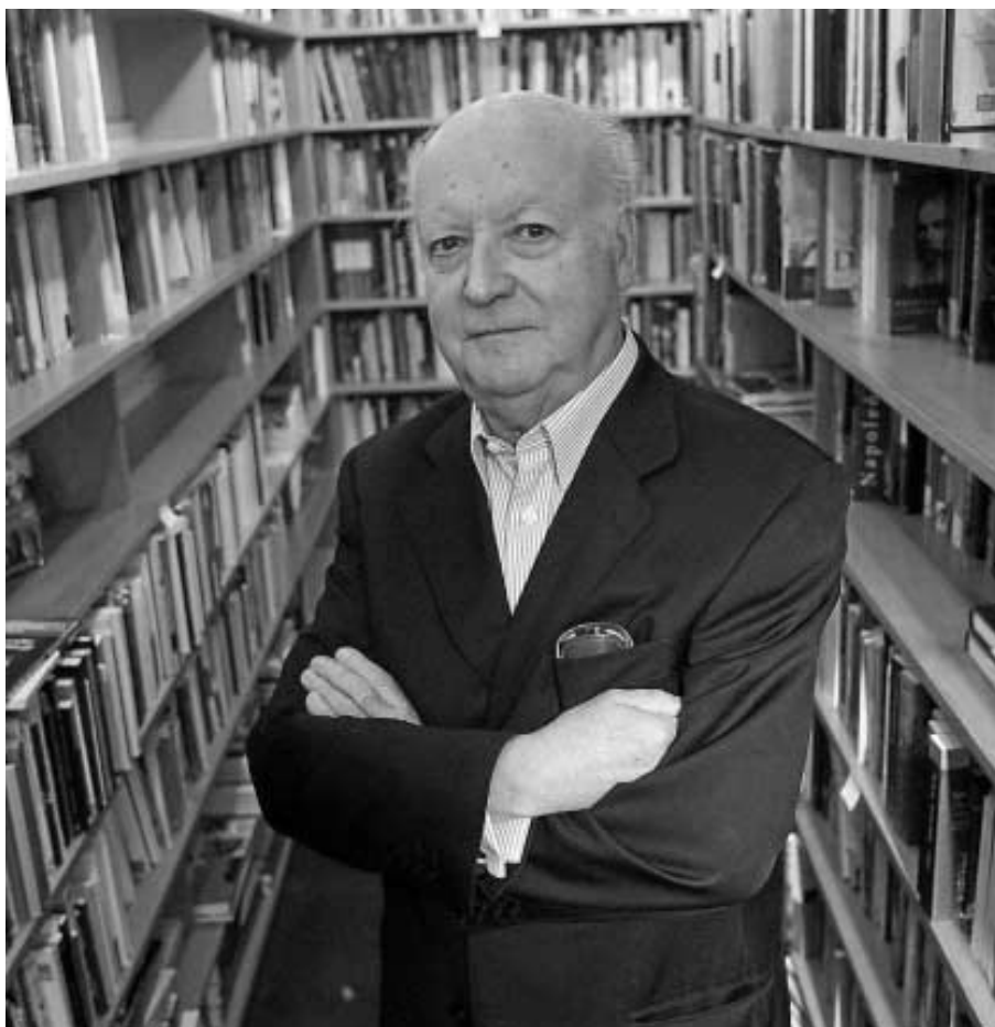
El escritor chileno Jorge Edwards, en una imagen de archivo.