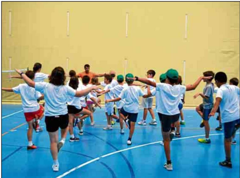
Los más pequeños siguen teniendo cabida en el programa del Servicio de Actividades Deportivas.

ACTIVIDADES CUBREN TODAS LAS PARCELAS DEPORTIVAS