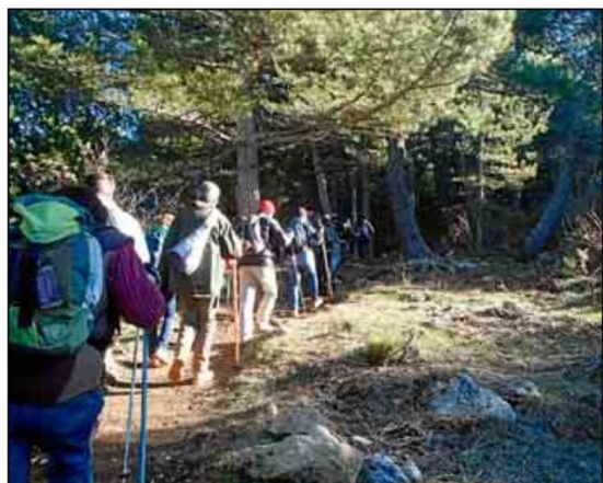
Las actividades al aire libre siempre triunfan entre los usuarios.

de seis kilómetros y 1.129 metros de altura, los interesados viajarán a Pruna, situada en Sevilla, siendo el pico Terril el más alto de la provincia. La ruta cuenta con una fuerte ascensión por un frondoso barranco hasta un pequeño collado donde se encontrarán con un antiguo pluviómetro. La subida finaliza en un vértice geodésico donde se podrá divisar la Sierra de las Nieves, de Grazalema, y el Peñón de Algámitas, segundo pico en altitud de la provincia con 1.121 metros.