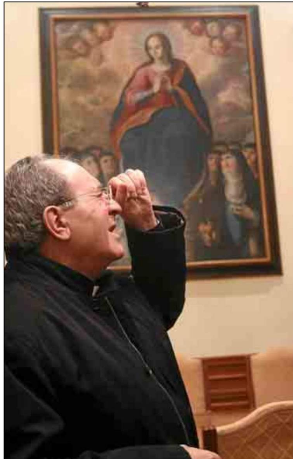
El arzobispo contempla el rostro de la 'Inmaculada' de Murillo. ESTHER LOBATO

El denominado Salón de los Cuadros tiene la apariencia de un gran salón de baile de época romántica. La apreciación no es arbitraria. Esta estancia alargada albergó las fiestas y recepciones del Mariscal Soult durante la ocupación francesa. Hasta hace poco tiempo, el salón presentaba deficiencias de mantenimiento. La principal, la red eléctrica, de hace décadas. Un acuerdo entre la Fundación Sevillana Endesa y el Arzobispado, con un desembolso próximo a los 250.000 euros, ha permiti-