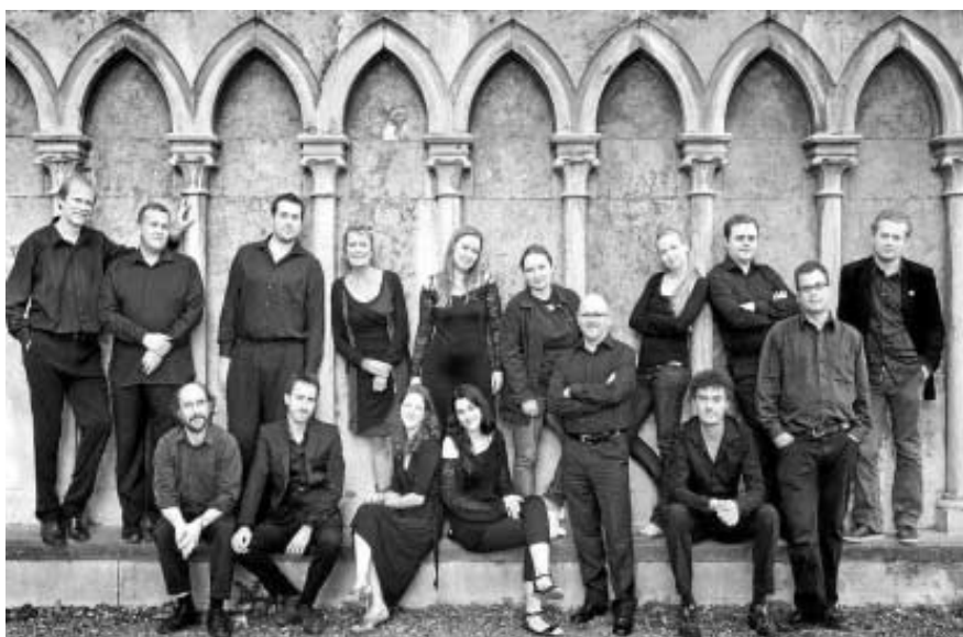
Imagen de Collegium Vocale Gent, una de las grandes formaciones europeas de música antigua.