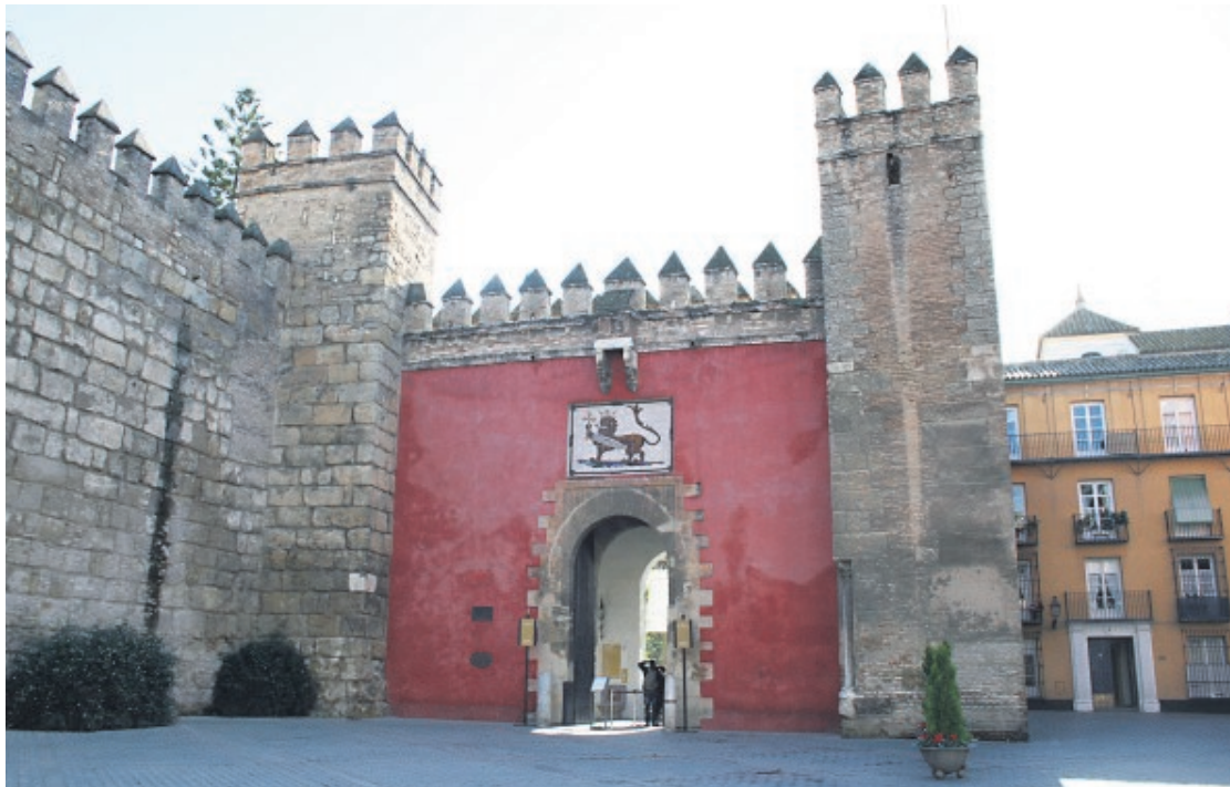
El Real Alcázar, junto con la Catedral, acapara el 70 por ciento del turismo que viene a Sevilla