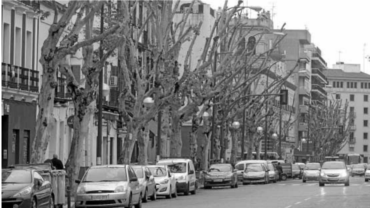
Los árboles de la calle Marqués de Paradas han sido podados esta pasada semana.