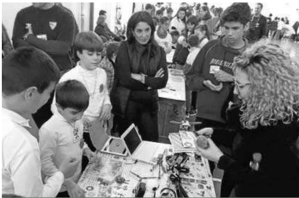
Los más pequeños ya han podido comprobar cómo funcionan los aparatos que diariamente utilizan en sus casas. M. G.

● 'El Mundo de los Chips: Ciencia e Ingenio a la Nanoescala' explica los principios básicos de la nanotecnología a todo tipo de público