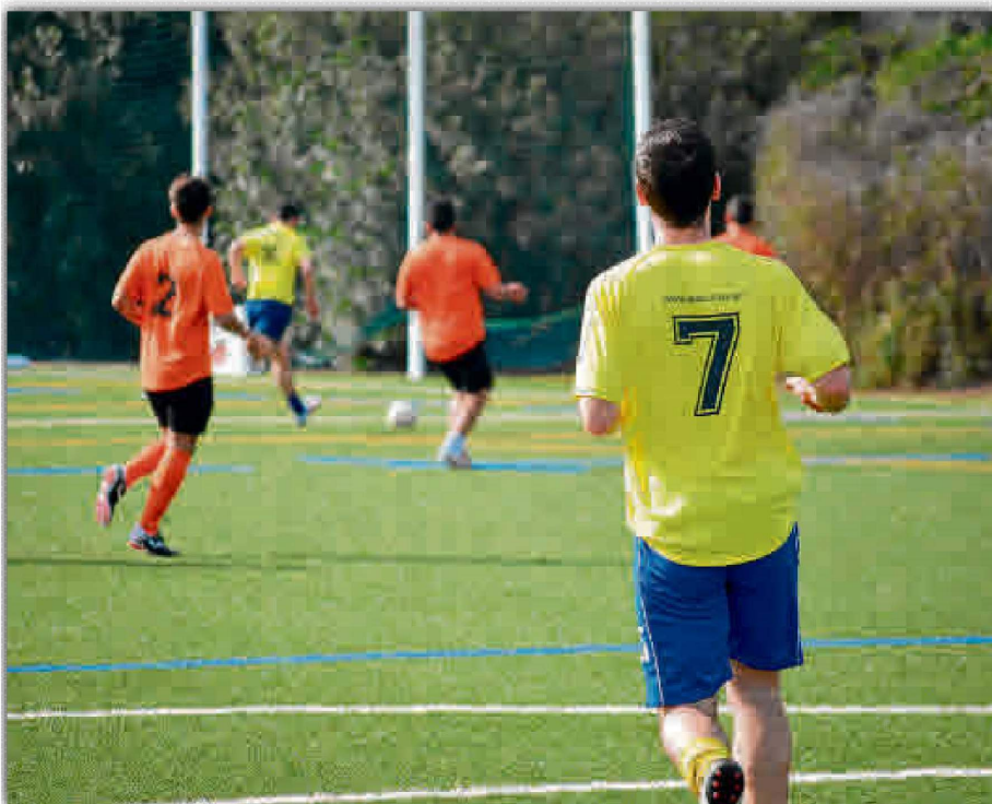
El fútbol 7 es una de las modalidades con mayor aceptación entre la población universitaria.

Hasta este jueves podrán inscribirse los equipos para el nuevo torneo, que será de carácter mixto