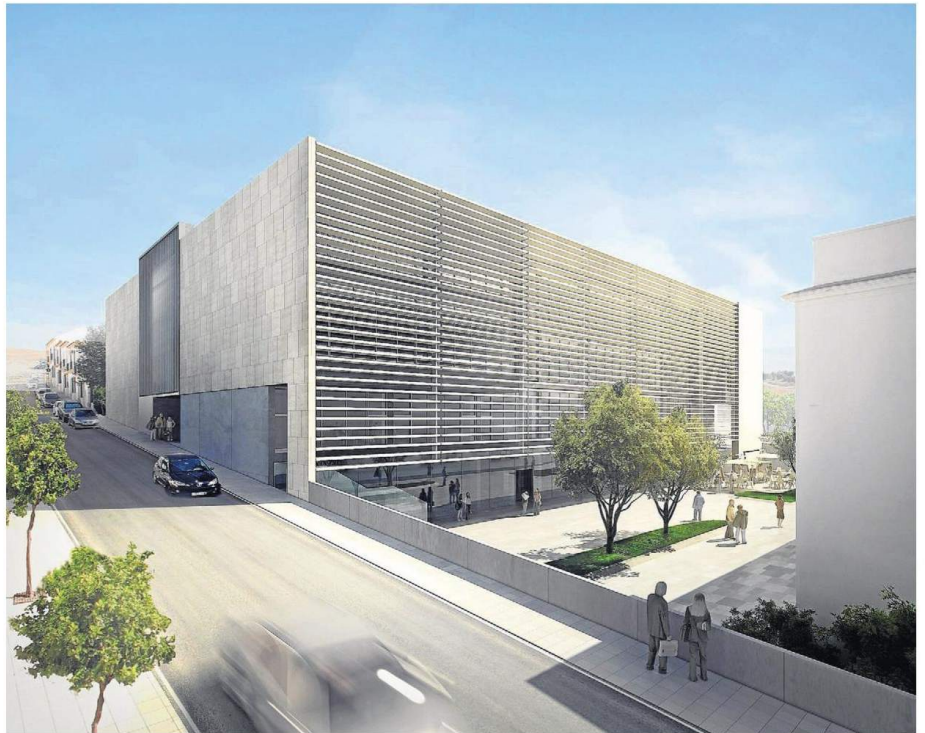
Recreación de la futura ampliación de la Escuela Universitaria de Osuna.

En concreto, el Crear se ubicará en una superficie de 6.800 metros cuadrados, que se distribuirán en tres plantas y estará ubicado en la avenida de la Constitución, junto a la residencia universitaria. Dispondrá de 16 aulas, un aula de informática, 22 despachos, 14 seminarios y todos los espacios auxiliares, como una biblioteca, laborato-