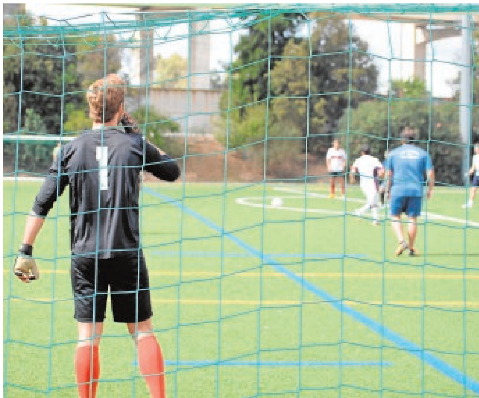
El torneo de fútbol 7 suele tener mucha aceptación

Una vez inscritos los diferentes equipos se procederá al sorteo de grupos y a establecer el calendario de competición dependiendo de la franja horaria que haya elegido cada capitán o delegado, incluso pudiendo jugarse los sábados si ambos equipos están de acuerdo. El torneo contará con una fase de grupos previa, en la que se for-