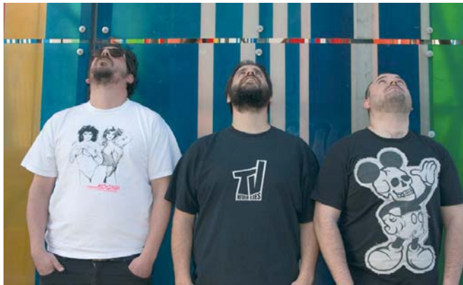
Niño de Elche y Los Voluble presentan hoy su propuesta musical 'Raverial' en el Teatro Central.