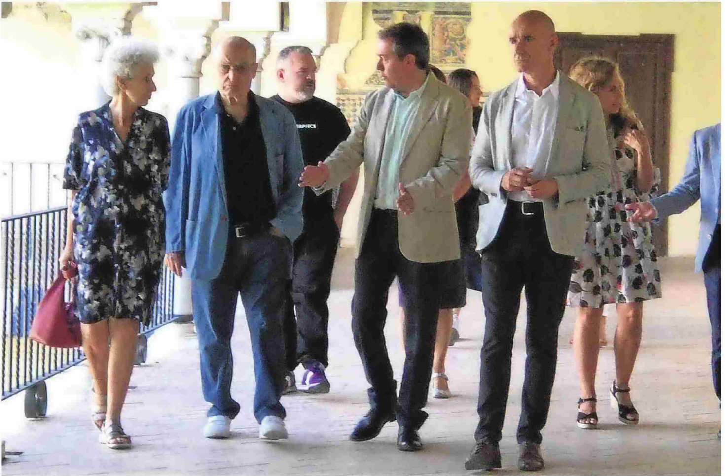
La negociación del Ayuntamiento con el artista y su mujer comenzó en Semana Santa. La primera exposición se hará en primavera con obra gráfica que recorrerá la trayectoria