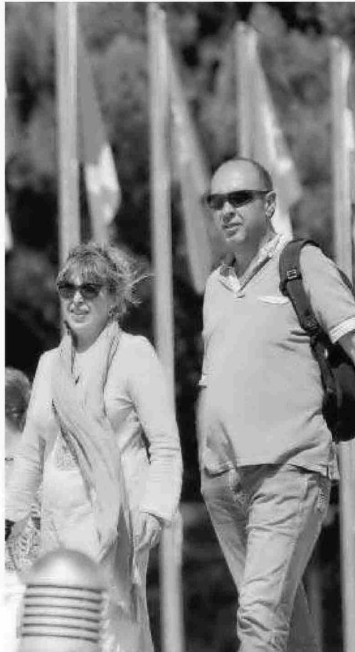
Alumnos de los cursos de verano en la sede de La Rábida.

experto añadió que "son los que más van a sufrir, ya que toda la concentración humana verá las consecuencias de algo de lo que pueden tener más o menos cul-