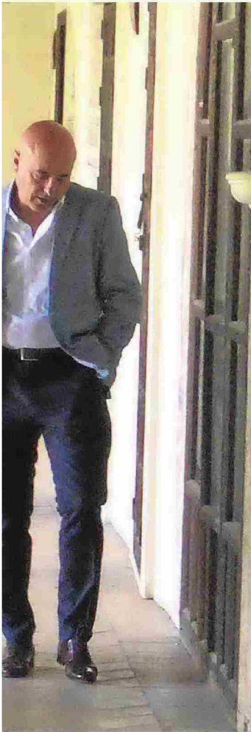
de Gordillo.