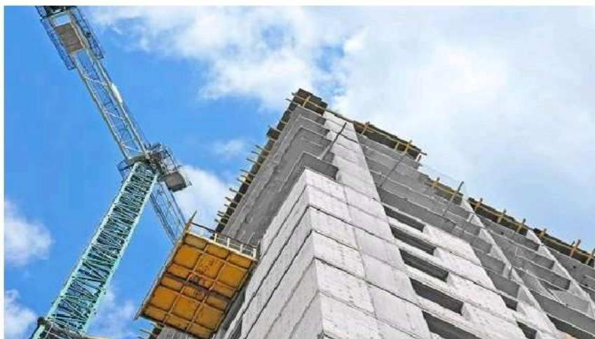
Fase de edificación. SEVILLA

Precisamente, lo novedoso de esta iniciativa es que por primera vez se ha desarrollado una herramienta informática de acceso abierto a través de la cual se pueden calcular las emisiones de CO2 en cada fase de la edificación, con el fin de obtener una visión general de la huella de carbono desde su concepción y decidir sobre cada variable del proceso constructivo, según se informa en un comunicado de la US.