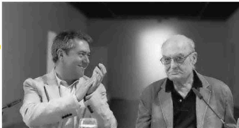
El alcalde felicita al pintor sevillano y Premio Velázquez en la sala que acogerá su obra.

Por tanto, lo "histórico" del acuerdo alcanzado no es tanto el volumen o valor económico de la donación realizada o de los préstamos en régimen de comodato que