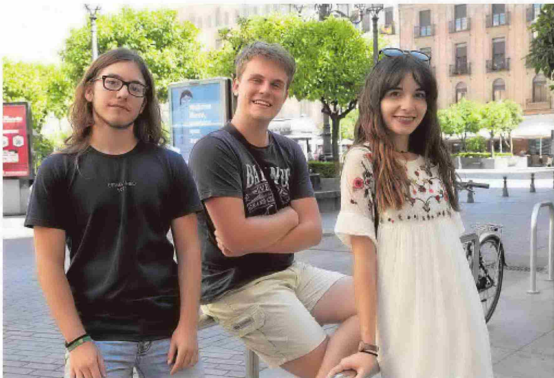
Tres de los estudiantes premiados posan en la plaza de las Tendillas