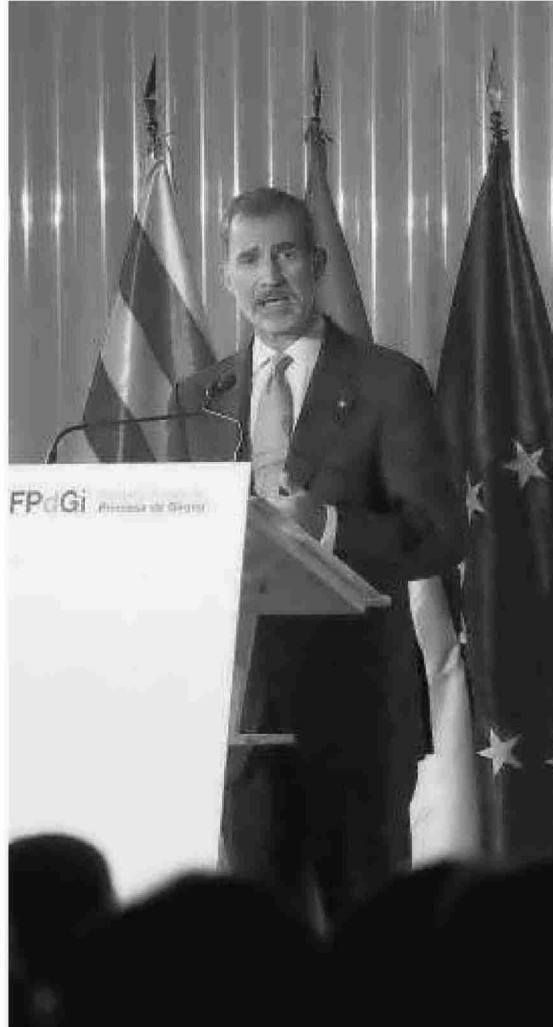
Felipe VI en la entrega de los Premios Princesa de Gerona el mes pasado.

La envergadura, grandes y misterios de la Creación y evolución del hombre, varón y hembra, no tienen parangón. Para mí, la simplicidad, sabiduría y eficiencia del significado de las constantes uni-