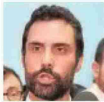
Roger Torrent Presidente del Parlament

▼ Como era de esperar, el nuevo máximo responsable de la Cámara autonómica no ha tardado demasiado en acudir a echar una mano al forajido de Bruselas, al que, naturalmente, no aconsejó que regrese a España y se someta a la acción de la Justicia. El separatismo, siempre refractario a la ley