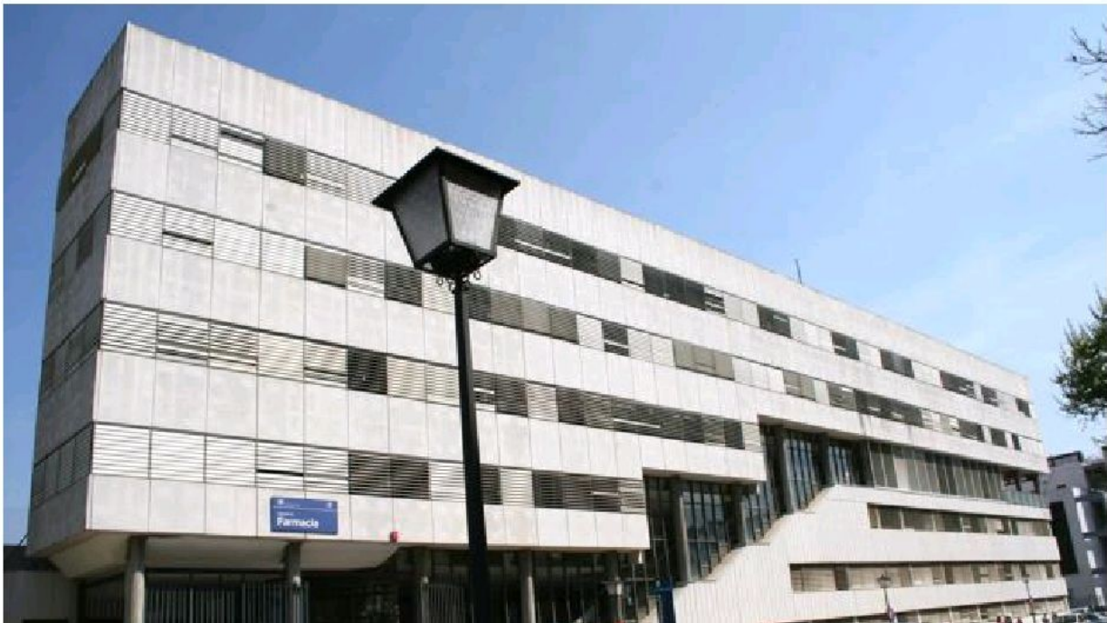
Facultad de Farmacia - ABC