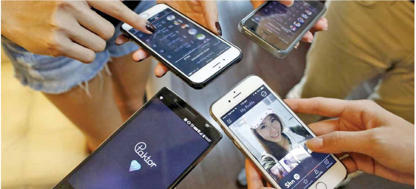
La normalización del control entre parejas de adolescentes a través del móvil es una forma de micromachismo.

Micromachismos. Son comportamientos cotidianos mediante los que se que ejerce una violencia de «baja intensidad» contra las mujeres, perpetuando la desigualdad de género