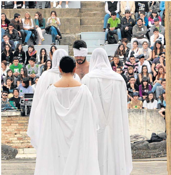
Representación de 'Edipo Rey' en Itálica.

La primera sesión, el jueves 1 de diciembre, arranca fuerte: el escritor y dramaturgo Vicente Molina Foix pronunciará la lección inaugural, titulada Piedras antiguas, palabras nuevas ; a lo que seguirá la disertación de otro grande del teatro español actual: Alfredo Sanzol, que contará sus experiencias con el teatro clásico; Sanzol ha di-