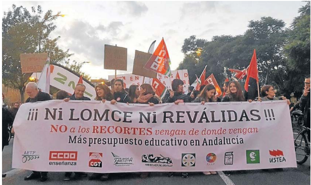
La pancarta que abría la marcha reivindicativa, junto a la muralla de la Macarena poco después de las seis de la tarde.

Resumidas las reivindicaciones de la jornada, conviene