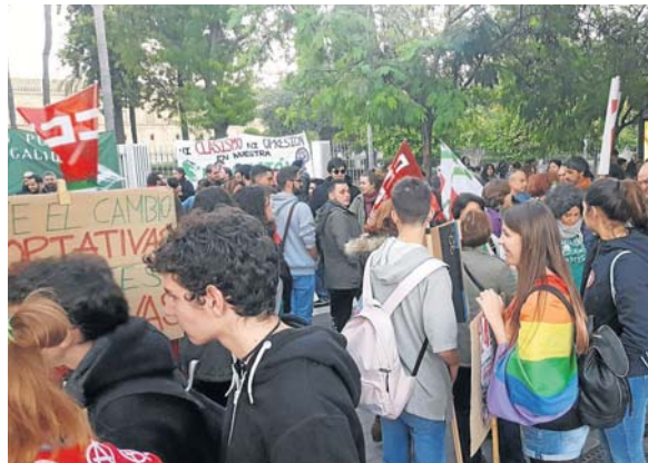
Manifestantes y agentes de Policía, en la puerta del Parlamento.