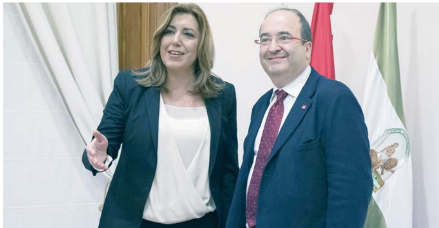
Los líderes del PSOE andaluz y del PSC, Susana Díaz y Miquel Iceta, ayer en la reunión que mantuvieron en Sevilla.

POLÍTICA Los líderes del PSOE-A y del PSC liman asperezas en Sevilla en una reunión con las bendiciones de la dirección