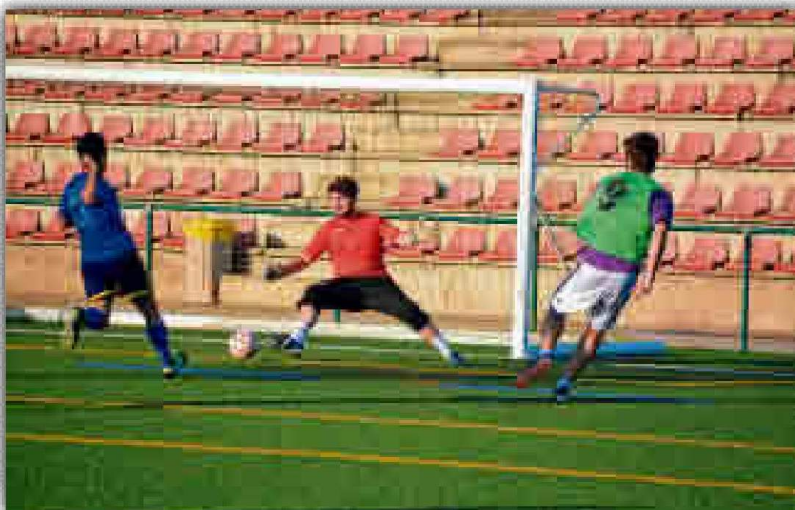
Imagen de un torneo de fútbol 7 organizado por la US.

Desde el SADUS recalcan que con este pase se puede participar en las diferentes competiciones organizadas por el centro, pero no es necesario poseerlo si ya se es abonado al servicio en el transcurso de las mismas. Aquellos interesados en hacerse con un pase de temporada pueden solicitarlo en las diferentes Oficinas de Atención al Cliente del SADUS o a través de la Oficina Virtual, evitando colas y tiempos de espera en las instalaciones universitarias.