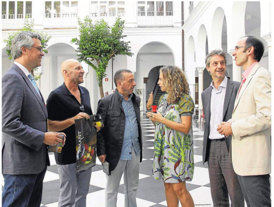
Los responsables de la Academia de Música Antigua la presentaron ayer en el Cicus.

La Orquesta Barroca, la Universidad de Sevilla , Ayuntamiento, Asociación de Amigos de la OBS y CSM Manuel Castillo son las instituciones que sostienen una Academia que, según Rico, está todavía «en su es-