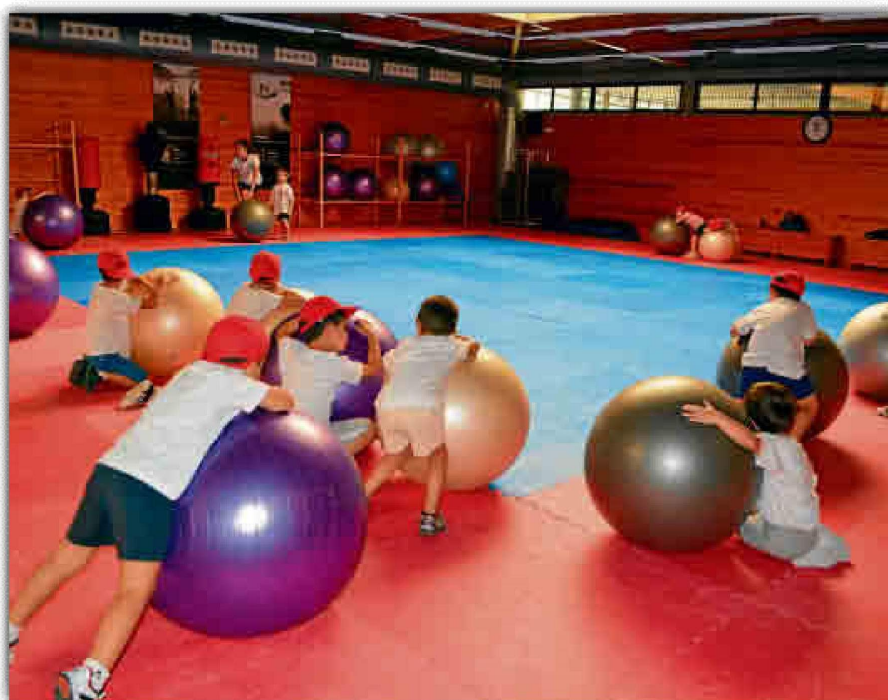
Las jornadas del año pasado fueron todo un éxito de participación.