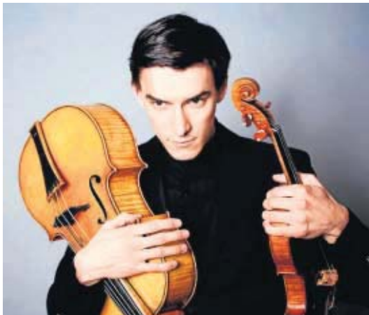
El ruso Sergey Malov ofrecerá la primera clase magistral del curso.

Tras ser seleccionados en un proceso en el que participarán los docentes del centro junto con una persona designada por la OBS, los alumnos de este grupo residente participarán en las masterclasses así como en un seminario de interpretación conjunto al lado de alumnos de otros conservatorios europeos de la red Creative Cities Of Music de la Unesco. La iniciativa, puesta en marcha por la OBS, la Universidad y el Conservatorio