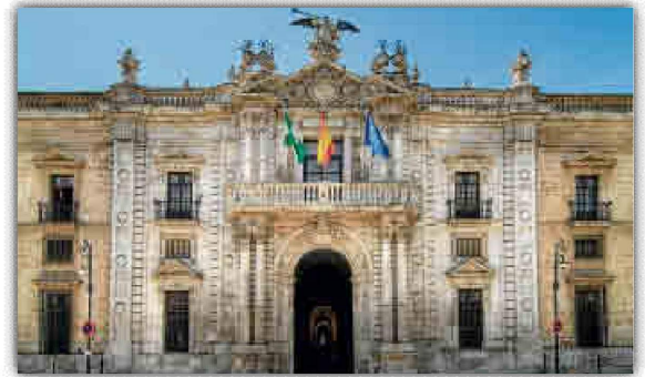
Portada del Rectorado de la Universidad de Sevilla.