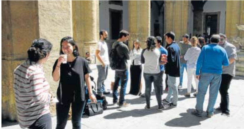
Estudiantes en la sede principal de la Universidad de Sevilla.

Por sectores Los andaluces descartan el sector primario y secundario para emprender y apuestan por la educación, el comercio y la publicidad