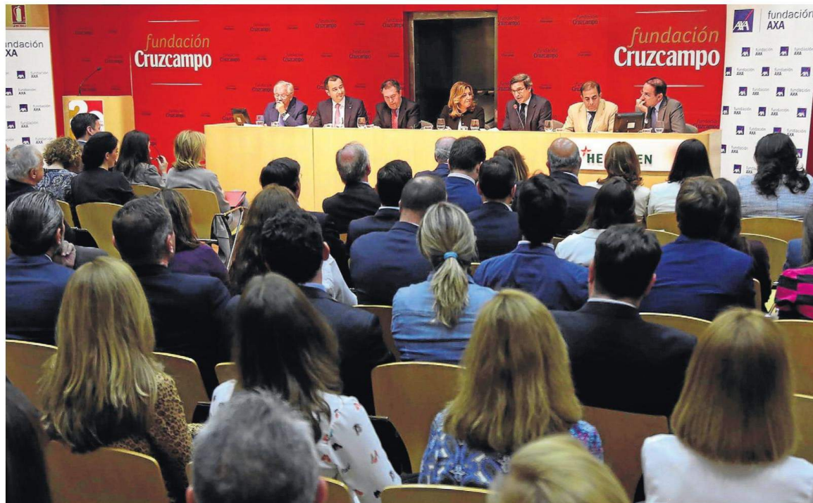
Foto de familia de todos los participantes en el acto que tuvo lugar en la sede de la fundación Cruzcampo.

Los universitarios andaluces apuestan por la función pública y, en segundo lugar, por crear su propia empresa, futuro que eligen casi uno de cada cinco