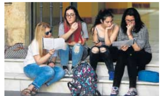
Varias universitarias repasan sus apuntes en el Rectorado.