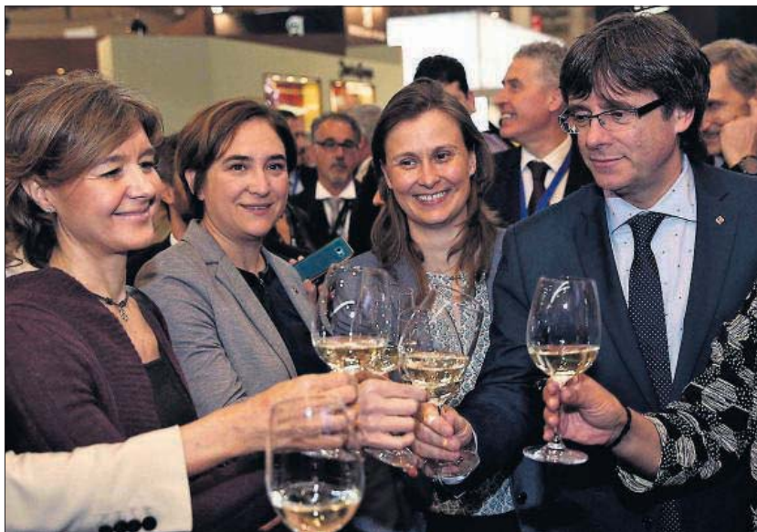
La ministra García Tejerina, la alcaldesa Colau, la consejera Serret y el president Puigdemont.

El ministro de Educación en funciones, Íñigo Méndez de Vigo, se comprometió "a que no se hagan públicos los resultados de las evaluaciones, si ese es el problema". Pero el borrador que se envió al Consejo y a las direcciones provinciales de Ceuta y Melilla no lo contemplaba. Previamente, la LOMCE eliminó una referencia contraria a las clasificaciones de la ley previa, la Ley Orgánica de Educación (LOE) del PSOE.