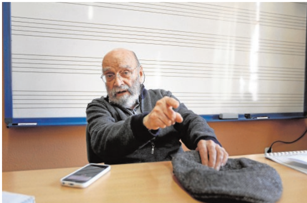
Luis de Pablo, ayer en un aula del conservatorio superior Manuel Castillo, de Sevilla