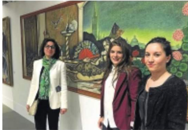
DIPUTACIÓN SANTI RODRÍGUEZ

En la muestra, que permanecerá abierta al público en las salas Matadero, de la capital de España hasta el próximo día 16 de octubre, pueden contemplarse tres cuadros salidas de los pinceles del pintor extremeño Anto-