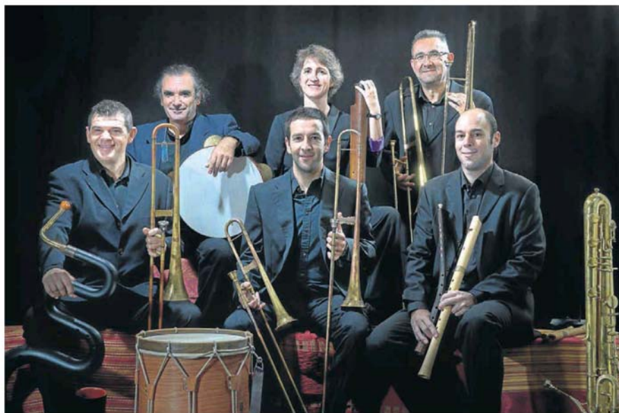
El grupo Ministriles Hispalenses inaugurará este año la Muestra de Música Antigua (Maus).