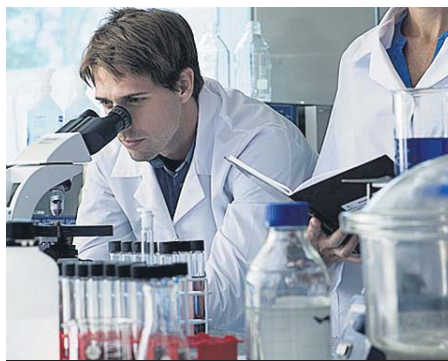
El sector de la Ciencia también demanda profesionales.

En el ámbito financiero, lo más demandado es el perfil de controller , es decir, un trabajador que se encargue del control de la gestión de las empresas. Suelen contar con una titulación en ADE o Eco-