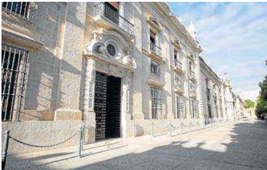
Fachada de la zona rehabilitada recientemente y que albergará los despachos de la Facultad de Filología. M. G.

Estas obras en el interior del rectorado han permitido descubrir un sistema de cimentación —construido entre 1728 y 1771— basado en una retícula de arquerías invertidas que dotan al inmueble de una gran resistencia a los seísmos. Según los expertos, ésta es la clave por la que, después de casi 300 años desde el inicio de la construcción del edificio, éste no presente ni grietas ni fisuras importantes, pese a importantes episodios sísmicos como el terremoto de Lisboa.