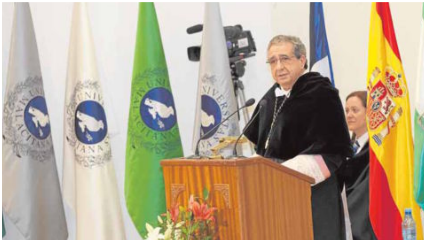
El rector, durante su intervención en la toma de posesión de su equipo de gobierno. ■ ALVARO CABRERA