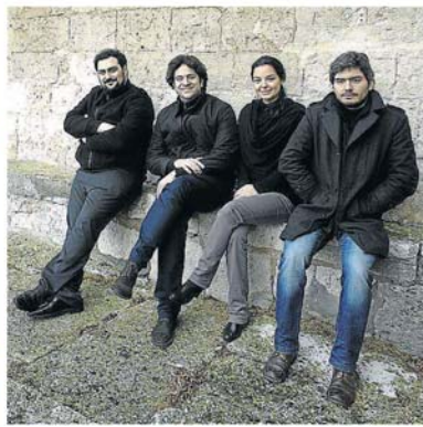
Vandalia también participa en el Maus.