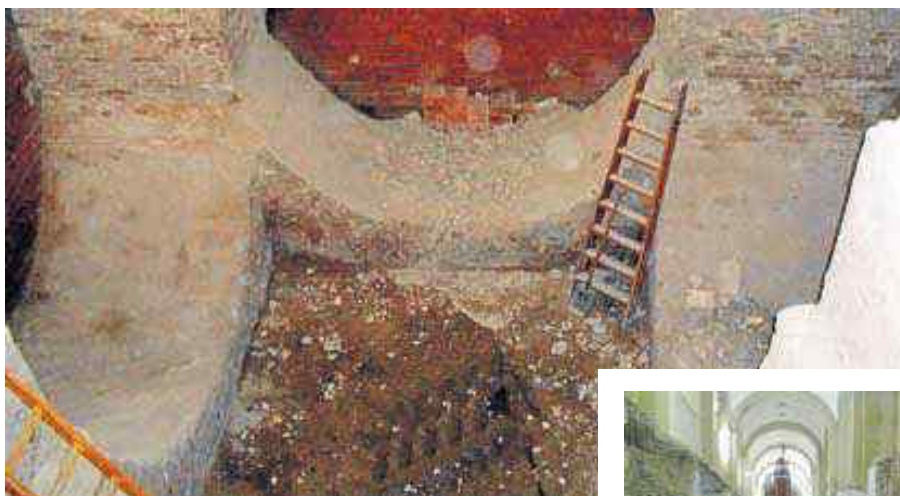
EXCAVACIONES. Las obras de remodelación han permitido descubrir un sistema antisísmico en los cimientos del Rectorado que se basa en una serie de arquerías invertidas. D. S.

El descubrimiento se produjo durante las excavaciones en las antiguas dependencias de Derecho para la construcción de una galería subterránea en