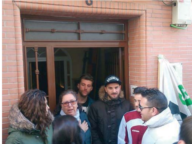
Decenas de personas se concentraron ayer a la puerta de la vivienda para apoyar a la familia afectada. EP