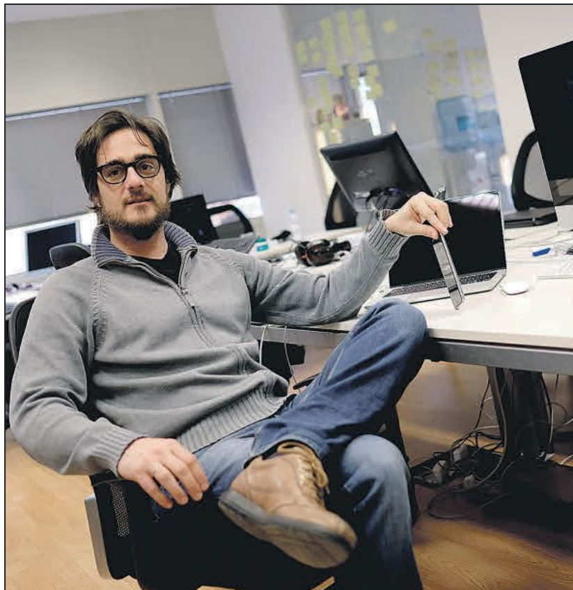
Icinetic ha vendido sus herramientas de 'software' a Google, Microsoft, IBM Intel y Mozilla, entre otras. EE

Por lo que he podido ver, las empresas terminan derrumbándose no siempre porque fallen las ventas, sino por rencillas entre los socios o porque cambian la visión inicial de la compañía. En nuestro caso no ha sido así y hemos mantenido esa misma idea. Lógicamente, nos hemos ido adaptando a los diferentes momentos que nos han tocado, también hemos mejorado hasta cinco versiones de un mismo pro-