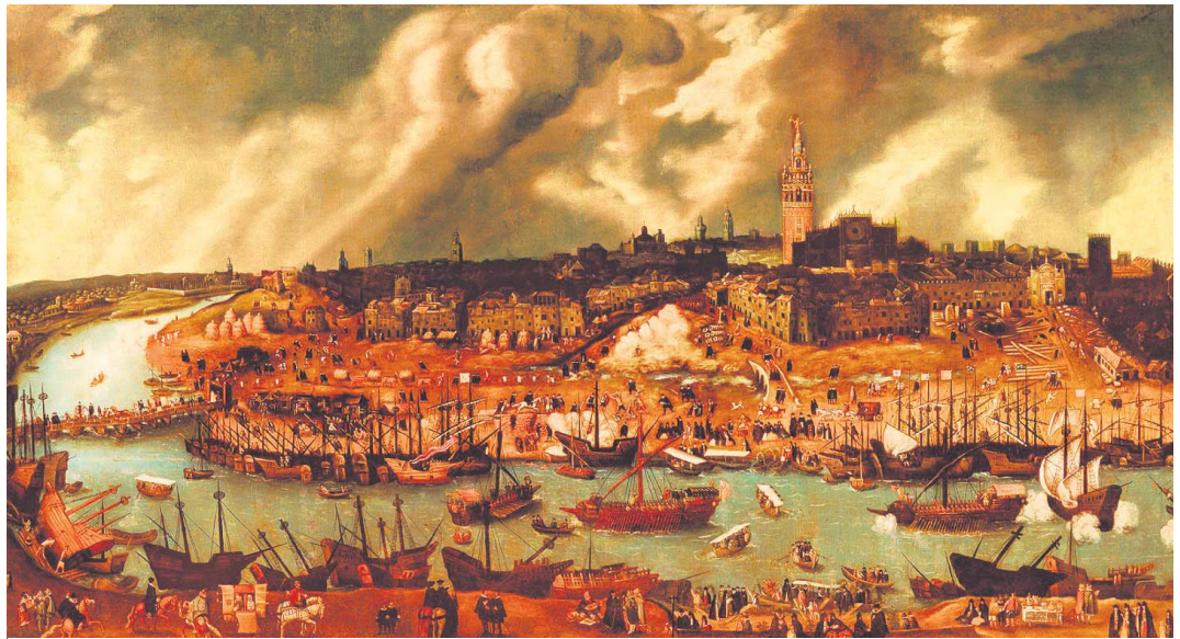
Pintura expuesta en el Museo de América de Madrid de una vista de Sevilla en torno al año 1600.

mo tiempo que se crean instituciones como la Casa Cuna o la Casa de las Arrepentidas -vano intento de atajar el incremento de la prostitución y, de rebote, de los casos de sífilis-, aparecen nuevas y magníficas construcciones, como la Fábrica de Tabacos, la Residencia de Venerables Sacerdotes, San Telmo y el Oratorio San Felipe Neri.