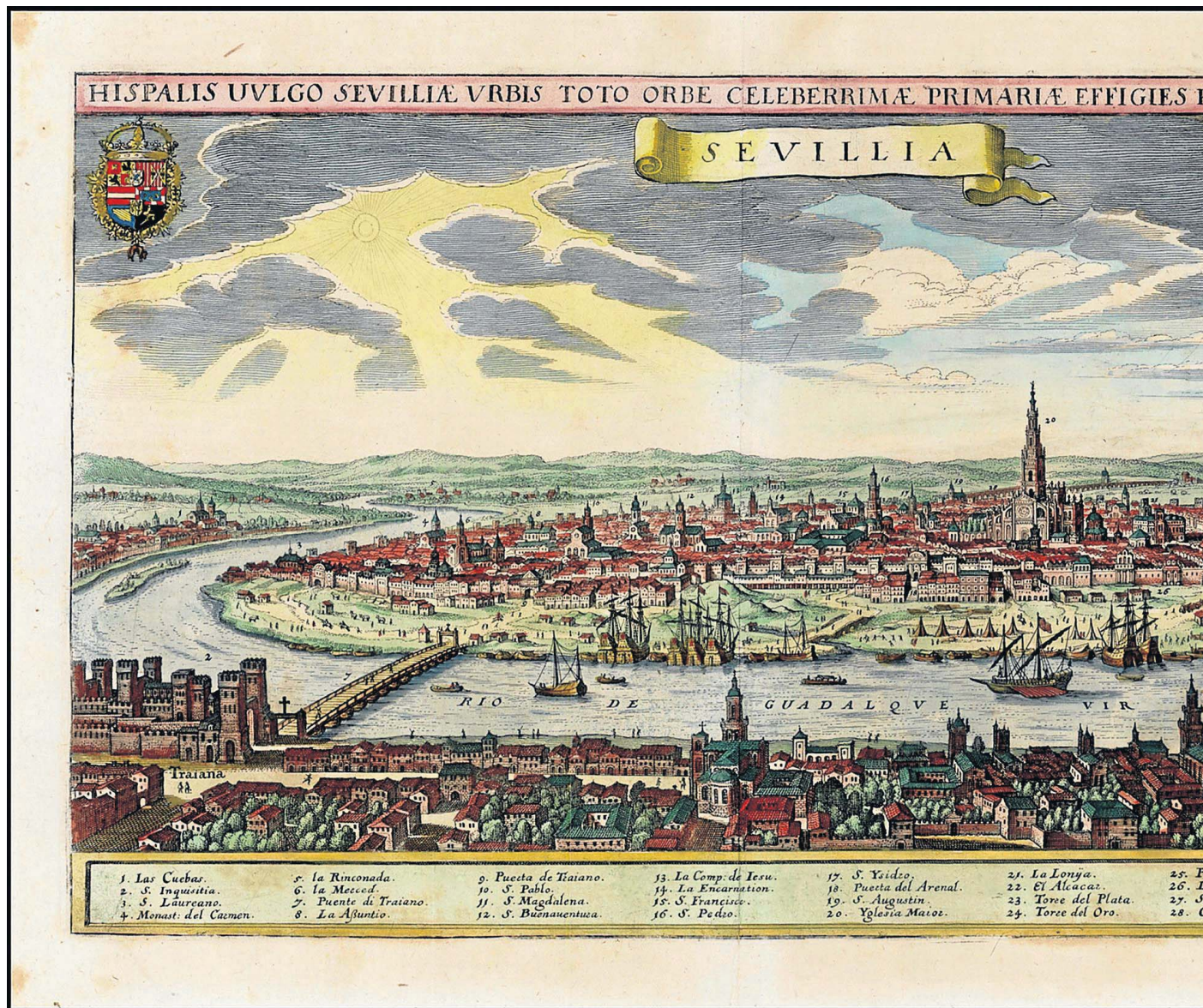
Hispalis Vulgo Sevillae urbis, un grabado que muestra la ciudad en 1619 desde la margen derecha del río.