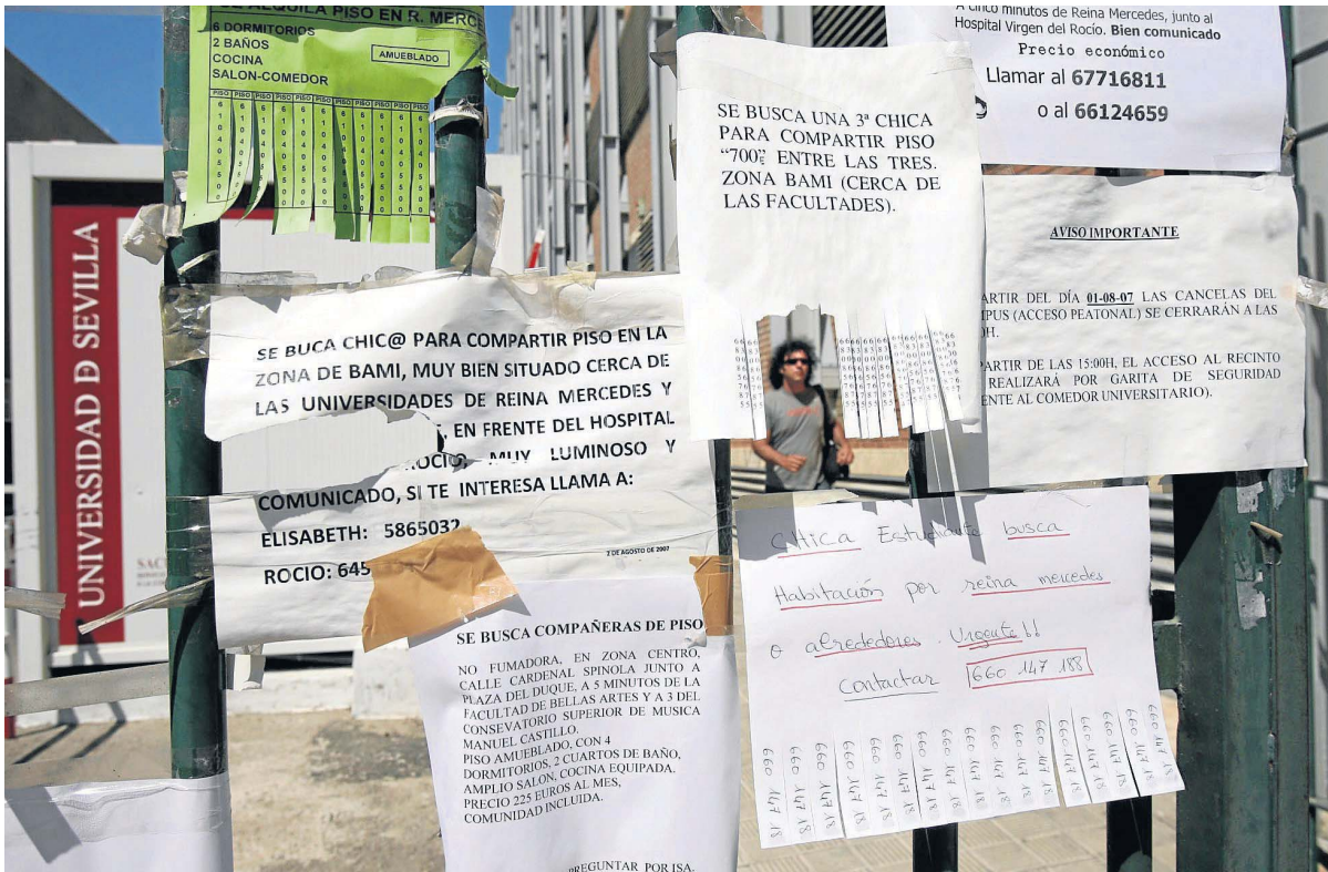
Tablón de la Universidad de Sevilla plagado de ofertas para compartir y alquilar piso en las inmediaciones del campus. / Javier Cuesta