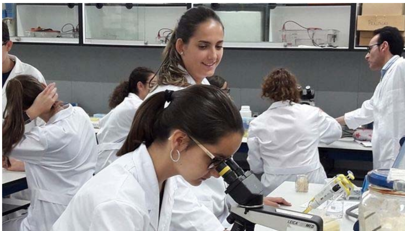
Imagen del Programa Campus Científicos de Verano.