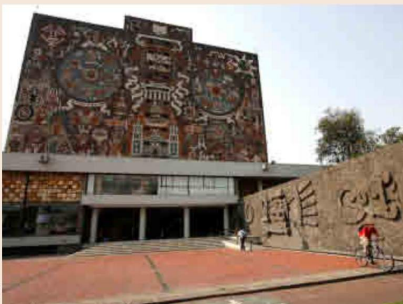
MÉXICO El Instituto Tecnológico de Estudios Superiores Monterrey y la Universidad Nacional Autónoma de México son dos centros a los que sueñan con ir miles de jóvenes del mundo entero.