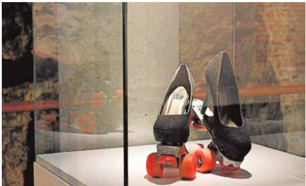
'Glamour-roller', de Ignacio Lanzas Zambrana, es una de las piezas de la muestra.