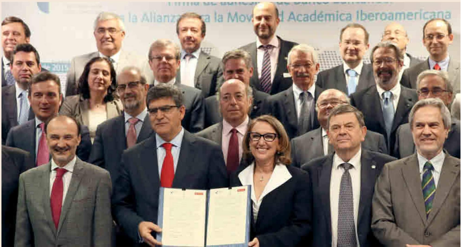
La secretaria general iberoamericana Rebeca Grynspan (c) y el consejero delegado del Banco Santander, José Antonio Álvarez (2i), firman el acuerdo el viernes pasado.