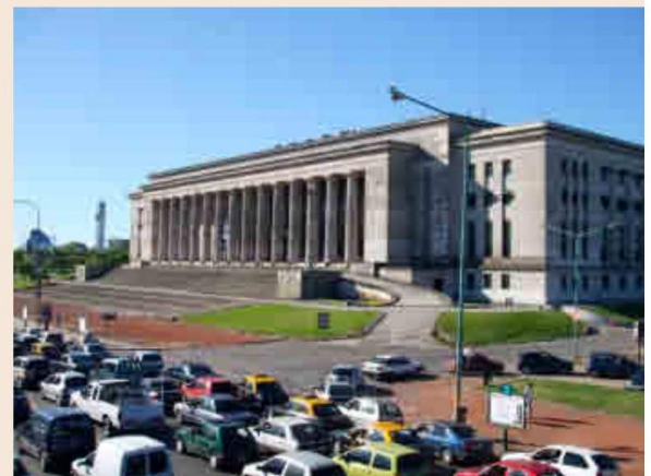
ARGENTINA La Universidad de Buenos Aires, la Universidad Austral, la Universidad Nacional de la Plata y la Pontificia Universidad Católica Argentina son un referente a nivel internacional.