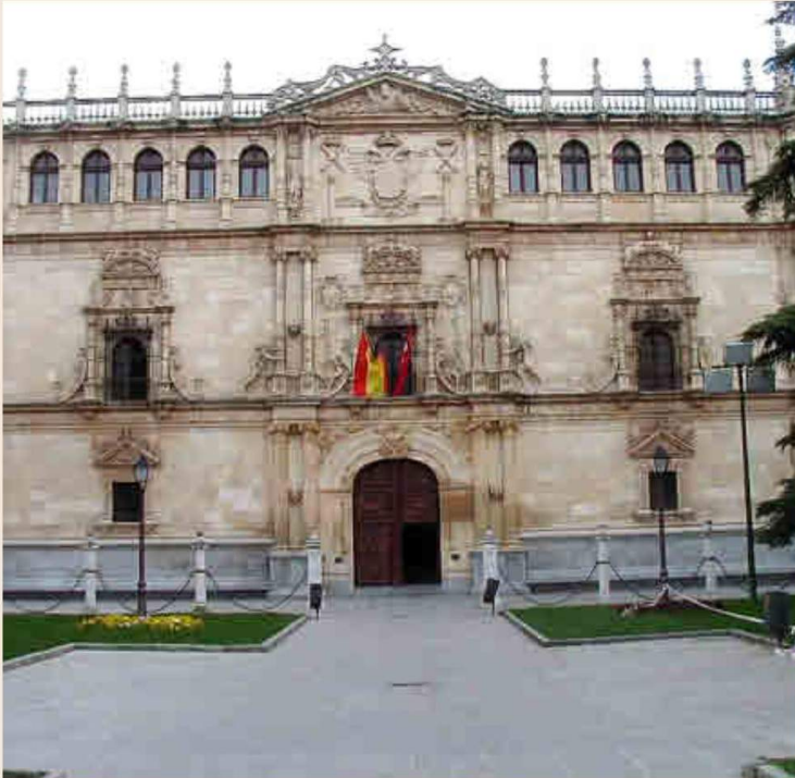
ESPAÑA Los estudiantes de cualquier país iberoamericano podrán realizar estancias temporales en universidades españolas tan prestigiosas como la de Salamanca, la de Alcalá de Henares o la Complutense de Madrid.