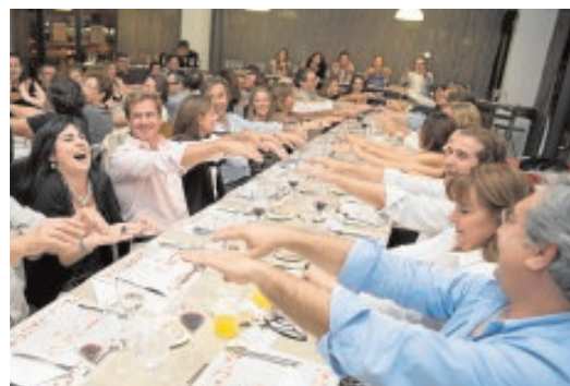
Algunos de los momentos de «Catas con arte» en Sevilla y Cádiz