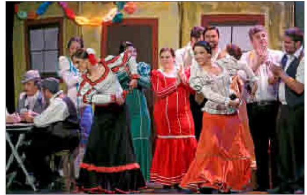
Una escena de 'La revoltosa', que se verá en la Sala Turina. COMPAÑÍA DE ZARZUELA

La Compañía Sevillana de Zarzuela tiene como objetivo el rescate del género musical de la zarzuela, la promoción de jóvenes andaluces de las artes escénicas musicales y la recaudación de fondos económicos para entidades no lucrativas.