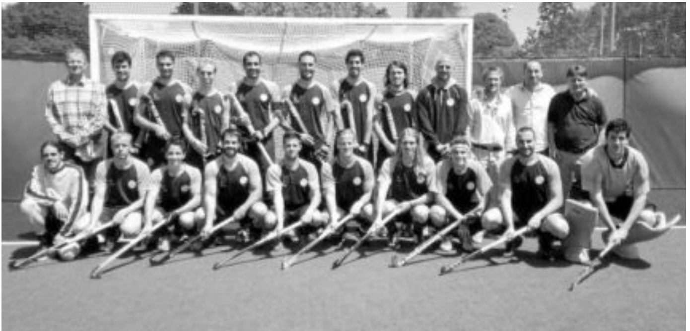
La plantilla del Hockey Benalmádena rindió a gran nivel en las semifinales de Gijón.