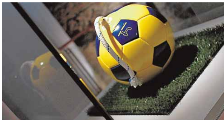
Este balón que emula una bomba se titula 'El crack'.

posición es la titulada 'Fuera de juego'. En ella se observa una jaula con silbatos dentro (y automáticamente el visitante se imagina el sonido de los pitos). «Esta obra tiene varias lecturas: una de ellas puede ser un símil con los pájaros, que no viven en libertad en el momento que se les atrapa en estos trastos; otra puede ser una representación de las protestas, a veces silenciosas (los silbatos encarcelados)», señala Linares Pedrero.