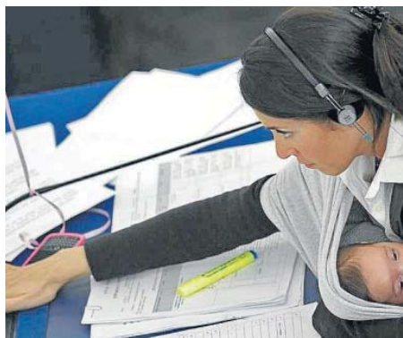
La OMS recomienda un descanso tras dar a luz de 24 semanas.

Los eurodiputados confían en que la nueva CE, presidida por Jean-Claude Jun-