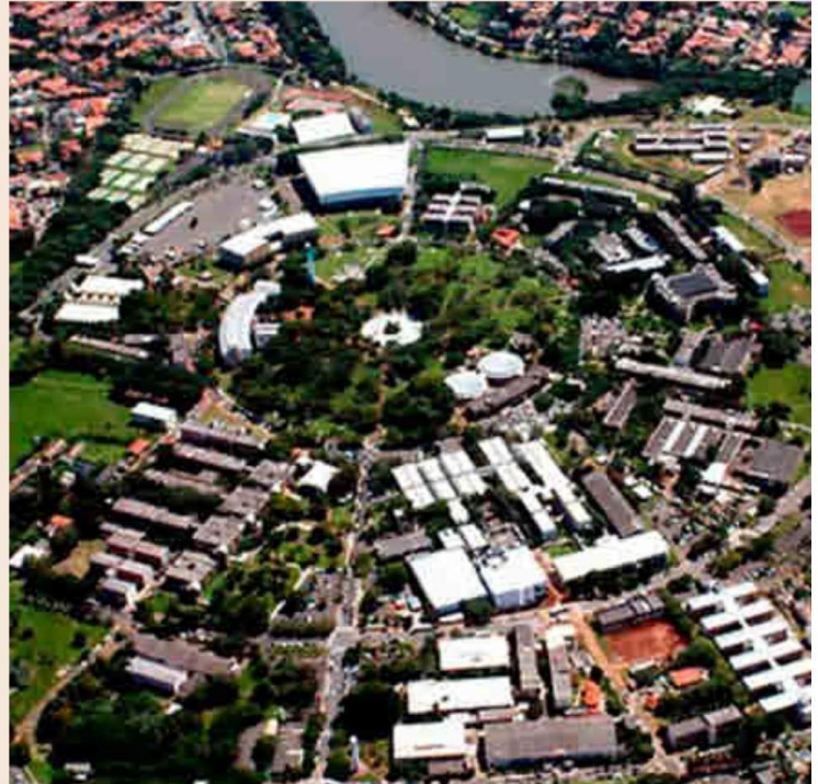
BRASIL El país latino cuenta con universidades tan importantes como la Universidad de São Paulo, la Universidad Estadual de Campinas, la Universidad Federal de Rio de Janeiro y la Universidad de Brasilia (UNB).

ahora. Da idea del sendero trazado que en agosto los ministros de Educación iberoamericanos acordaron en México con las becas Paulo Freire, auspiciadas por la Organización de Estados Iberoamericanos (OEI), que permitirán la movilidad de los maestros y los profesores de secundaria. La idea es que el primer curso se beneficien 1.500 docentes.