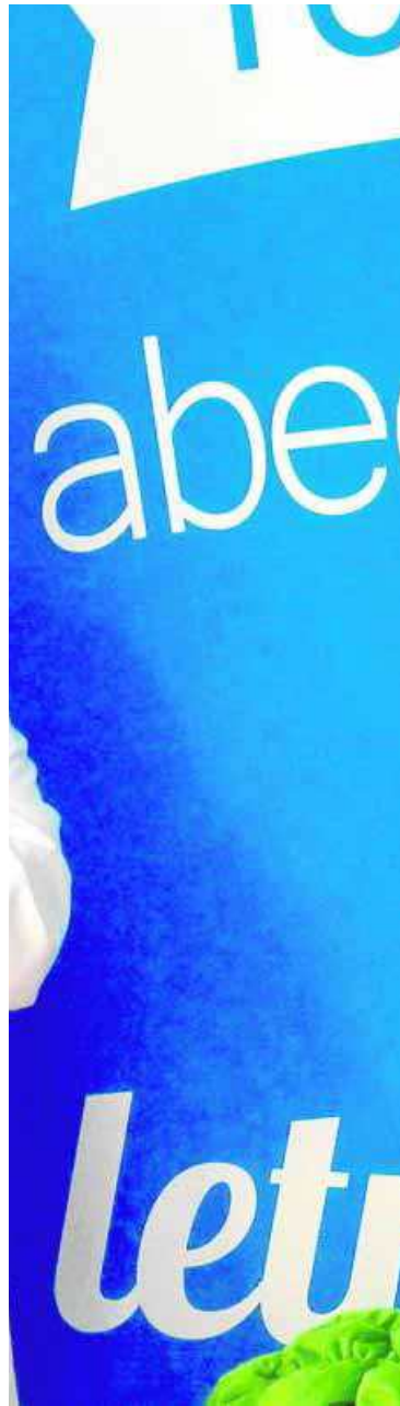
el Foro de IDEAL. :: IDEAL

ten medidas a tomar y que están tardando demasiado. Son muchos los implicados para solucionar este grave problema. Se trataría de una acción continua y coordinada del sector industrial, el sector académico, el sistema sanitario, los gobiernos y las familias de este nuestro país. La intervención debería ser en los dos sentidos, de abajo a arriba y viceversa, desde la familia al gobierno y desde el gobierno a la familia.