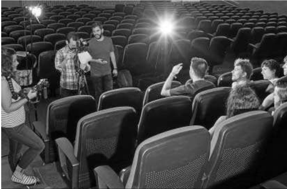
Los alumnos de la Facultad de Comunicación ultimán detalles antes del certamen. M. G.

● La Gala Comunicación en Corto exhibe y premia este jueves el trabajo de los estudiantes de Comunicación Audiovisual