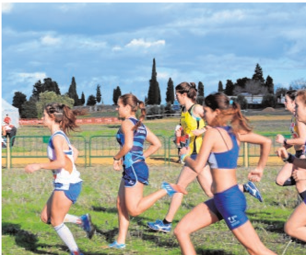
Itálica volverá a acoger la disciplina de campo a través

Durante la reunión se llevó a cabo por sorteo entre las universidades solicitantes la asignación de sedes para cada una de las modalidades deportivas, siendo la Universidad de Almería la encargada de organizar los campeonatos de voleibol y baloncesto. El fútbol sala y el rugby 7 se marcharán a la Costa del Sol, con la Universidad de Málaga como anfitriona. En la capital andaluza, además del campo a través que llevará a cabo la Universidad de