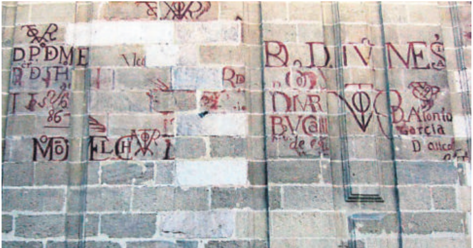
Los grafitos en la fachada de la Catedral de Sevilla