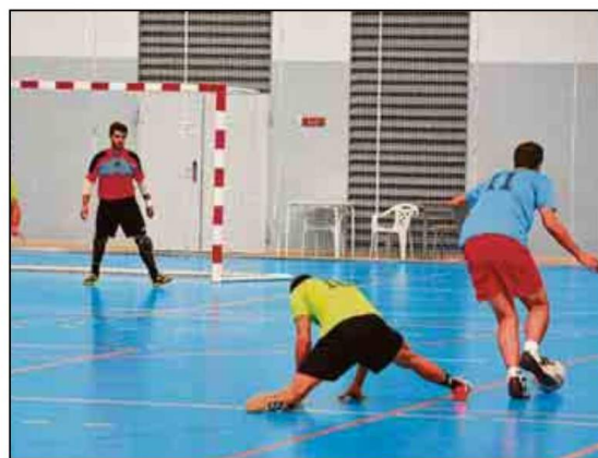
El fútbol sala vuelve a copar el protagonismo en el SADUS.

En la web oficial del SADUS se pueden consultar los horarios