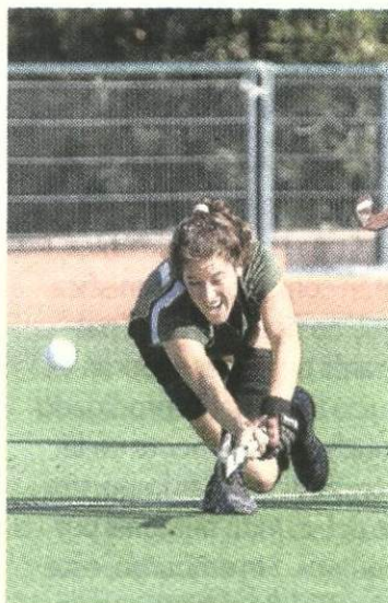
Una jugadora del 'Uni'.

El Universidad de Sevilla, que lograba su primer punto en esta liga de División de Honor la pasada jornada, seguirá de farolillo rojo una se-