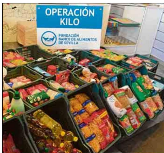
El SADUS promueve la recogida de alimentos no perecederos.

talaciones del Servicio de Actividades Deportivas de la US en el Complejo Deportivo Los Bermejales en horario de 10:00 a 14:00 horas y de 16:00 a 19:00 horas de la tarde.