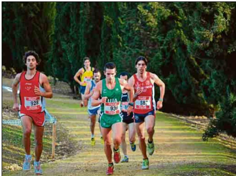
Los interesados ya pueden saber las sedes de los Campeonatos Universitarios de Andalucía.

ARRANQUE SE ESPERA QUE COMIENZE A PARTIR DE MARZO