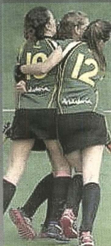
Las chicas del 'Uni'.