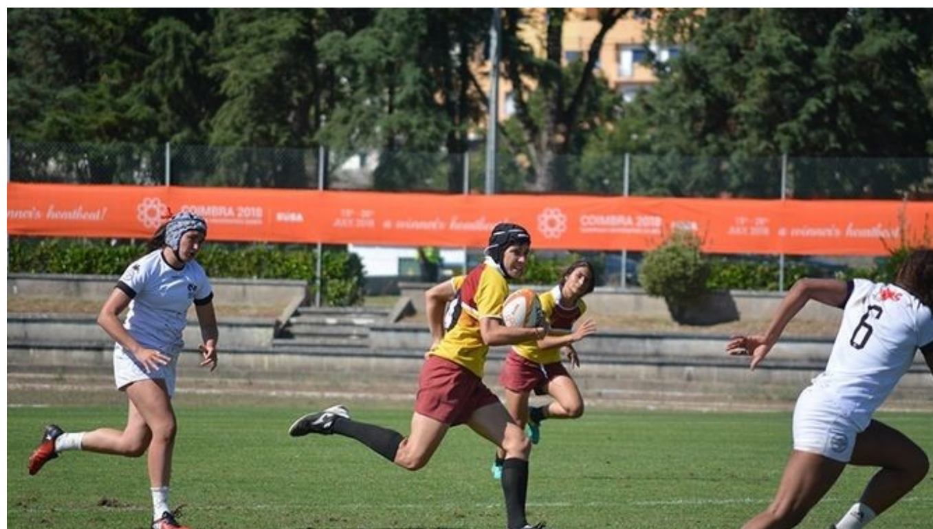
Equipo femenino de rugby.