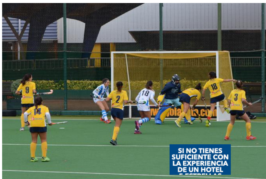
El Universidad de Sevilla remontó ante el Jolaseta en Neguri.

El RC Jolaseta femenino de hockey hierba perdía este domingo pasado (1-2) contra Universidad de Sevilla en un encuentro que comenzó a favor de las de Neguri, pero al que el conjunto andaluz supo darle la vuelta. Una derrota que no tiene repercusiones clasificatorias: las de Jorge Suárez se mantienen en la octava posición con 8 puntos.