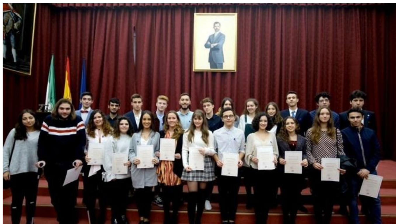
Foto de familia de las mejores notas de corte del curso 2018/19.