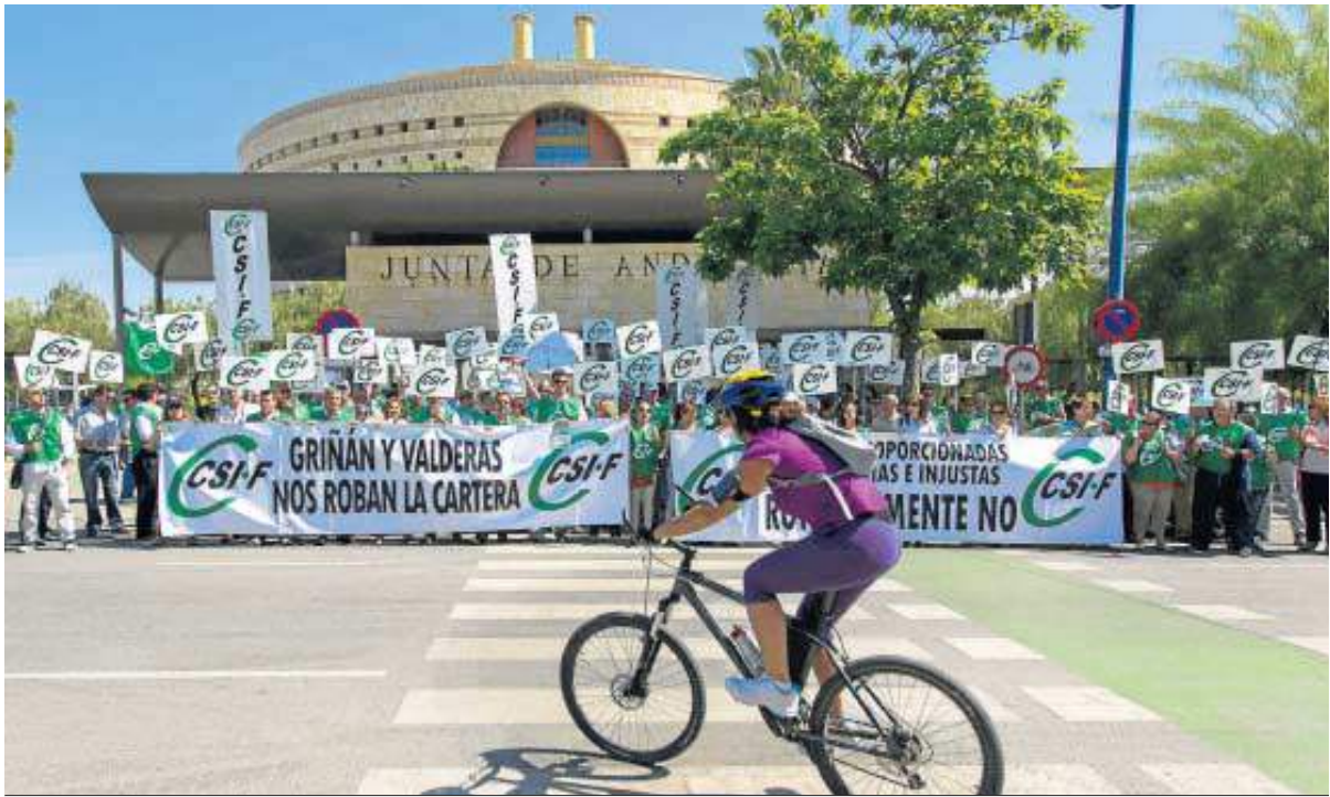
Concentración ante el edificio Torretriana, sede de varias consejerías, para protestar contra el recorte del salario de los funcionarios en 2012.

El recorte de este salario supuso para las arcas de la Junta un ahorro de unos 350 millones de euros. La Administración autonómica cuenta con unos 230.000 empleados públicos entre la Administración general, personal docente no universitario, sanita-