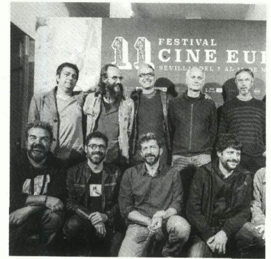
Miembros de la Generación Cinexín.