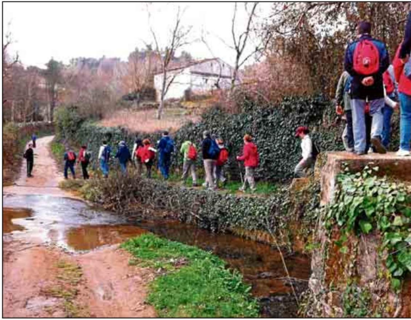
Los amantes del deporte en el entorno natural tienen una nueva oportunidad el próximo 1 de marzo.