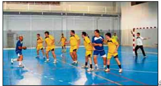
El balonmano asume ahora el protagonismo en los CAU.