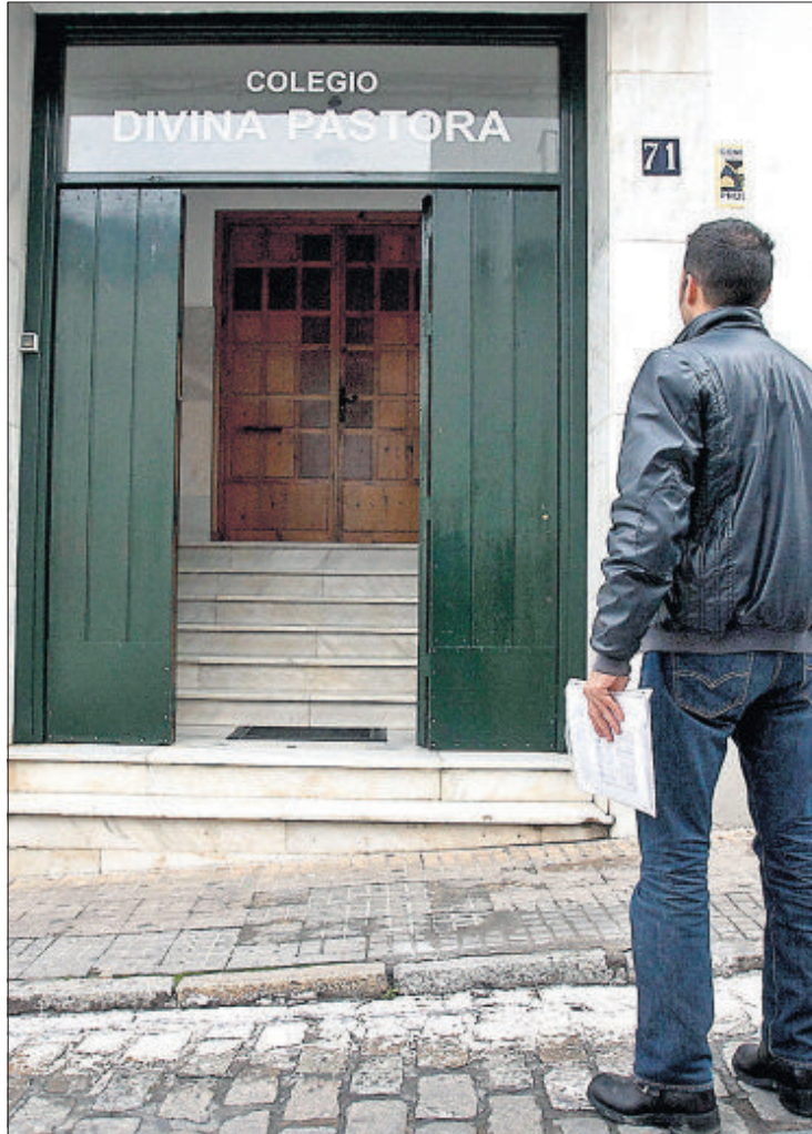
El profesor que ha denunciado al colegio de Sanlúcar.

El sacerdote argumentó en su escrito que podía incurrir en el "delito de divulgación de se-