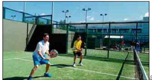
Los usuarios pueden disfrutar de grandes ventajas.