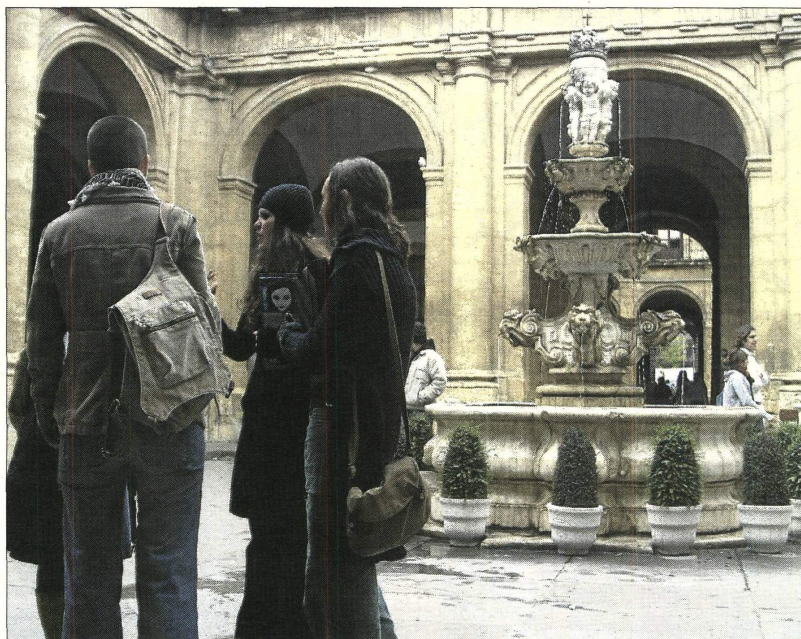
La Hispalense se sitúa en el puesto 369 del ranking que analiza las 400 mejores universidades del mundo.