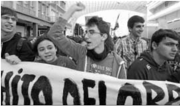
La marcha se inició en la Encarnación y finalizó en el Parlamento andaluz.

principales quejas que se escucharon ayer durante la manifestación celebrada en Sevilla, una de las 40 convocadas por el Sindicato de Estudiantes en todo el país.