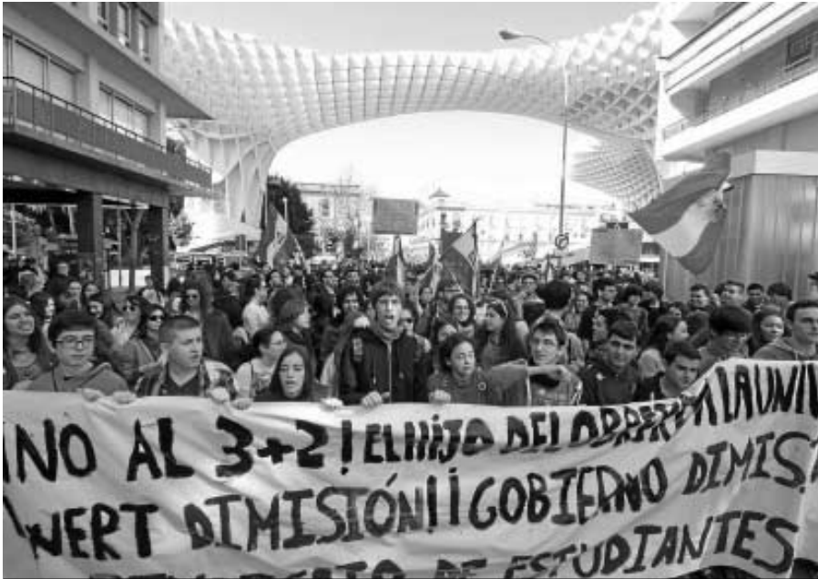
Manifestantes a su paso por la calle Imagen.

Las "desigualdades" que esta reforma pueden crear, el "elevado coste" de los estudios universitarios y la "privatización" de la educación fueron algunas de las