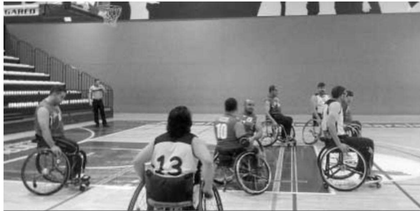
Imagen de un partido reciente del EM Vistazul en el Pepe Ot de Dos Hermanas.

Aun así, este encuentro será diferente, pues los sevillanos llevan cuatro victorias consecutivas, están invictos en su feudo desde hace más de un año y se encuentran a un paso de conseguir un hito histórico en los 10 años de existencia