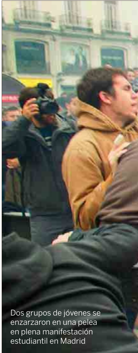
Dos grupos de jóvenes se enzarzaron en una pelea en plena manifestación estudiantil en Madrid