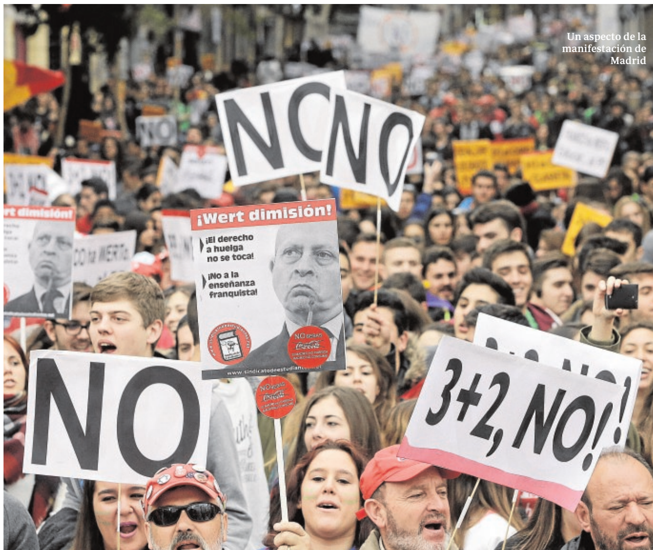
Un aspecto de la manifestación de Madrid