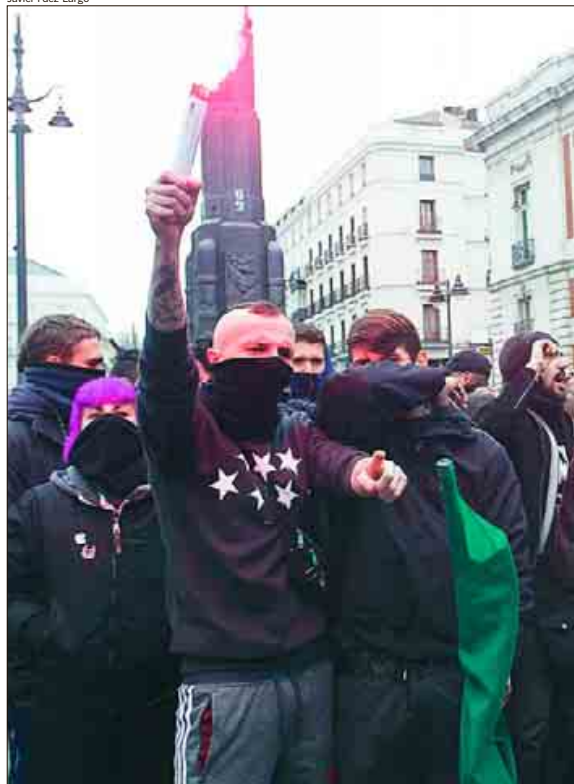
Uno de los radicales que irrumpieron en la protesta estudiantil