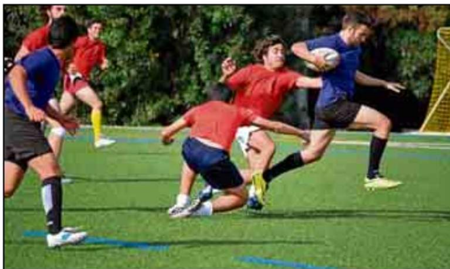
El rugby vuelve a llevar la voz cantante en el Servicio de Actividades.

Los interesados deben contactar con el gestor del centro para que puedan inscribirse a través de la Oficina Virtual.