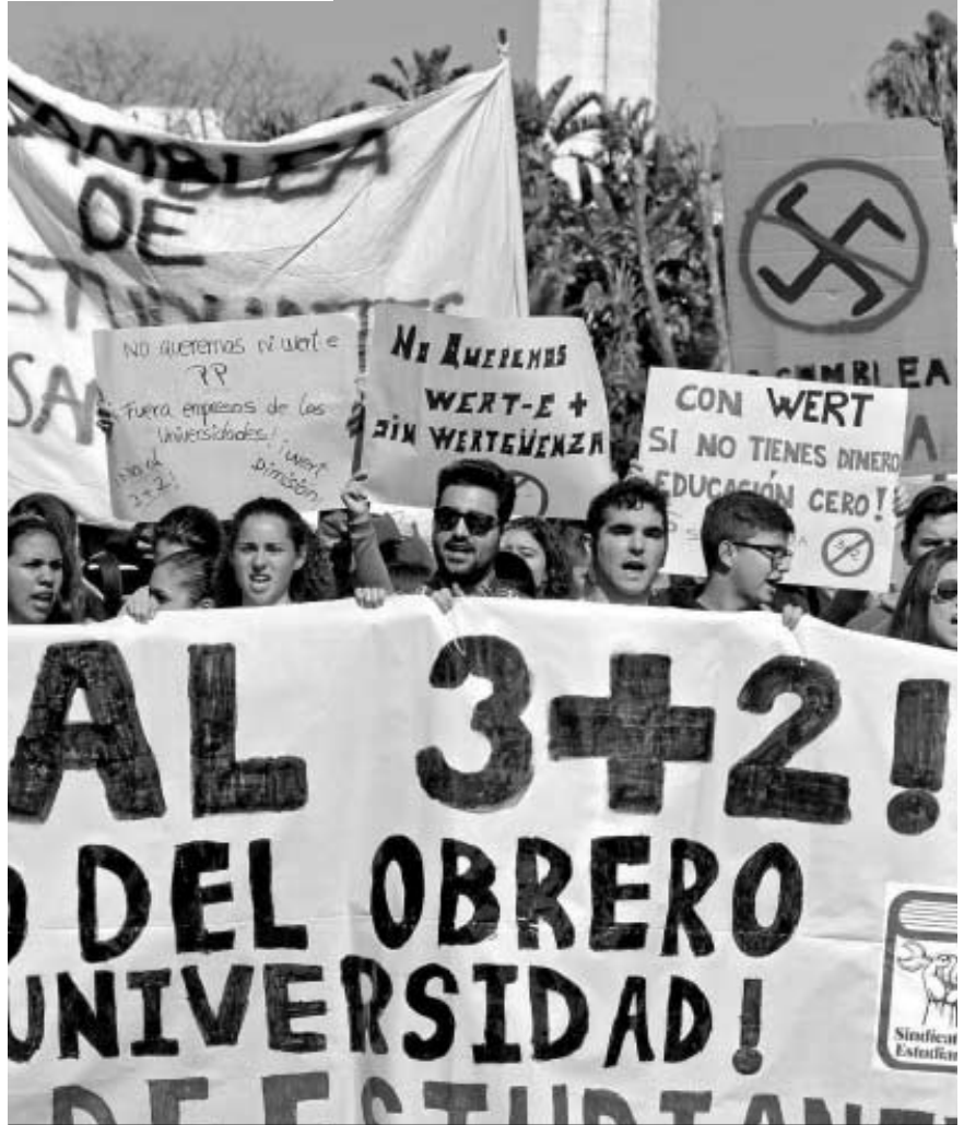
La manifestación contra el decreto 3+2, a su paso ayer por las inmediaciones de la plaza España.

El decreto 3+2 supone “un ataque brutal contra la universidad