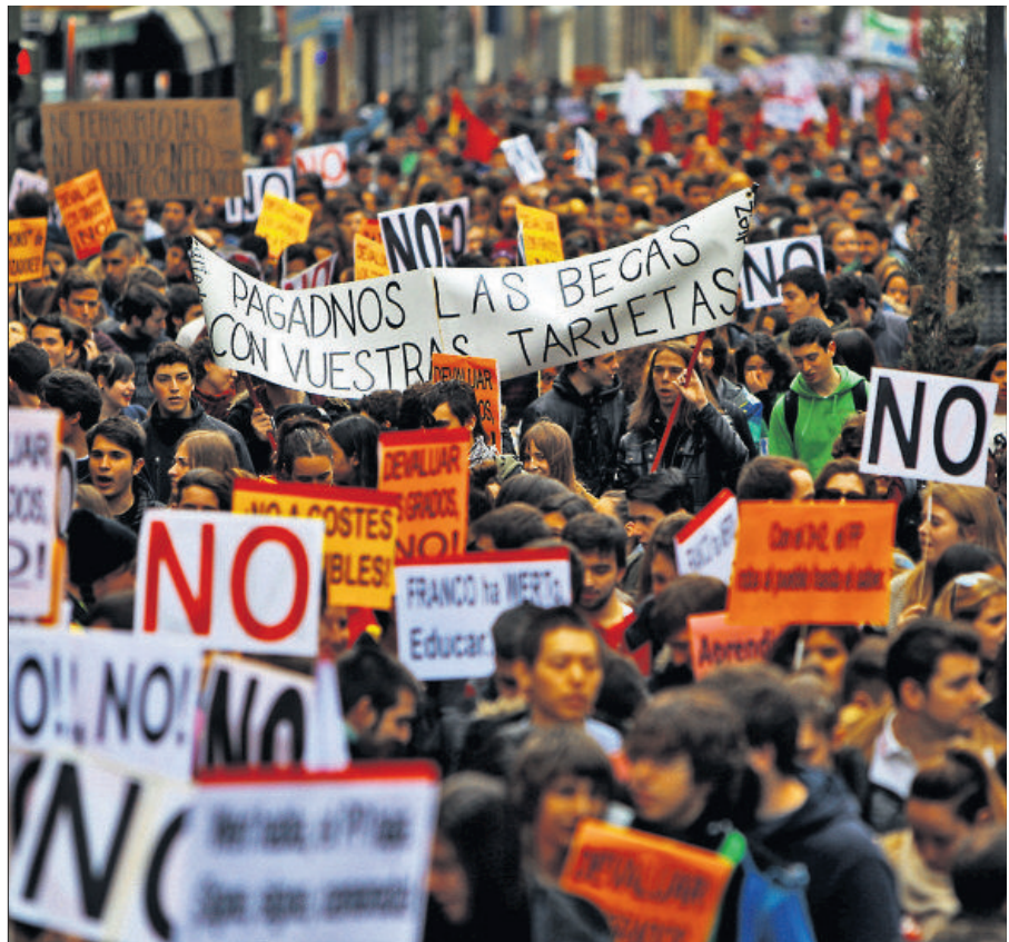
Manifestación de estudiantes de ayer en Madrid contra el cambio de las carreras universitarias.

En Barcelona, la Guardia Urbana calculó unos 6.000 participantes y los organizadores, el doble. La marcha terminó en el Recinto de la Universidad de Barcelona (UB), donde había alumnos encerrados desde el miércoles.