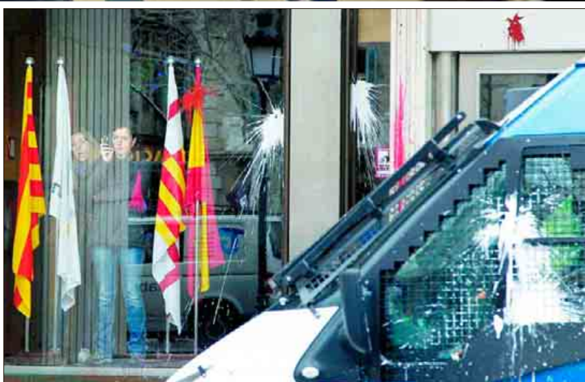
Aspecto de la Bolsa de Barcelona tras pasar la marcha de los estudiantes