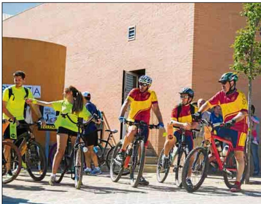
Todo preparado para la II actividad para el fomento del deporte que organiza la Universidad de Sevilla.