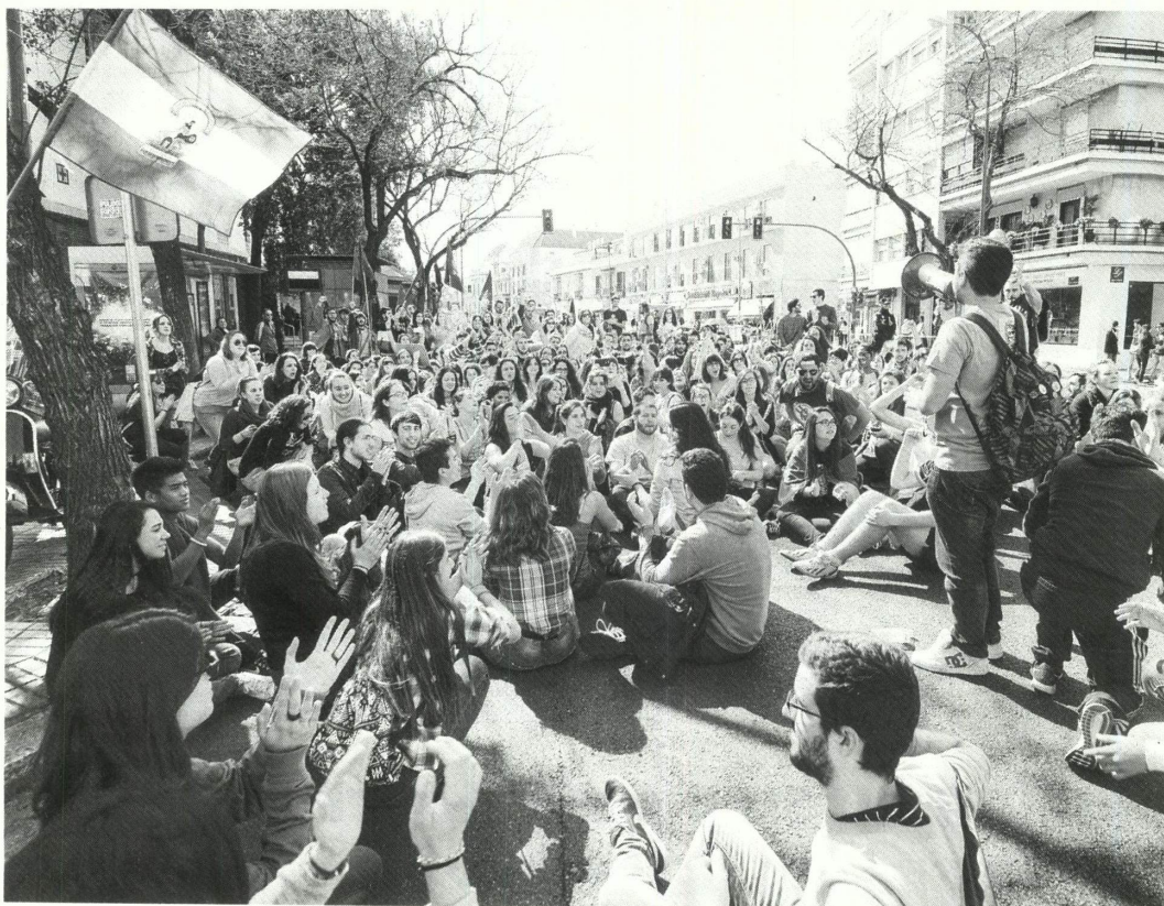
Los estudiantes salieron de las Setas y llenaron de pancartas y consignas todo el recorrido hasta el Parlamento andaluz.