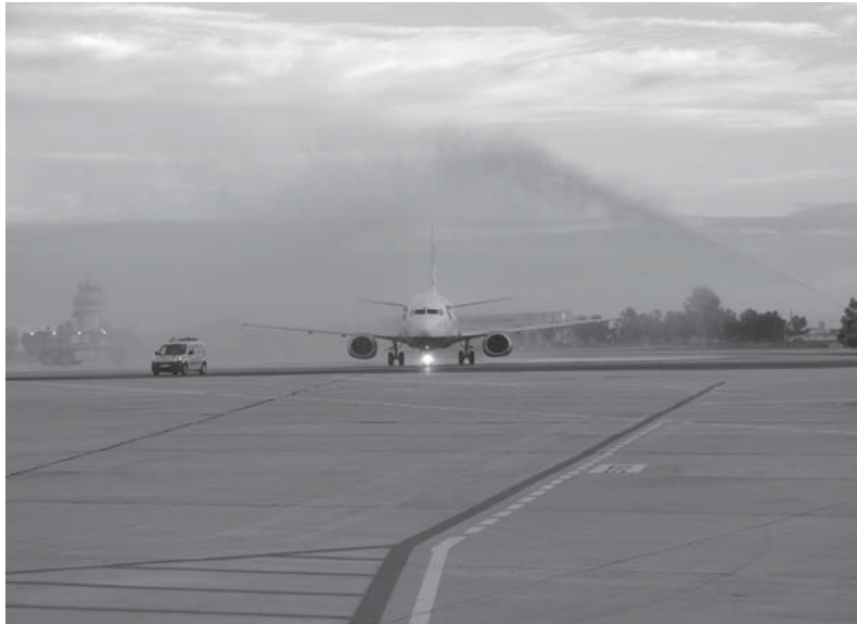
Imagen del día

La, en esos momentos, presidenta en funciones del Congreso fue sorprendida jugando al 'Candy Crush' en su ordenador en pleno debate sobre el estado de la nación, en una total falta de respeto a la Cámara.