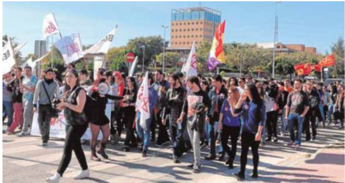
La marcha estudiantil, en el momento de abandonar el campus en dirección al centro de la capital.

MÁLAGA. Un punto y seguido. Estas dos primeras jornadas de movilizaciones estudiantiles, este miércoles y jueves, son sólo un primer paso en una amplia ofensiva contra la reforma universitaria recientemente aprobada por el Gobierno y que permite a las universidades ofertar carreras de tres años de duración (uno menos que en la actualidad), que los alumnos deberían completar con dos años de máster (uno más que ahora). El problema es que un año de grado cuesta 757 euros y un máster sale por casi 2.200 euros. «Quieren expulsar de la universidad a los hijos de los trabajadores», señalaba un representante estudiantil