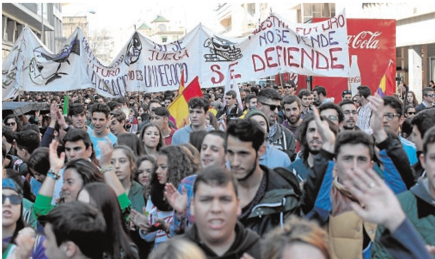
Los estudiantes durante su manifestación ayer por el Centro de Sevilla

Por su parte, el alcalde de Sevilla, Juan Ignacio Zoido, ha remitido una carta al ministro de Educación, José Ignacio Wert, en la que le pide diálogo, consenso y que garantice la igualdad de oportunidades en el acceso a los estudios de grado de los estudiantes con la reforma universitaria 3+2.