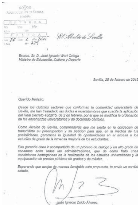
La carta enviada por Zoido al ministro de Educación.

El alcalde de Sevilla considera en la misiva que esa garantía debe ir acompañada de un proceso de diálogo y "un alto grado de consenso" entre todas las administraciones, "que dé como fruto unas condiciones homogéneas en la realización de los estudios universitarios y la equiparación de precios públicos de grados y de máster".