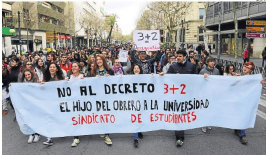
►► Imagen de la manifestación convocada ayer por el Sindicato de Estudiantes.

Las aulas de Secundaria, Bachillerato y Ciclos Formativos de Córdoba volvieron a quedar semi-vacías ayer (víspera del viernes festivo con motivo del Día de Andalucía) con un seguimiento de la huelga de un 73%, 51% y 66% respectivamente, según la Delegación de Educación, lo que no se tradujo en una presencia masiva de alumnos en la manifestación convocada por el Sindicato de Estudiantes, que solo consiguió reunir a unos 300 jóvenes en la manifestación que transcurrió desde el Bulevar a la Subdelegación del Gobierno y que fue secundada también por FETE-UGT, que criticó que “una vez más, el Ministerio de Educación implante reformas sin consenso político ni social, sin debate y sin haber realizado una evalua-