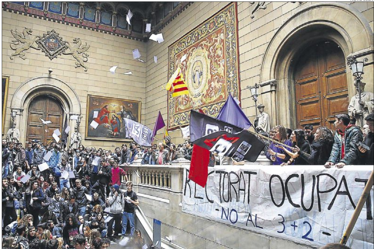
► El rectorado de la Universitat de Barcelona, en el edificio histórico, ocupado por los estudiantes al concluir la manifestación de ayer a mediodía.