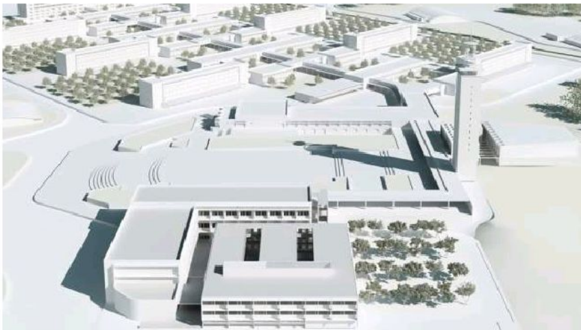
Maqueta del proyecto de la ampliación y reforma de la Etsia. UNIVERSIDAD DE SEVILLA.

La US ha convocado un concurso para seleccionar la mejor propuesta para una reforma integral y ampliación con la construcción de un nuevo edificio anexo a la Etsia, al que se han presentado cuatro licitadores. Se ha valorado la calidad arquitectónica, adecuación a los fines, condiciones de utilidad, así como la viabilidad técnica y económica, según se expone en un comunicado de la US.