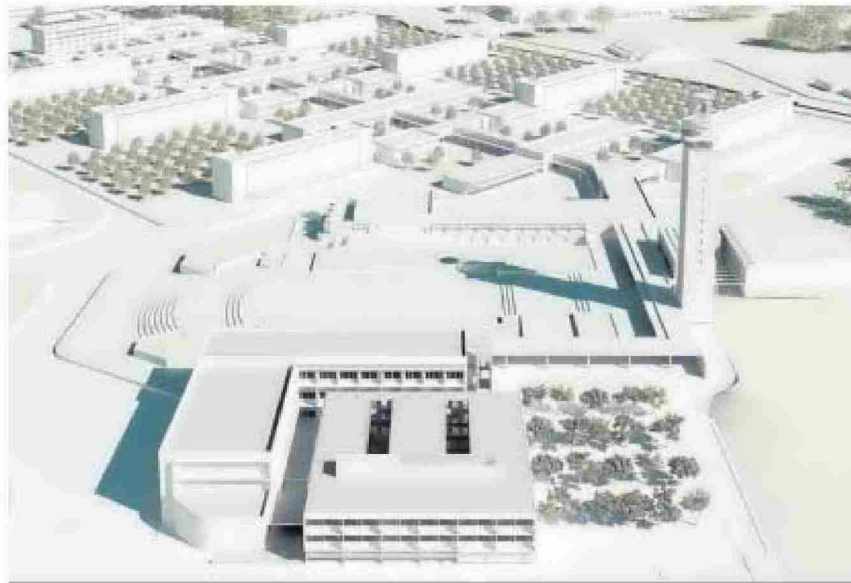
Maqueta diseñada por Estudio Carbajal de la futura Escuela Técnica Superior de Ingeniería Agronómica.

El inmueble cuenta actualmente con una superficie construida aproximada de 7.400 metros cuadrados (m 2 ) y se prevé su ampliación con una nueva edificación anexa de 5.500 m 2 , que estará conectada a través de una pasarela natural a los terrenos aledaños en los que los alumnos realizan sus