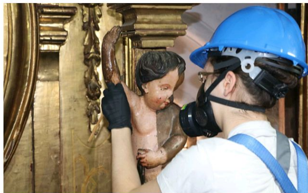
Restauración del retablo mayor de la iglesia de San Andrés.

Portada > Actualidad > Noticias > Así marcha la restauración del retablo mayor de la iglesia de San Andrés