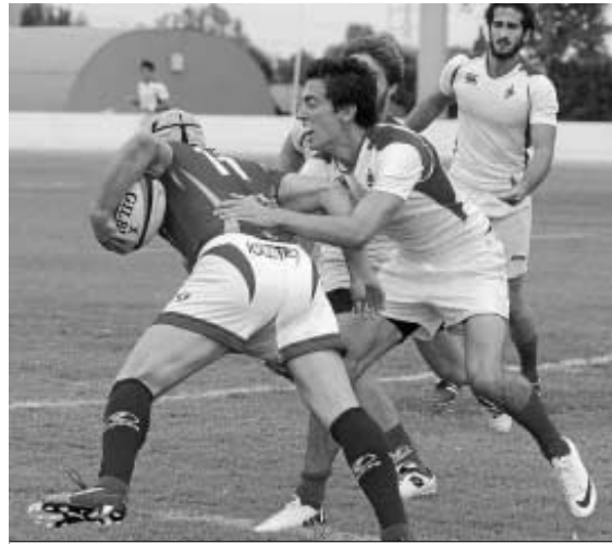
Un jugador del Arquitectura frena el avance de otro del Helvetia.