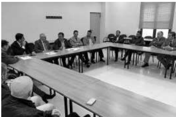
Un momento de la reunión celebrada ayer.