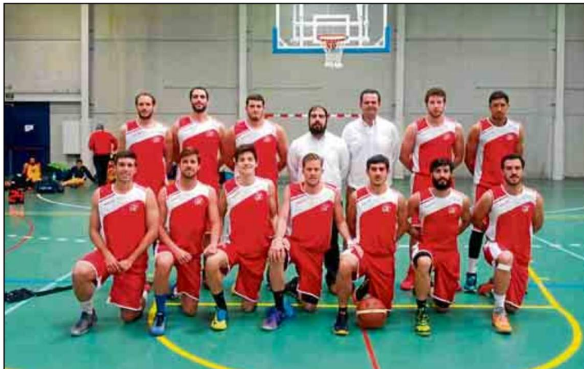
El combinado de baloncesto de la Universidad de Sevilla no dio opción al conjunto de Almería (108-23).