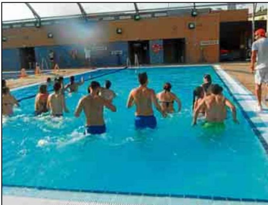
Deporte, agua y música se dan cita en el aquafitness, de gran éxito.

La música, junto con el agua, es uno de los principales elementos que se emplean para llevar a cabo el aquafitness, ayudando a la relajación o activación, haciendo sentir muy cómodo al usuario a la hora de realizar cualquier tipo de ejercicio. Así, los abonados podrán asistir a las clases los lunes, miércoles y viernes, de 19:00 a 20:00 h, y los martes y jueves, a las 14:00 h.