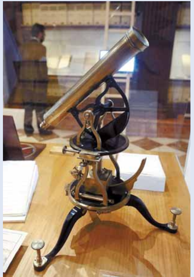
Varios de los objetos y documentos que se incluyen en la muestra sobre el científico y militar español Antonio de Ulloa, en el Archivo General de Indias de Sevilla.