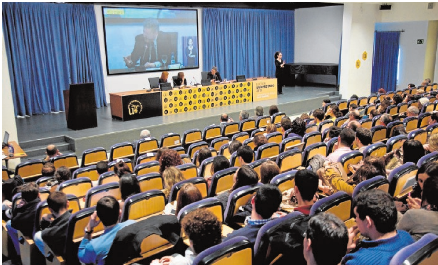
En 2013, Factor Universitario contó con un gran éxito de participantes

Se invita pues a la participación, además de expertos e interesados en la educación, de los jóvenes estudiantes, que son los que protagonizarán el futuro de la Universidad.