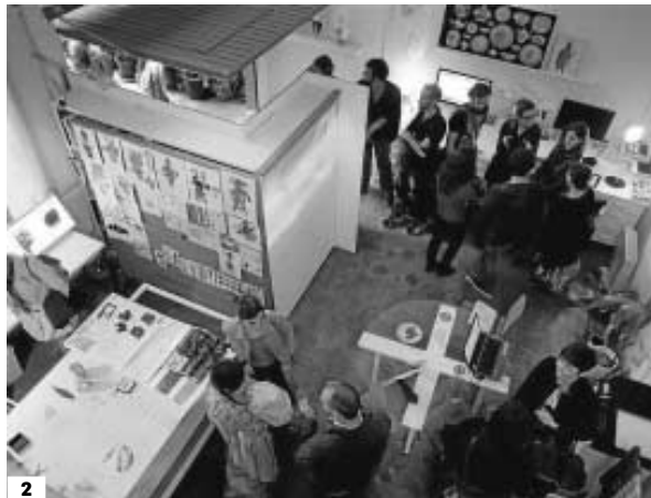
1 y 2. El año pasado las actividades del Sevilla Desing Walk también tuvieron como epicentro la sede de LAB, en el entorno de la Alameda de Hércules.