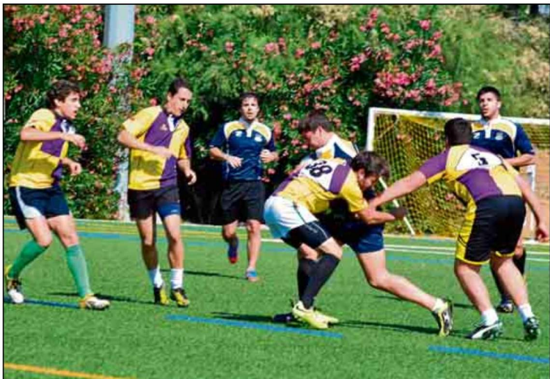
Los campeonatos que organiza el SADUS siempre disfrutan de un gran número de participantes.