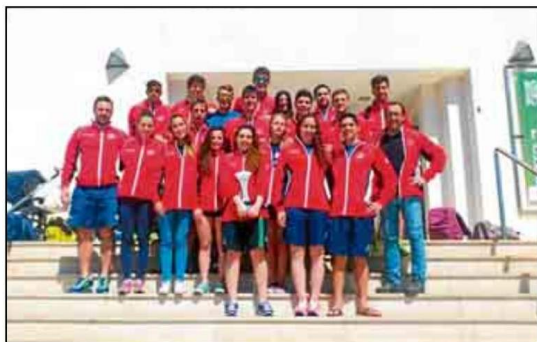
El SADUS ya ha dado a conocer las fechas para los interesados.

convocatoria. Así, el plazo para la presentación de la documentación o para la subsanación de algún apartado de la solicitud será del 26 de junio al 1 de julio de 2014, ambos inclusive, teniendo que presentar la documentación requerida en el Registro General Auxiliar de la Universidad de Sevilla (Pabellón de Brasil) o en el Registro General de la Universidad (Rectorado), pudiendo solicitarse previamente en el Servicio de Becas las aclaraciones que se estimen oportunas. A los interesados que no entreguen la documentación requerida o no subsanen su solicitud en el plazo antes establecido se les tendrán por desistidos de su petición, notificándose en la Resolución definitiva de la convocatoria.