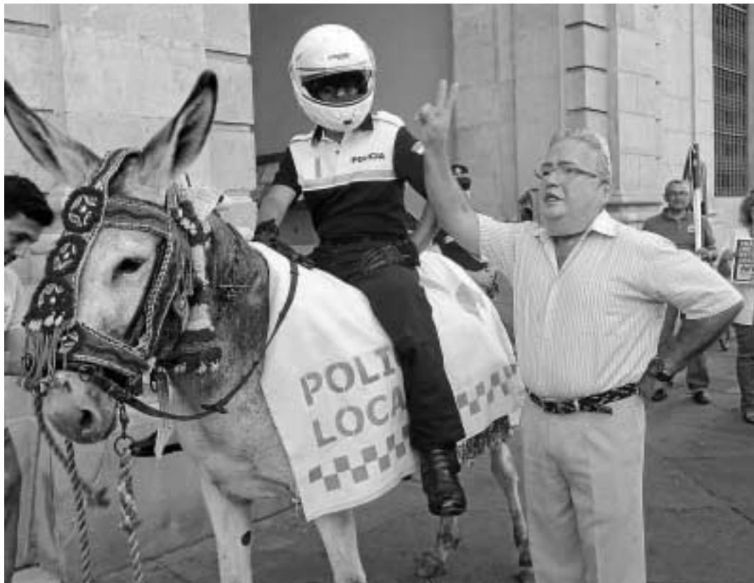
Los policías locales protestaron montados en burro y parodiando a Zoido. Al fondo, protesta contra la zona azul.