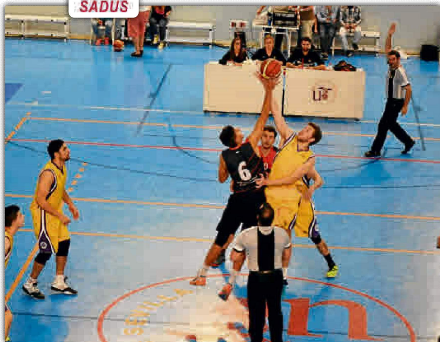
Imagen de uno de los partidos disputados durante estos CEU por la Universidad de Sevilla.