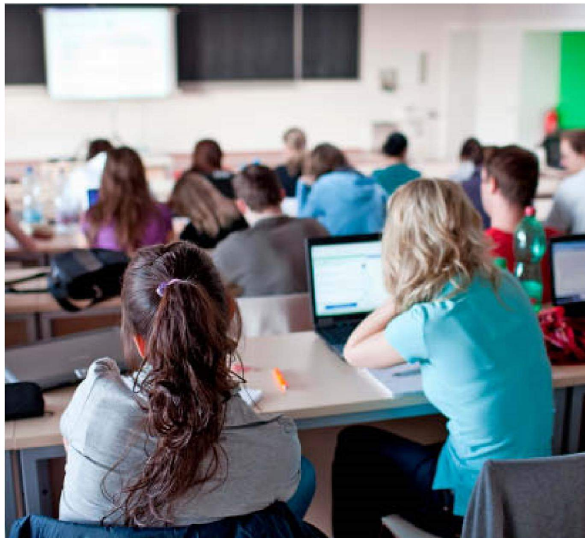
El sistema universitario español asumió el Plan Bolonia en el año 2008.