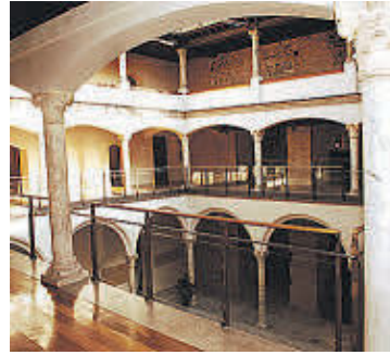
UCLM, campus en Toledo. EE

El Colectivo de Estudiantes de Ciudad Real, perteneciente a Estu-