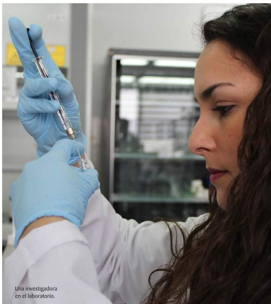
Una investigadora en el laboratorio.

La fibra se sumerge en el líquido que se pretende analizar y se genera un campo eléctrico para atraer las cargas negativas de los parabenos y que se introduzcan dentro de la fibra hueca, por diferencia de potencial. "Somos expertos y pioneros a nivel nacional en el desarrollo de estas electromembranas, que adaptamos al compuesto que se necesite analizar. En este caso nos centramos en los parabenos por su papel como contaminantes emergentes en aguas superficiales", detalla.