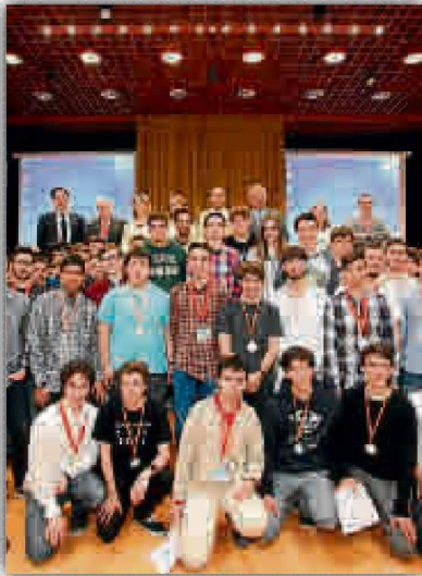
Los ganadores con sus medallas.