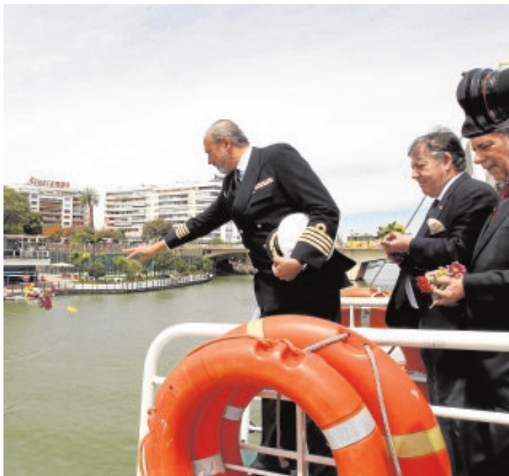
Momento de la ofrenda floral en honor de Magallanes