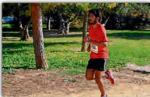
El running es una de las actividades de moda.

se a cada uno de los usuarios que deseen hacer uso de las mismas. Todo esto se suma a la conexión con el Parque de Los Bermejales y su gran extensión para el trazado de circuitos aptos para el running. El Circuito Natural es una manera distinta de trabajar la tonificación muscular y la coordinación alternándose con la carrera o la marcha, trabajando al aire libre y con la posibilidad de su uso en cualquier momento. En definitiva, un lugar donde poder desarrollar actividades deportivas al gusto de cada uno de forma amena y al aire libre en un paraje prácticamente inigualable.