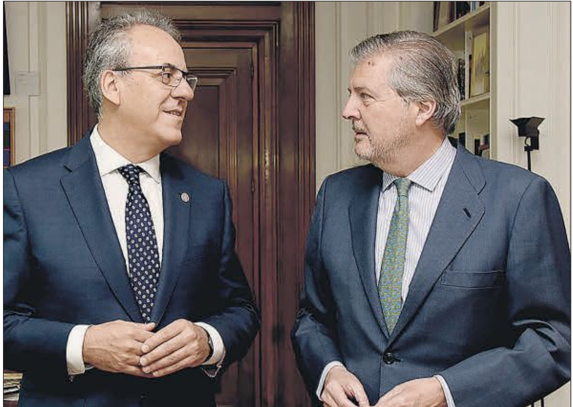
Segundo Píriz, de la CRUE, y el ministro Íñigo Méndez de Vigo. EE

Por su parte, Educación determinará el marco general de la prueba, las características, el diseño y los contenidos. El diseño del examen será presentado a las Comunidades Autónomas en la próxima Conferencia Sectorial y será la base de un