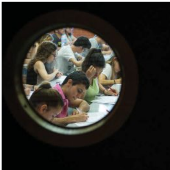
Estudiantes de Valencia realizan la Prueba de Acceso a la Universidad.