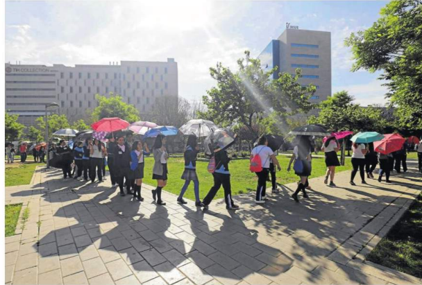
Una 'paraguada' para pedir apoyo a la educación.

En Sevilla, el acto central de la Semana ha reunido a cerca de 300 escolares de 12 centros educativos de todos los niveles en un acto simbólico en defensa de la financiación de la educación. La acción comenzó a las 10.30 en el Parque Rosario Valpuesta con diversos juegos colaborativos y una paraguada simbólica. Acompañado por la batucada del instituto Cavaleri de Mairena del Aljarafe, el grupo se ha desplazado desde allí hasta el salón de actos de la Fa-