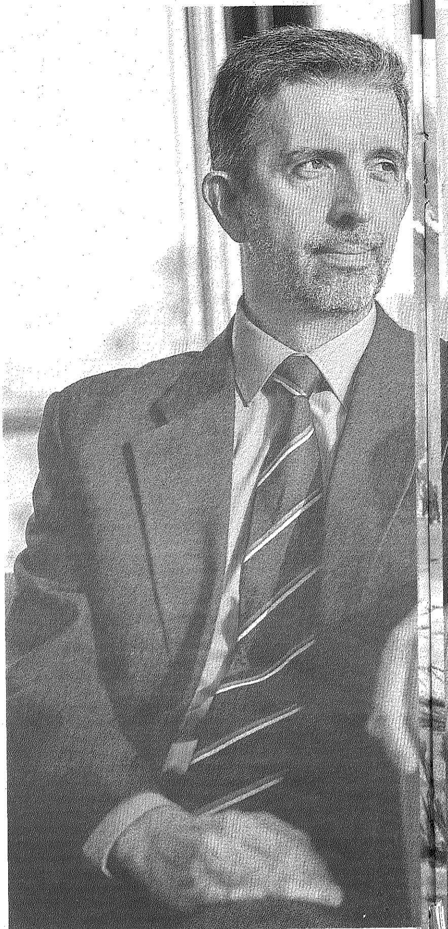
El presidente del Colegio de Aparejadores y Arquitectos Técnicos de

No podría emitir este hombre un diagnóstico de cómo está Sevilla del cero al diez, vista por un aparejador, si está