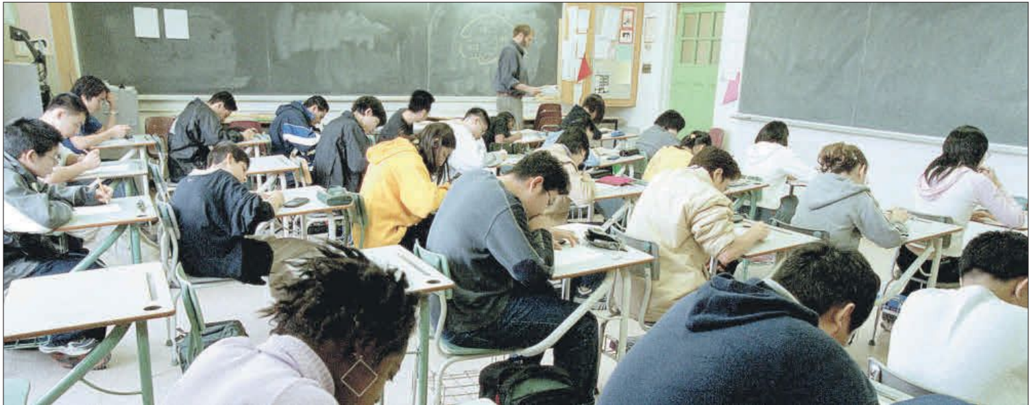
Estudiantes de Toronto en un examen de matemáticas.