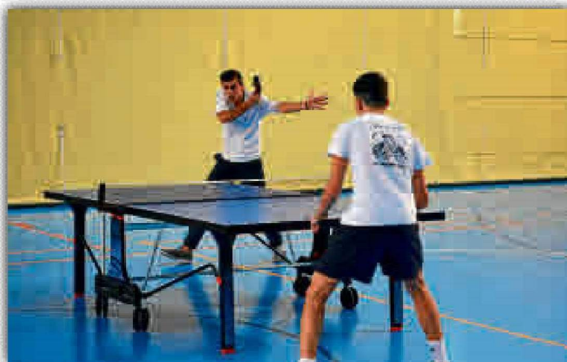
El tenis de mesa, uno de los deportes que vuelve a la carga.

En cuanto a los deportes de raqueta, el II Torneo de tenis se disputará el próximo 8 de febrero, por lo que la inscripción estará abierta hasta siete días antes de la celebración del trofeo. El segundo de pádel será el 15 de febrero, finalizando la inscripción para el mismo día 8 del mismo mes. Por último, el II Torneo de pádel será el 19 de febrero. El SADUS recuerda que para poder competir es necesario ser miembro de la comunidad universitaria, poseer el Abono o el Pase de Temporada. Además, recuerdan que cada centro de estudios de la Hispalense cuenta con un gestor deportivo, encargado de solucionar dudas y dispuesto a ofrecer información a los interesados.