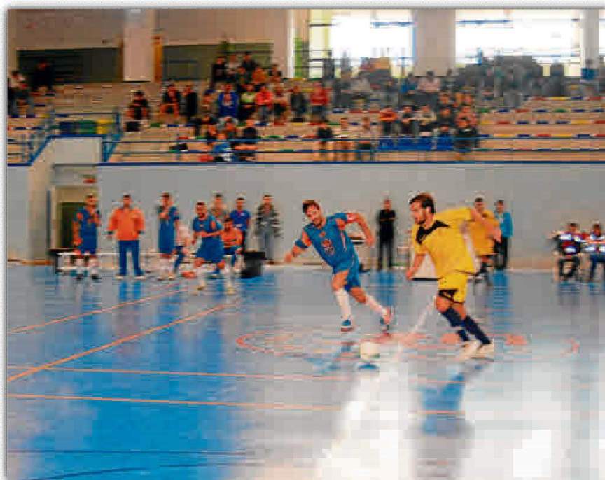
El Servicio de Actividades Deportivas de la US busca la proyección de sus deportistas.